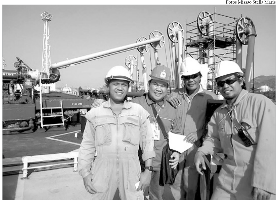
Experiência em Taiwan ajudou a conhecer a realidade dos trabalhadores marítimos

Então, minha irmã estava trabalhando em Taiwan e me convidou para passar férias. Chegando lá, comecei a estudar Mandarim, um curso que durou um ano. Meus planos eram melhorar o meu currículo e voltar para as Filipinas, pensando numa promoção. Mas então, aconteceu que eu passei a frequentar uma Igreja em que havia muitos imigrantes filipinos. Comecei a ajudar o padre, justamente com esse público. Eram, principalmente, trabalhadores das fábricas e trabalhadores