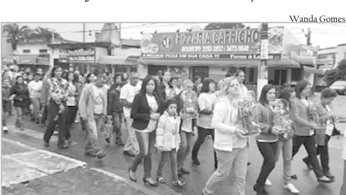
Caminhada da Família - Santo Antonio/PG