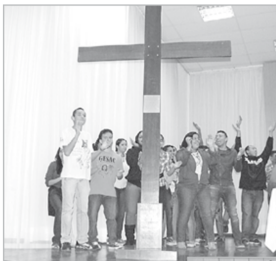
Jovens na Sessão Solene de S. Vicente. Acima: Missa de abertura em Guarujá

da fé cristã aos filhos, que aconteceram nessa Semana. Podemos hoje elevar a Deus um hino de louvor por cada pessoa que organizou, participou e motivou a nossa Semana Nacional da Família.