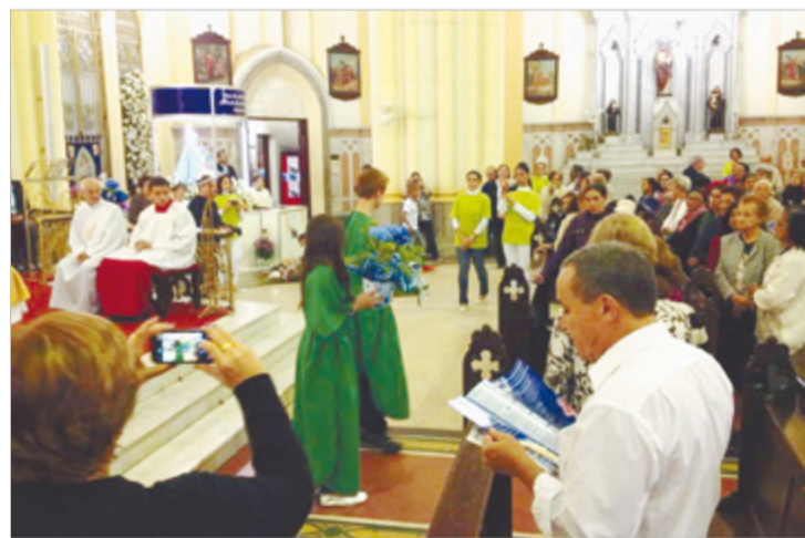
Festa envolve todas as paróquias de Santos

Morro, foram surpreendidos por um desmoronamento, o que induziu os invasores a deixarem a cidade.