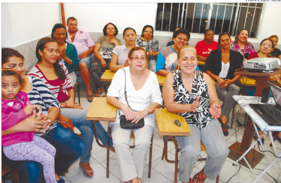
Alunos de todas as idades estão decididos a enfrentar o ‘bicho-papão’ dos computadores