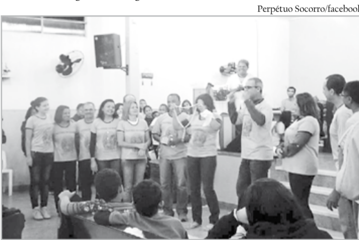
Teatro sobre a família na Perpétuo Socorro/SV