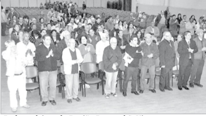
Padres e leigos da Região Pastoral S. Vicente

A transmissão e a educação da fé cristã na família, encorajando os pais nessa nobre e exigente missão que possuem de ser os primeiros colaboradores de Deus na orientação fundamental da existência e a segurança de um bom futuro. Para isso, "é importante que os pais cultivem as práticas comuns de fé na família, que acompanhem o amadurecimento de fé dos filhos" (Carta Enc. Lumem Fidei, 53). Papa Francisco (carta pela ocasião da Semana Nacional da Família - 2013)