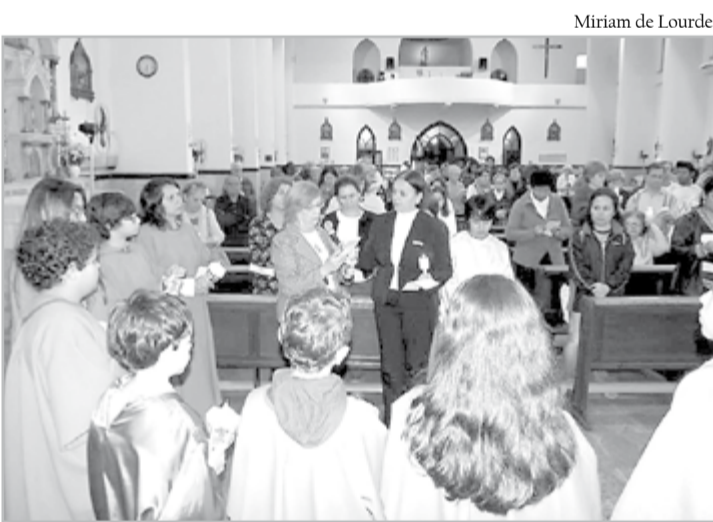
Terço Luminoso na Pompéia/Santos