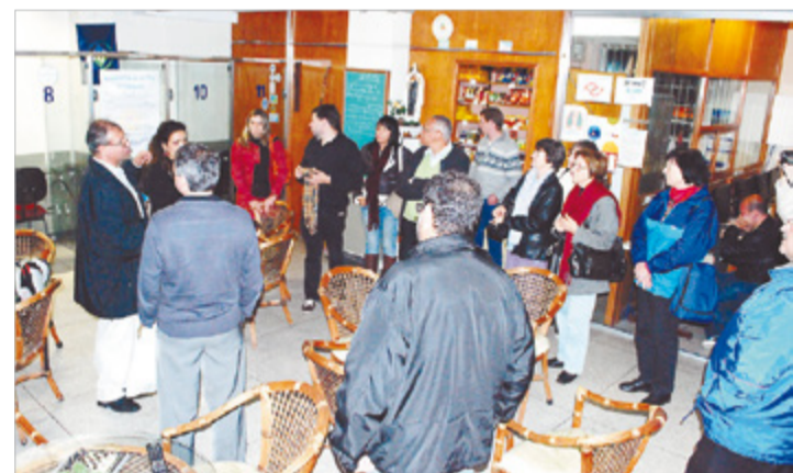
Na Missão Stella Maris e o trabalho junto aos marítimos

Os participantes destacaram alguns pontos em comum às diferentes pastorais e que, ao mesmo tempo constituem grandes desafios: a valorização da pessoa humana e o respeito