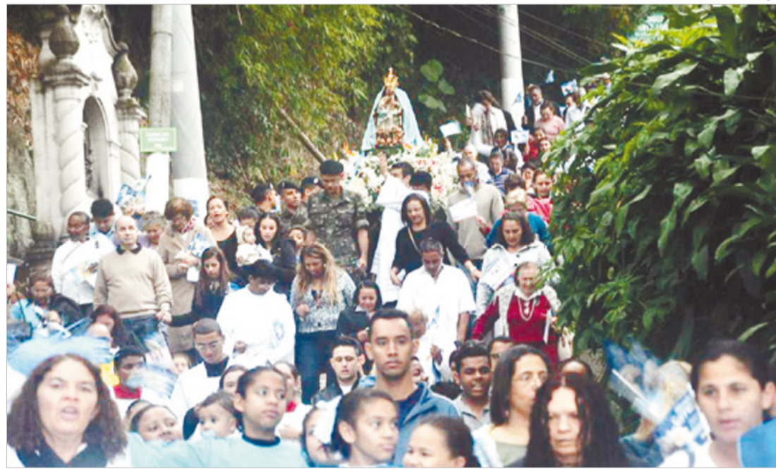
Como mãe cuidadora, Nossa Senhora ‘desce’ de sua casa e vem ficar perto dos filhos

A grande devoção popular começou quando, em 1614, saqueadores holandeses invadiram a Capitania de São Vicente no intuito de destruir a Cidade. A população buscou refúgio na Capela, pedindo a proteção da Virgem. Quando os soldados subiam o