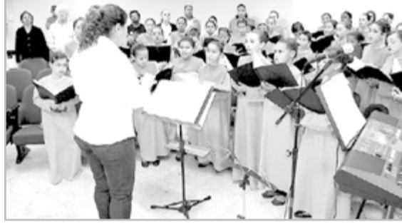
Meninos e meninas cantores de Frei Jorge/Peruibe