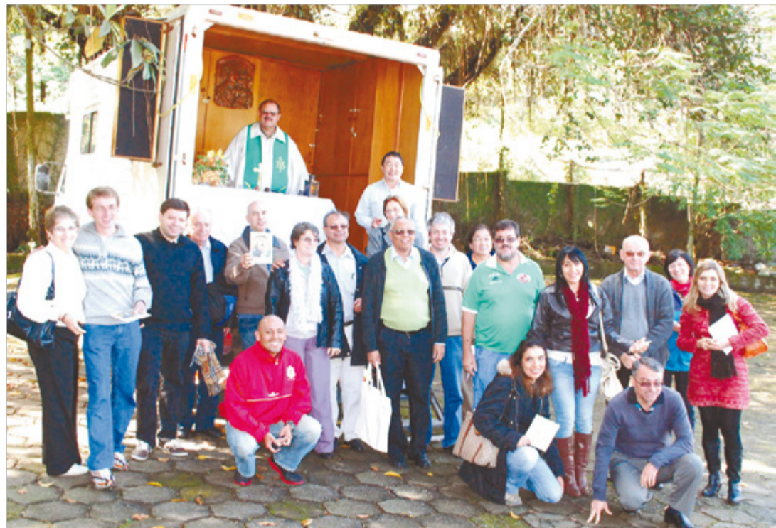
Participantes do encontro junto ao caminhão-capela da Pastoral Rodoviária

Outro trabalho que também chamou a atenção foi a Pastoral Rodoviária, com