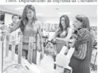
Jovens desenvolvem atividades práticas durante as oficinas e participam de bate-papo com profissionais