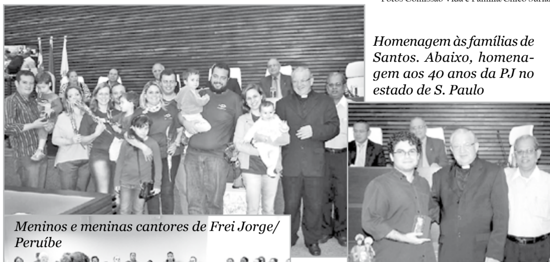
Homenagem às famílias de Santos. Abaixo, homenagem aos 40 anos da PJ no estado de S. Paulo

Enfim, Deus seja louvado, bendito, honrado e adorado pelas atividades e ações evangelizadoras em prol da família cristã, em especial, na transmissão e educação