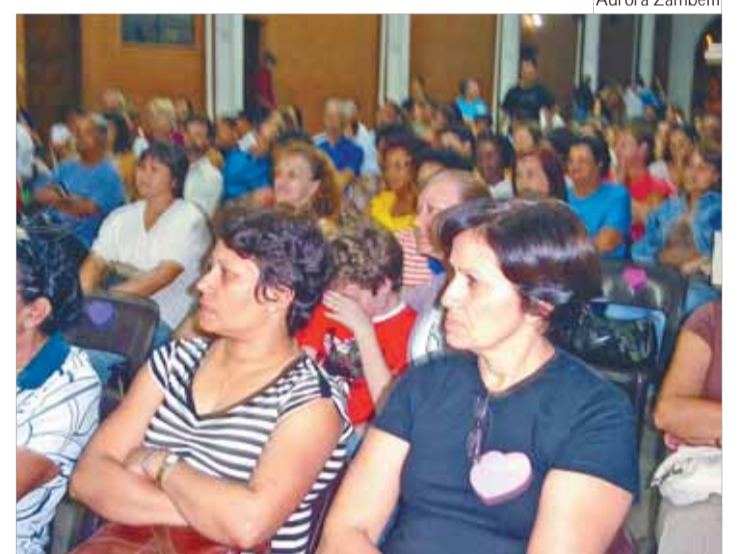
Palestra sobre "vocação na família", na paróquia N. Sra. Aparecida, em Santos.