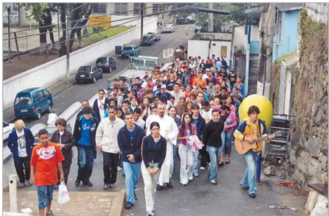
... ajudou os jovens a refletirem sobre sua caminhada vocacional na igreja e na sociedade