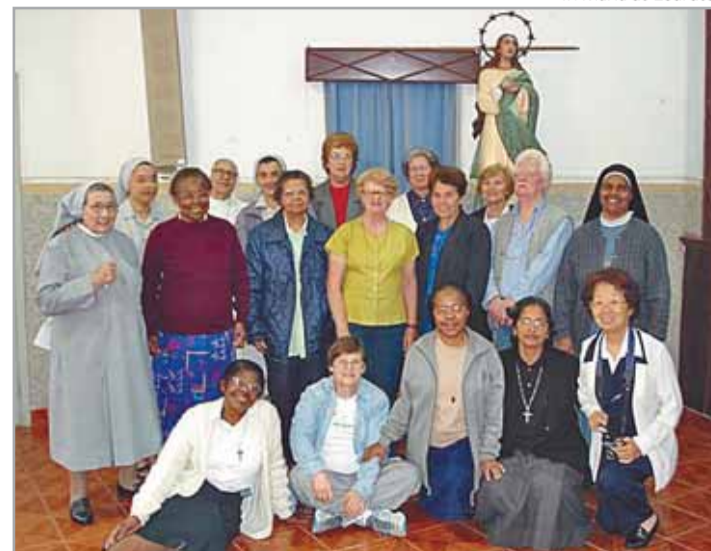
Comemoração aconteceu em clima de oração e fraternidade

No dia 19 de agosto, religiosas de várias Congregações estiveram reunidas no Pensionato das Religiosas de Maria Imaculada, em Santos. Durante o período da manhã, rezaram e refletiram sobre "A Palavra de Deus recriando novas relações", tema da última Assembléia da CRB-SP (Conferência dos(as) religiosos(as) do Estado de São Paulo). Fraternalmente foi celebrado nesse encontro o Dia da Vocação Religiosa.