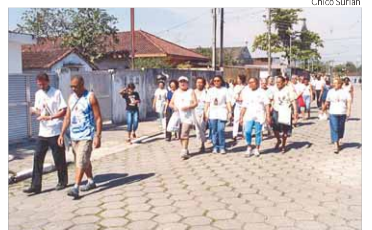
Visita Missionária às famílias com doentes, na paróquia N. Sra. Aparecida, em São Vicente.