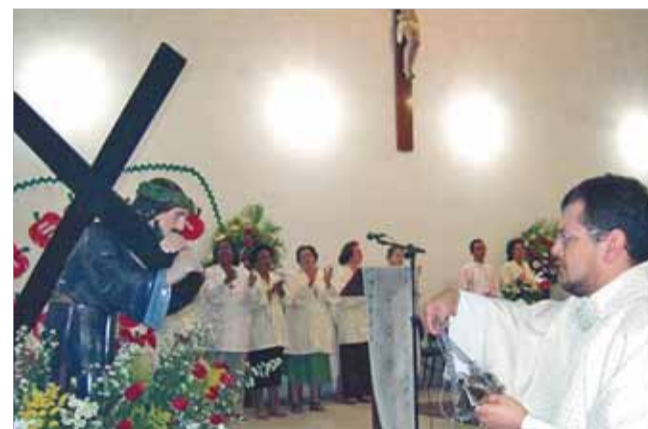
Imagem relembra a origem da comunidade

A comunidade do Bom Jesus dos Passos (Paróquia Nossa Senhora das Graças), em Vicente de Carvalho, no Guarujá, celebrou no dia 6 de agosto passado a festa do padroeiro, com missa e procissão.