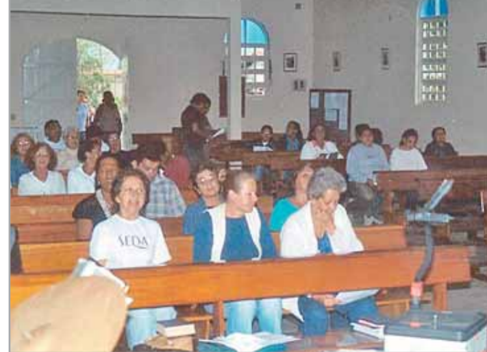
Formação contínua é uma necessidade dos agentes