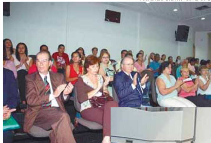
Sessão solene na Câmara Municipal de Cubatão

depois um evento nacional, assumido pela CNBB, através da Pastoral Familiar.