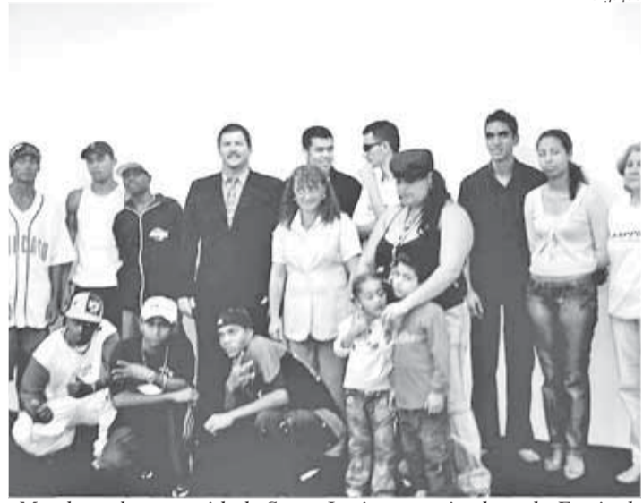
Membros da comunidade Santa Luzia, organizadora do Festival