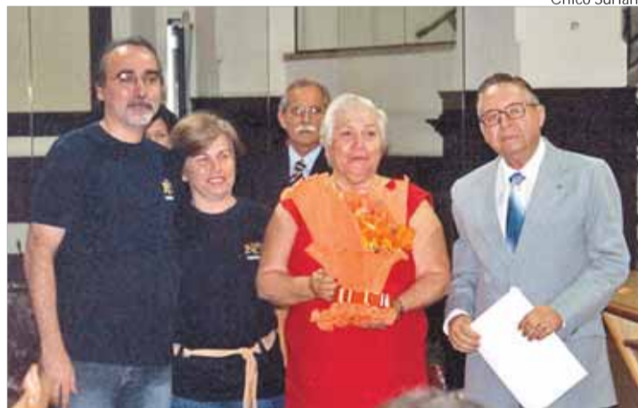
Membros da Equipe de Nossa Senhora, movimento que deu origem à Semana da Família, recebem homenagem na Câmara de Santos