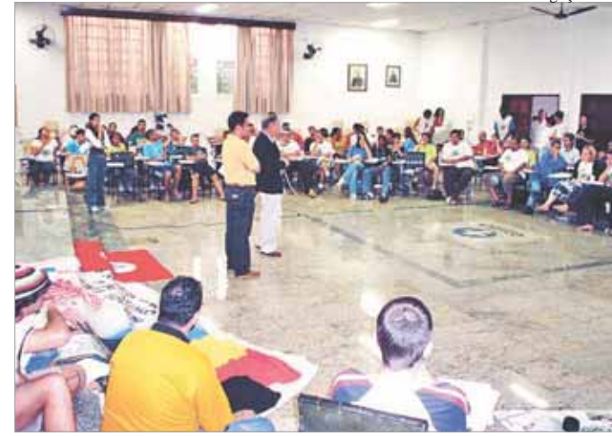
Dom Gorgônio, bispo de Itapetininga, fala aos jovens