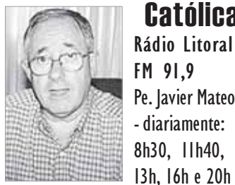
Rádio Litoral FM 91,9 Pe. Javier Mateo - diariamente: 8h30, 11h40, 13h, 16h e 20h