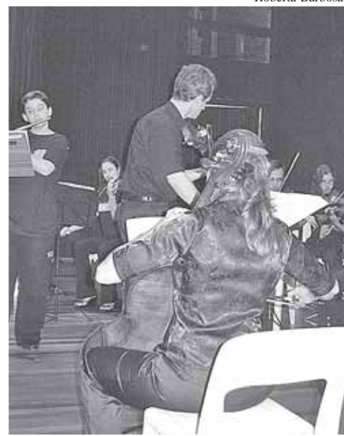
Orquestra de Cordas Henrique Oswald

Com repertório variado e arranjos especialmente montados para a ocasião, a Orquestra de Cordas Henrique Oswald se apresentou no Liceu Santista com 15 músicos (violinos e cellos) e alguns convidados especiais, com flauta transversal e violão. O