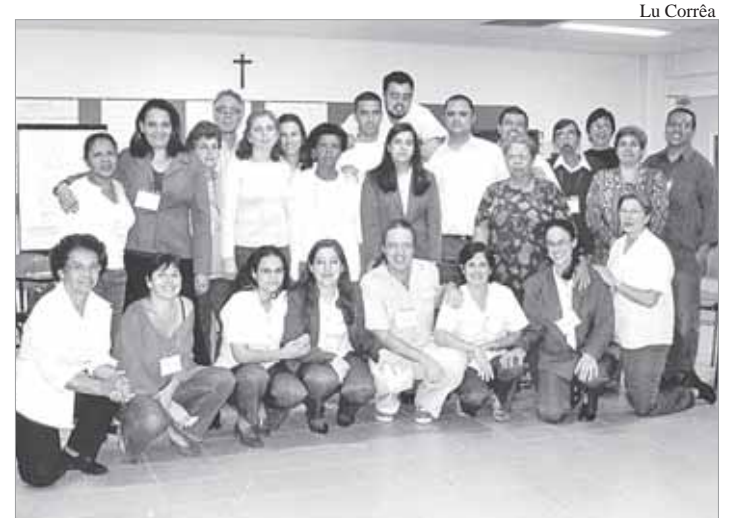
Funcionários da Cúria com professores da UniSantos