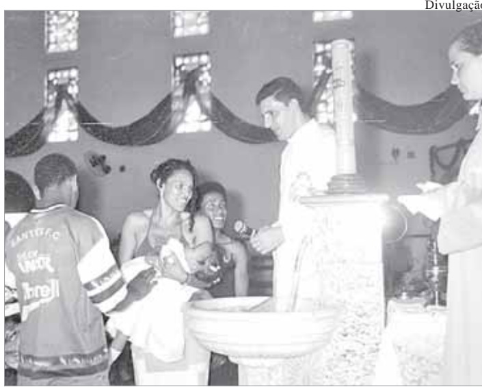
Comunidade celebra a chegada de novos membros

A Pastoral procura orientar as mães sobre como dar ao seu filho uma alimentação saudável, realizando palestras e discussões so-