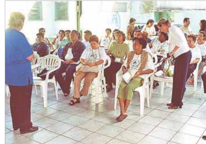
Agentes devem orientar as mães sobre cuidados com a saúde