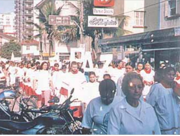
Crianças e jovens procuram alertar a população