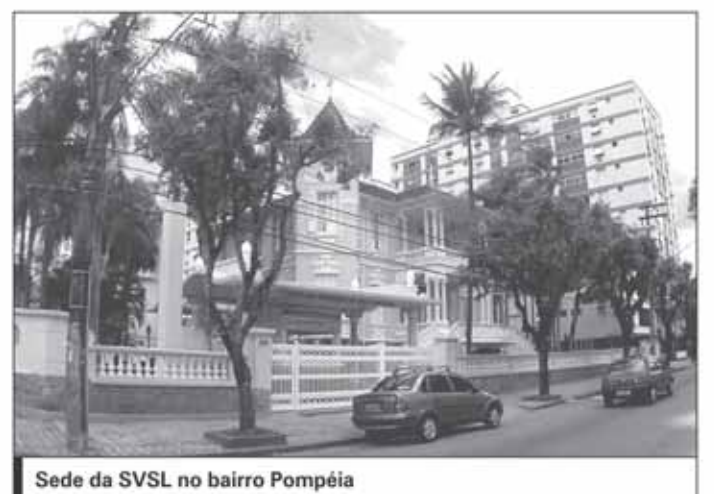
Sede da SVSL no bairro Pompéia