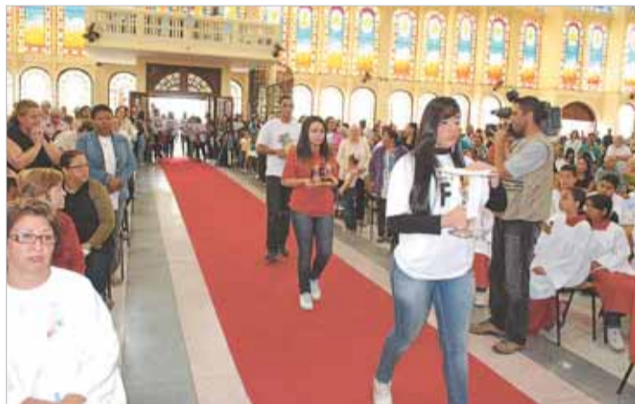
Jovens na procissão das oferendas na missa do dia 27/9