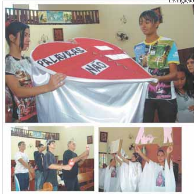
Acima: Sag. Família; abaixo: Matriz e Sag. Coração

Pelo quarto ano consecutivo, a Pastoral Catequética da paróquia N. Sra. das Graças, de Vicente de Carvalho, através das turmas de Crismandos, realizou o Festival de Entradas da Bíblia . O evento aconteceu no dia 11/9, na Matriz, e contou com a participação de 11 turmas.