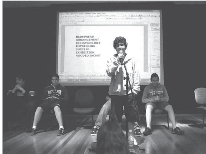
Contação de histórias com recursos multimídia, concursos de poesia e de soletração de palavras fazem parte do programa

O corpo docente do Ensino Bilíngue mantém-se informado por meio de cursos de especialização no Brasil e no exterior. Um grupo de professoras participou, durante o mês de julho, do OTA (Oxford Teacher's Academy), um programa de desenvolvimento profissional para professores de Língua Inglesa. O curso amplia as bases metodológicas para o ensino do idioma, oferecendo ideias práticas e criativas para uso em sala de aula,