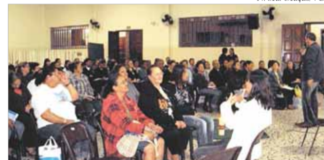
N. Sra. Graças/VC