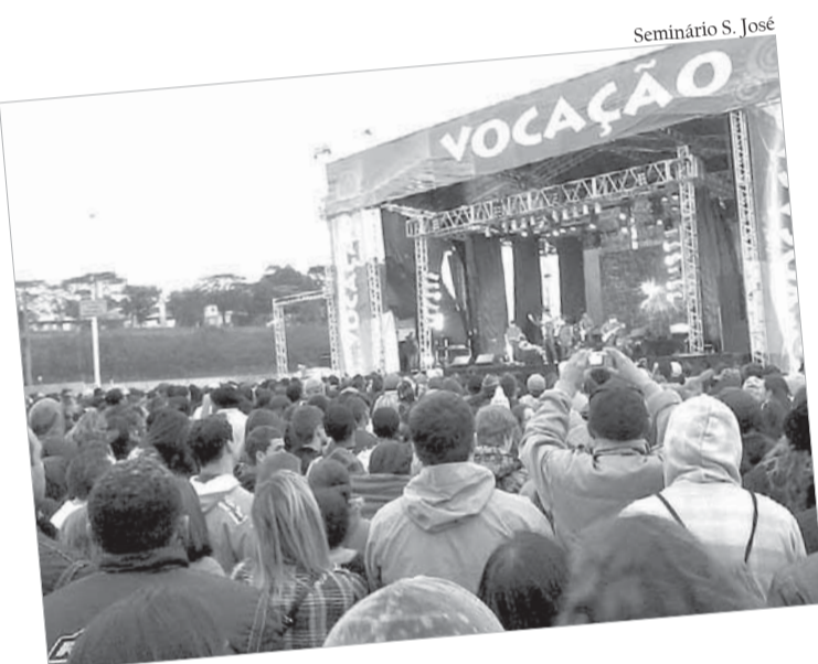
21/8 - O seminário Diocesano São José esteve presente no evento “COMVOCAÇÃO”, em Barueri, no dia 21 de agosto de 2011. A Pastoral Vocacional, e os vocacionados que pretendem ingressar no Seminário a partir de 2012, participaram deste grande evento vocacional católico promovido pela Diocese de Osasco, onde se reuniram cerca de 15 mil jovens em espírito de louvor e adoração!