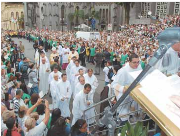
Pastoral da Saúde