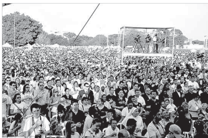
Cruz e Ícone vão percorrer todo o Brasil e alguns países do Cone sul até julho de 2013