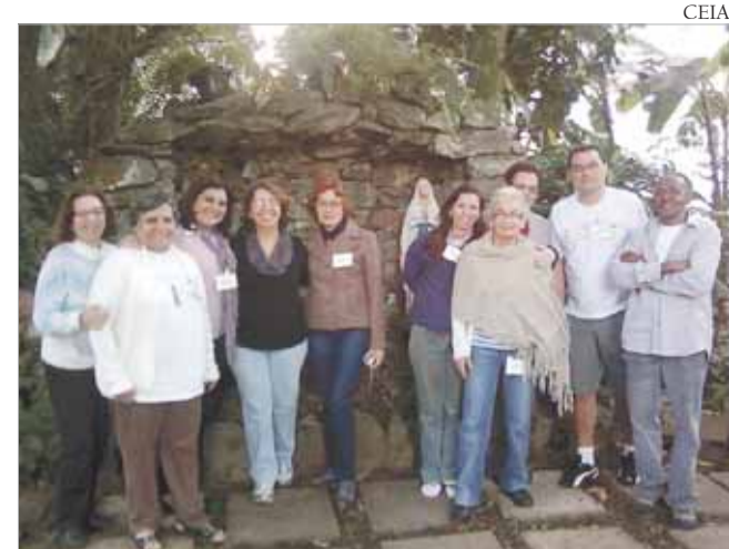
Participantes redescobrem importância da oração