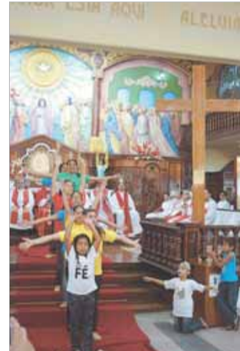
“No peito eu levo uma cruz, no meu coração o que disse Jesus...”