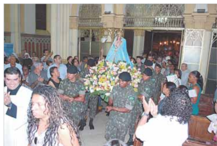
No dia 28/8, a Padroeira ‘desce’ do seu Santuário no alto do Monte Serrat e fica na Catedral, mais perto dos fiéis

Em seguida, os fiéis participaram da procissão pelas escadarias do Monte Serrat, quando a imagem de Nossa Senhora retornou ao Santuário.