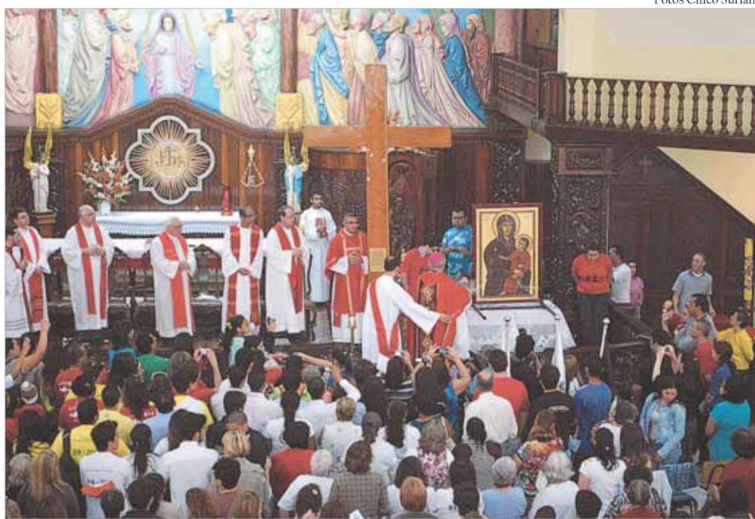
A Cruz e o Ícone de N. Senhora relembra o compromisso missionário de todo cristão