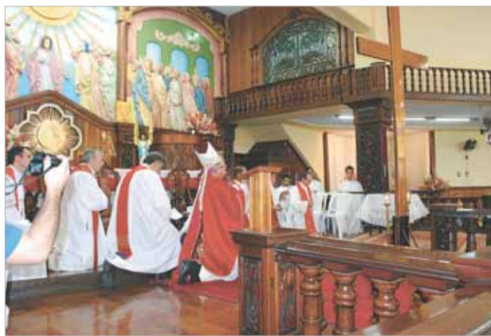
Clero diocesano nas celebrações na Igreja S. Francisco