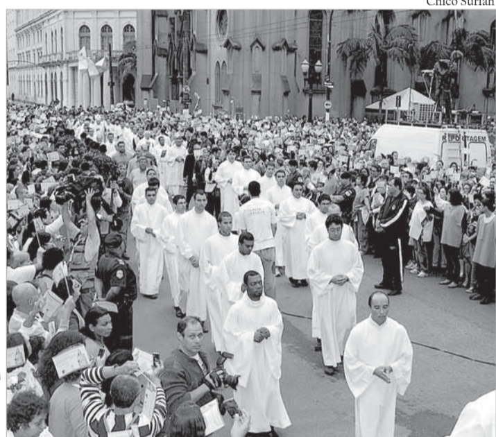
8/9 - Festa de Nossa Senhora do Monte Serrat