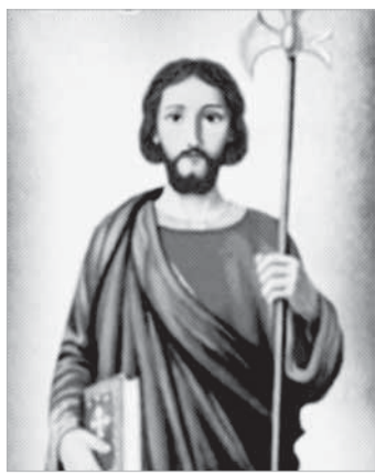
S. JUDAS TADEU