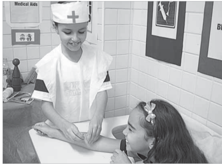
Os liceístas participam de simulações de hotel, aeroporto, hospital para colocar em prática vocabulário aprendido

enriquecendo ainda mais a aprendizagem do idioma.