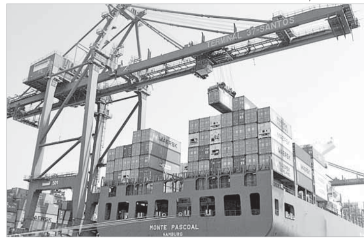
Tecnologia Portuária: curso inédito no País

Com 60 anos de história na região, tem no seu histórico a qualidade na formação