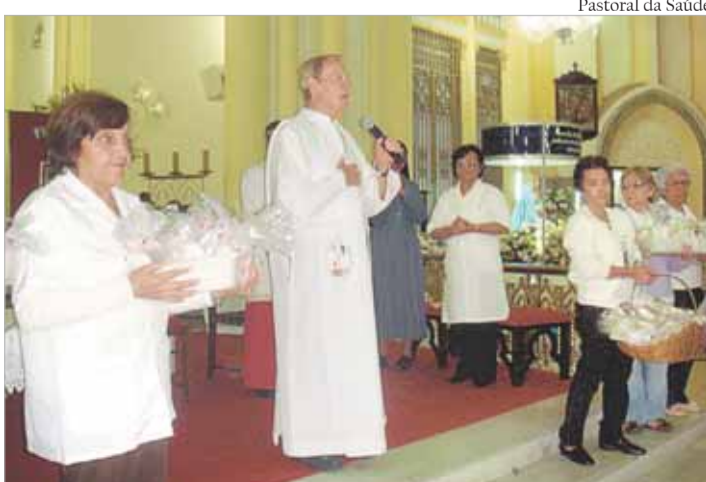
Assim como a Pastoral da Saúde (foto), a novena da Padroeira reúne diversos grupos de pastorais e movimentos de toda as paróquias