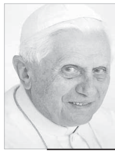
Papa Bento XVI

Esta finalidade é continuamente renovada pela celebração da liturgia, de maneira especial da Eucaristia, que se conclui sempre fazendo ressoar o mandato de Jesus ressuscitado aos Apóstolos: "Ide..." (Mt 28,19). A liturgia é sempre um chamado "do mundo" e um novo envio "ao mundo", para dar testemunho daquilo que se experimenta: o poder salvífico da Palavra de Deus, o poder salvífico do Mistério Pascal de Cristo. Todos aqueles que encontraram o Senhor ressuscitado sentiram a necessidade de o anunciar aos outros, como fizeram os dois discípulos de Emaús. Depois de terem reconhecido o Senhor na fração do pão, eles "partiram sem hesitação e voltaram para Jerusalém. Ai encontraram reunidos os Onze", e contaram