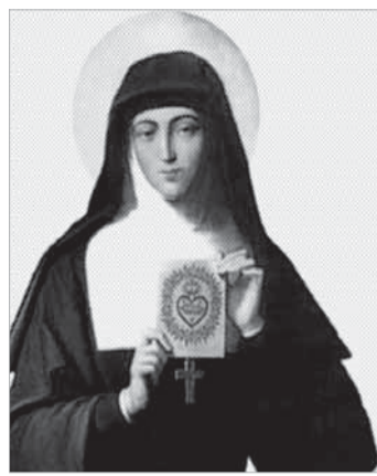
SANTA MARGARIDA MARIA

Festa de N. S. Aparecida - SV - De 29/9 a 12/10 29/9 - 19h30 - Novena e missa. 30/9 - 17h. Ofício de Nossa Senhora. 19h - Missa 1/10 - 19h - Missa. 2/10 - 18h30 - Missa. 3/10 - 19h - Missa. 4/10 - 15h - Bênção dos animais. 19h - Missa. De 5 a 8, missa às 19h. 9/10 - 14h - Tarde Cultural. 18h30 - Missa. 10/10 - 19h - Missa. 11/10 - 19h - Missa. 12/10 - Festa de N. Sra. Aparecida - 8h - Missa Fes-