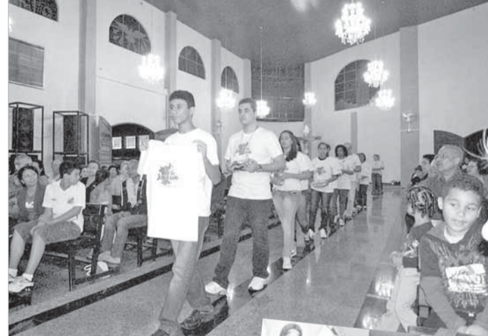
Acima: Marcha reuniu representantes de diversos movimentos. Centro e ao lado: evento terminou com a missa na S. Margarida

da Folia, Movimento das Mães de Maio, Movimento de Moradia, Projeto Arte no Dique, Sindicatos dos Estuários, dos Bancários e outros.