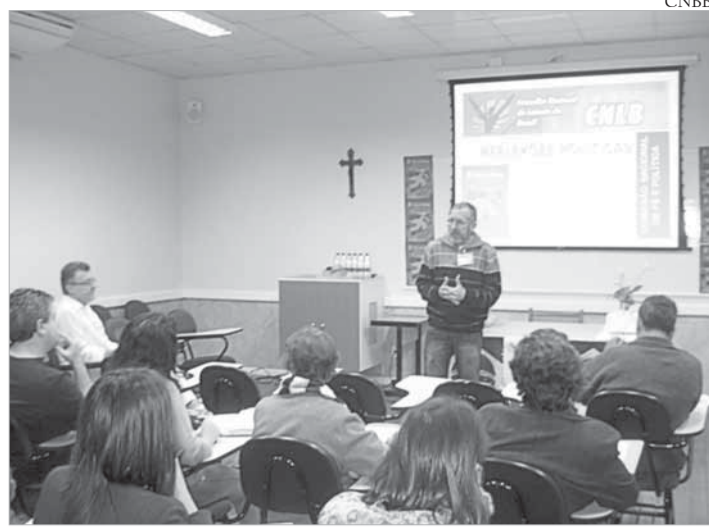
A ação do laicato em semear a dimensão política na vida pessoal e comunitária segue o mesmo exemplo dado por Jesus Cristo