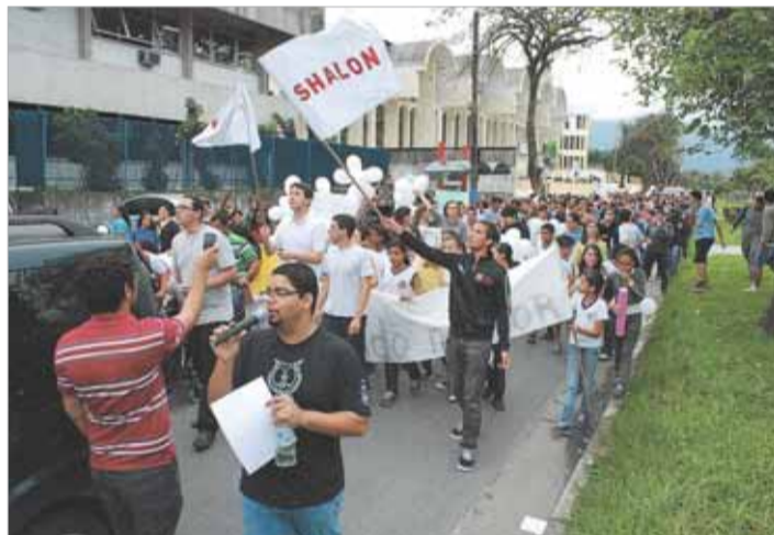
Caminhada organizada pelo Sem. Diocesano S. José