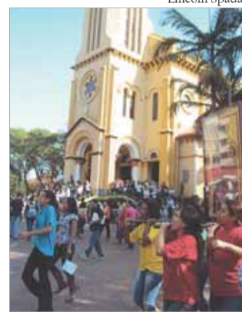
Entrega da Cruz para a Diocese de Santo André

Acompanhe a Cruz Peregrina pelo Brasil e Cone Sul: http://www.jovens-conectados.org.br/