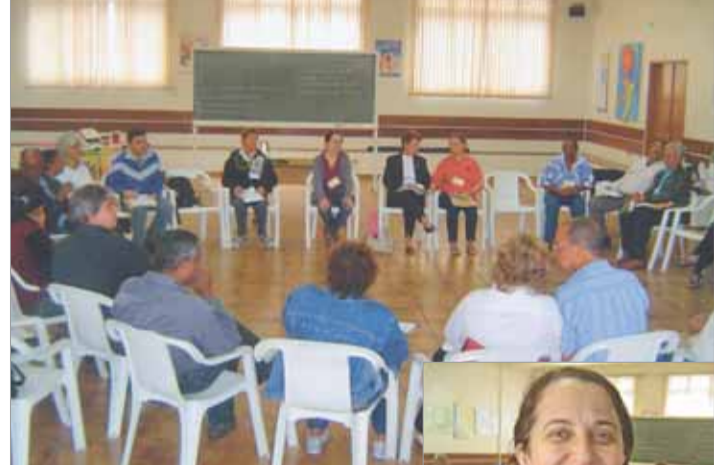
Coordenadores repensam ação missionária na diocese

Coordenadores dos conselhos missionários regionais das oito regiões pastorais da Diocese de Santos participaram do Encontro de Formação e Animação Missionária, no dia 14 de setembro. O encontro, organizado pelo Conselho Missionário Diocesano (Comidi), foi realizado na paróquia Sagrado Coração de Jesus, em Santos.