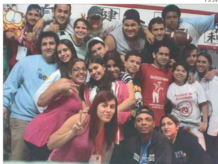
Principal objetivo é promover o protagonismo juvenil

À tarde, os coordenadores conversaram sobre a organização missionária em nível de diocese, com as estruturas paroquiais, regionais e diocesana, apontando perspectivas para a ação missionária, conforme o Documento de Aparecida.