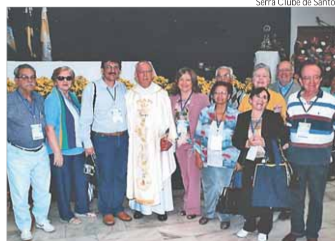
Membros do Serra Clube de Santos

O 14º Grito dos/as Excluídos/as mobilizou os 25 estados do Brasil, além do Distrito Federal. Em São Paulo, na cidade de Aparecida, 150 mil romeiros, segundo dados da Basilica, compareceram nas manifestações do Grito e da 21ª Romaria dos Trabalhadores/as para reivindicar terra, moradia, justiça, contra a violência e em defesa do território dos povos indígenas e quilombos.