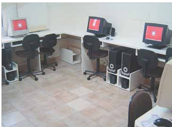
Sala pronta para o curso de informática para jovens

A Cáritas realiza ainda serviços de promoção de defesa dos