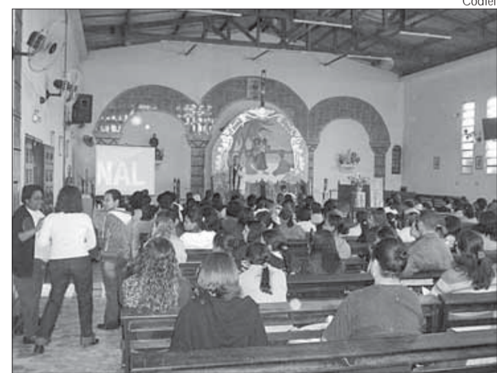
Encontro dos catequistas da Região SV e Litoral Centro

A Diocese de Santos esteve presente com 06 representantes, que estão fazendo o curso desde o seu primeiro módulo, sendo 04 integrantes da Comissão Diocesana de Educação da Fé