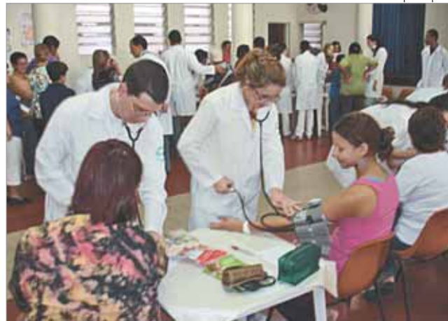
Ação e informação para colocar a saúde em dia