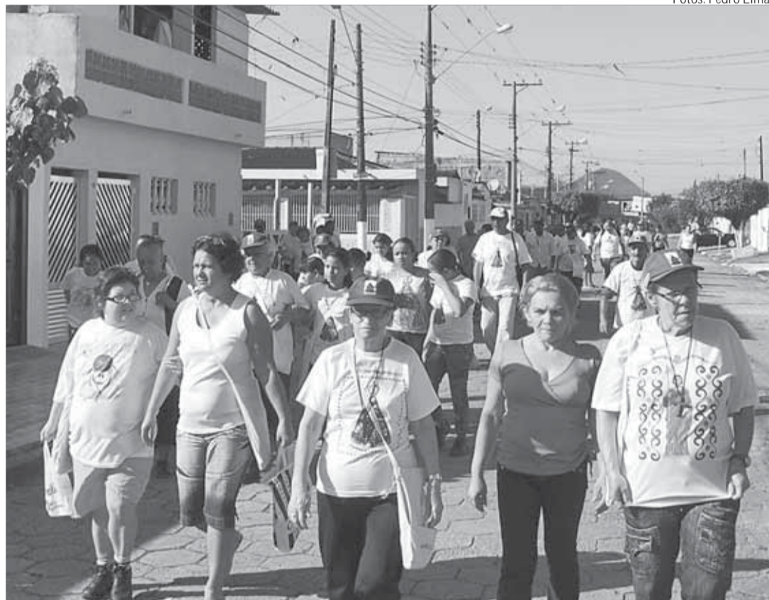
Devidamente identificados, os missionários percorrem as ruas do bairro. Abaixo: sandálias com dizeres sobre a missão: criatividade e ousadia.