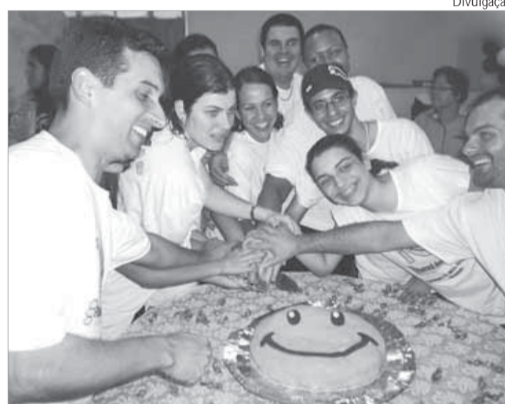
Um bolo com o símbolo da Pastoral para comemorar muitas vitórias, como a do teatro apresentado pelos jovens

E, em especial, a todos os agentes da Pastoral dos Surdos Aparecida, mães, tias