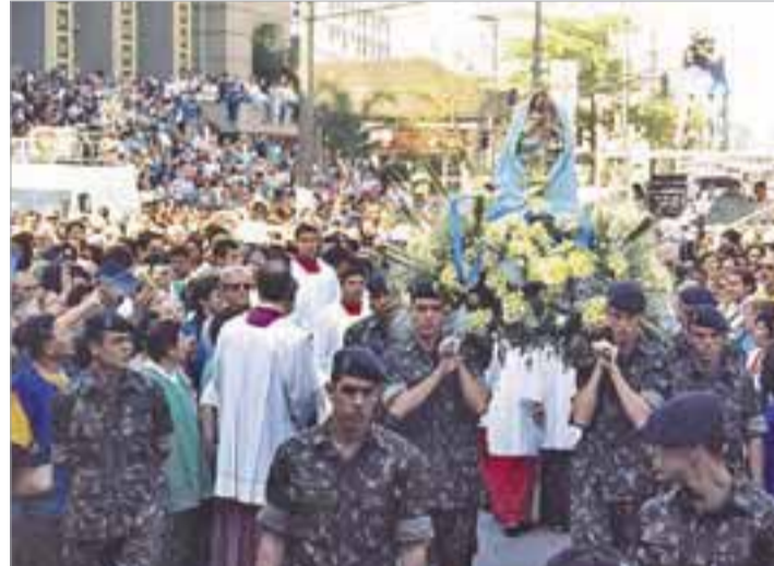
N. Senhora continua atraindo milhares de fiéis todos os anos