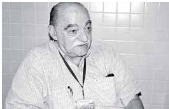
Prof. Novita: "Apelos tecnológicos levam à mudanças"

O engenheiro de produção é peça fundamental em empresas de quase todos os setores. Na região metropolitana da Baixada Santista, existem excelentes oportunidades de mercado, principalmente porque o curso