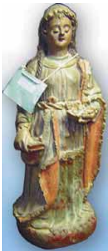
A imagem sacra de Santa Luzia, datada do século XVII, é feita em terracota policromada, de grande beleza.