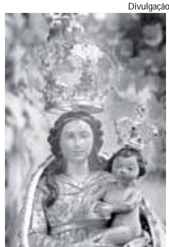
N. Sra. de Nazaré