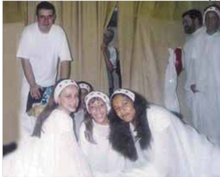
Ministério de dança é um serviço à comunidade

Fundado em 1998, o ministério Saron's Dance, da Paróquia Nossa Senhora Aparecida, em Santos, tem como objetivo incentivar os jovens a realizarem um trabalho com dança nas celebrações eucarísticas e ajudar a comunidade por meio da arte. Os componentes se conheceram no grupo de jovens da Paróquia. Eles começaram a participar do ministério de dança, mas as crianças e adolescentes da comunidade queriam frequentar o grupo. Com isso, foi montado um ministério de dança infantil. Por causa de compromissos, o primeiro grupo de dança se desfez. Foi então que, o ministério infantil passou a ser o grupo oficial Saron's Dance.