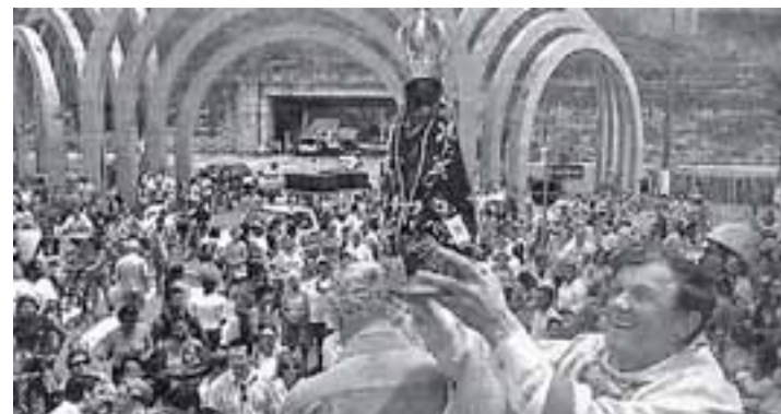
Festa de N. S. Aparecida, Padroeira de Mongaguá