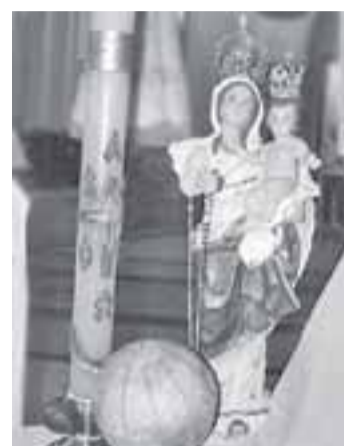
N. Sra. do Rosário