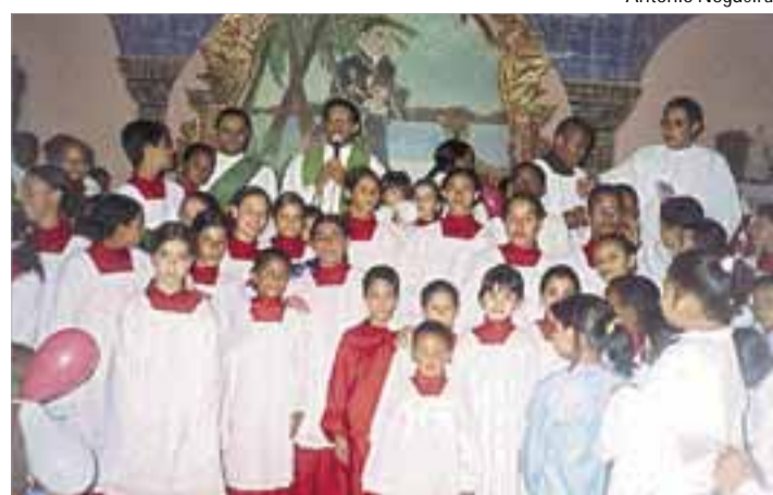
Coroinhas exibem, orgulhosos, as novas túnicas

No próximo dia 15 de outubro, as crianças da paróquia Beato José de Anchieta, no Humaitá, em São Vicente, promovem a 5ª edição do Bate Lata, caminhada de evangelização pelas ruas do bairro. O evento começa às 8 da manhã, com a missa na Capela Santíssima Trindade, de onde sai a caminhada em direção à Matriz. No final, as crianças participam da confraternização