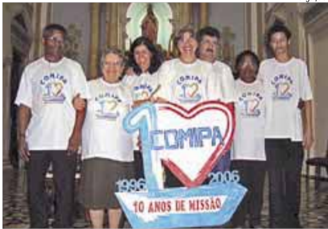
Grupo de agentes do COMIPA do Coração de Maria