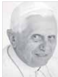
Papa Bento XVI

Mensagem do Papa Bento XVI para o Dia Mundial das Missões (22 de outubro)