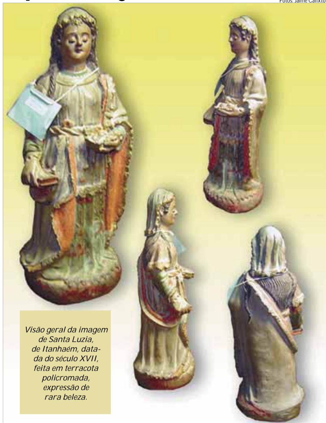
Visão geral da imagem de Santa Luzia, de Itanhaém, datada do século XVII, feita em terracota policromada, expressão de rara beleza.

de imagens sacras roubadas foi apreendido pela Polícia Federal de Minas Gerais, em um atelier particular de restauração, situado na capital São Paulo. Esta apreensão foi resultado de uma investigação de dois anos, de uma quadrilha especializada em roubos de obras de arte que atuava em Minas Gerais e em outros estados.