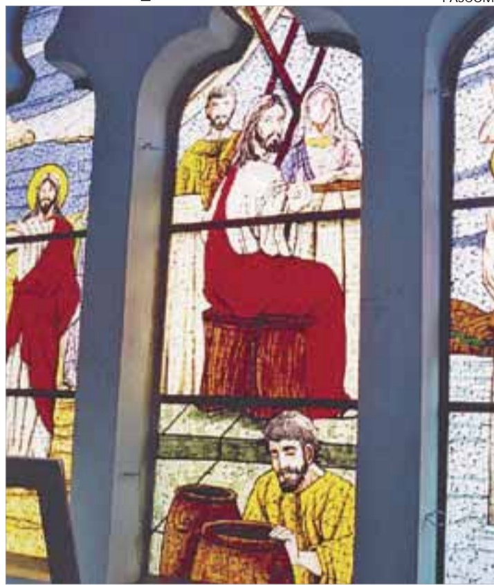
Vitral representando as Bodas de Canã, dos Mistérios Luminosos