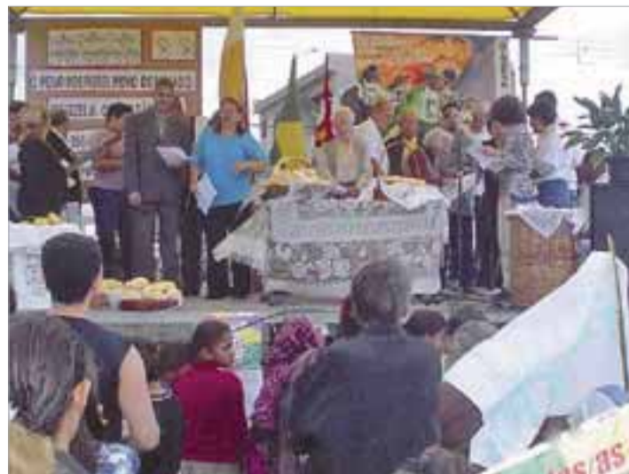
'Grito dos Excluídos' é um alerta sobre a desigualdade social