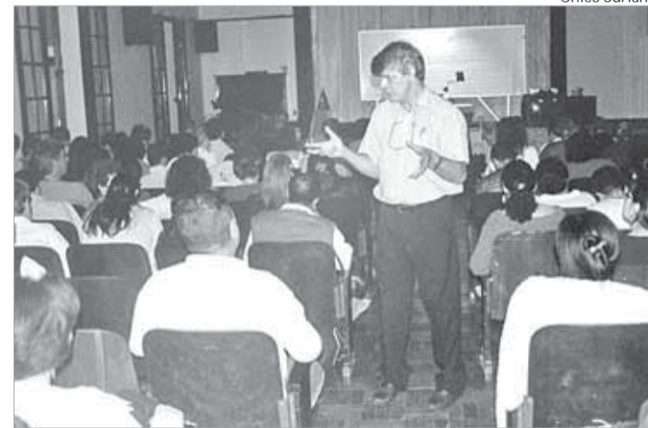
Pe. Bogaz: "Deve haver sintonia entre o gesto celebrativo e seu significado"