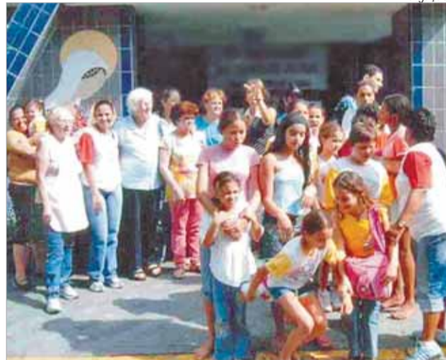
Rotina foi quebrada pela alegria dos jovens missionários