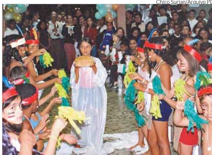
N. Sra. Auxiliadora incentiva grupos de dança e música

Os trabalhos dos participantes refletem o contexto bíblico ou o tema deste ano: "Evangelização: Discípulos e Missionários de Jesus Cristo para que Nele nossos povos tenham vida. Eu sou o caminho, a verdade e a vida", relacionando também com o tema da Campanha da Fraternidade, que este ano tra-