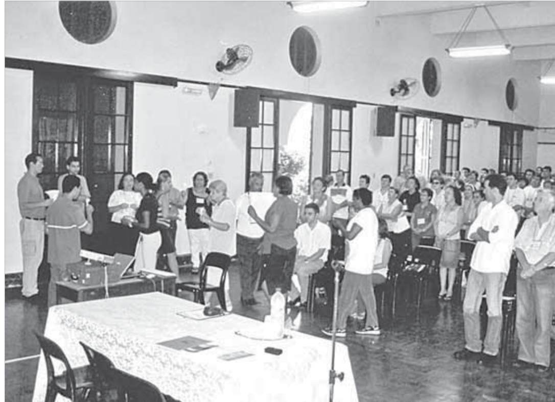
Leigos estão sendo convocados a repensar a organização e a dinâmica pastoral na Diocese