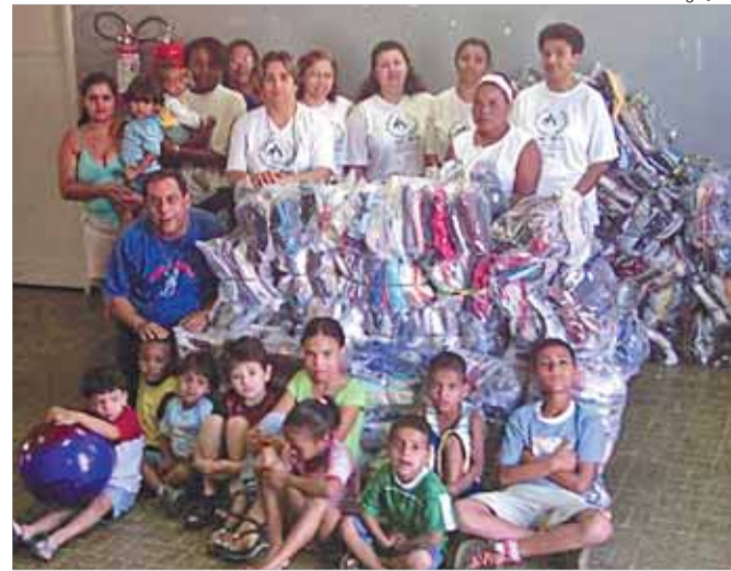
Pastoral da Criança do Morro Nova Cintra recebe doações de roupas do projeto Anjos do Senhor, em julho deste ano.