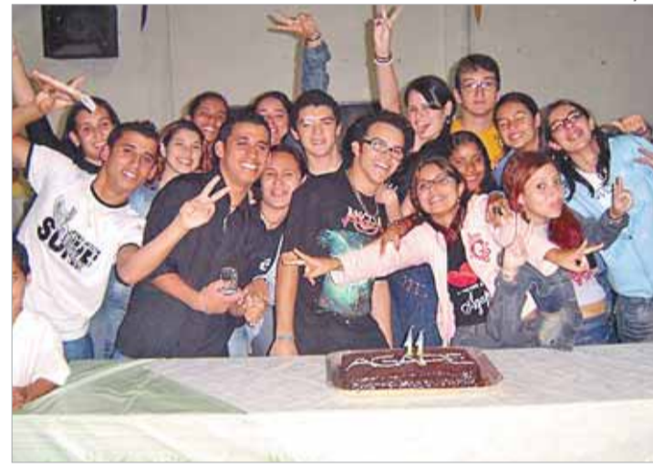
Grupo de jovens é espaço para conhecer a vida comunitária

em Comunidade. Uns assumiram a coordenação, outros foram para o serviço litúrgico, outros ainda a animação, mas todos eles uniram-se aos que ali já estavam para buscar um jeito de fazer o jovem evangelizar o jovem. O grande desafio é chegar no coração do crismando e fazê-lo tentar conhecer um grupo, fazer com que ele se dê uma chance. E para isso não basta um agente de Crisma, o grupo tem que saber convidar e acolher. Quanto à comunidade, incentivar a união entre todos os que estão dentro de um movimento maior que chamamos Juventude".