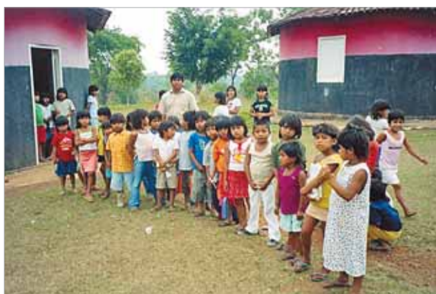
Comunidade tem mais de 2.100 moradores

por homens (69,6%). Mais da metade (55,4%) são responsáveis por crianças (filhos, sobrinhos, netos etc. Crianças até seis anos não pagam), sendo que 35,2% são casados, e 68,6% chefes do domicílio. Quanto à faixa etária, 23,9% têm entre 31 e 40 anos; 20,2% entre 21 e 30, sendo também significativa a proporção de pessoas com mais de 60 anos: 19,2%.