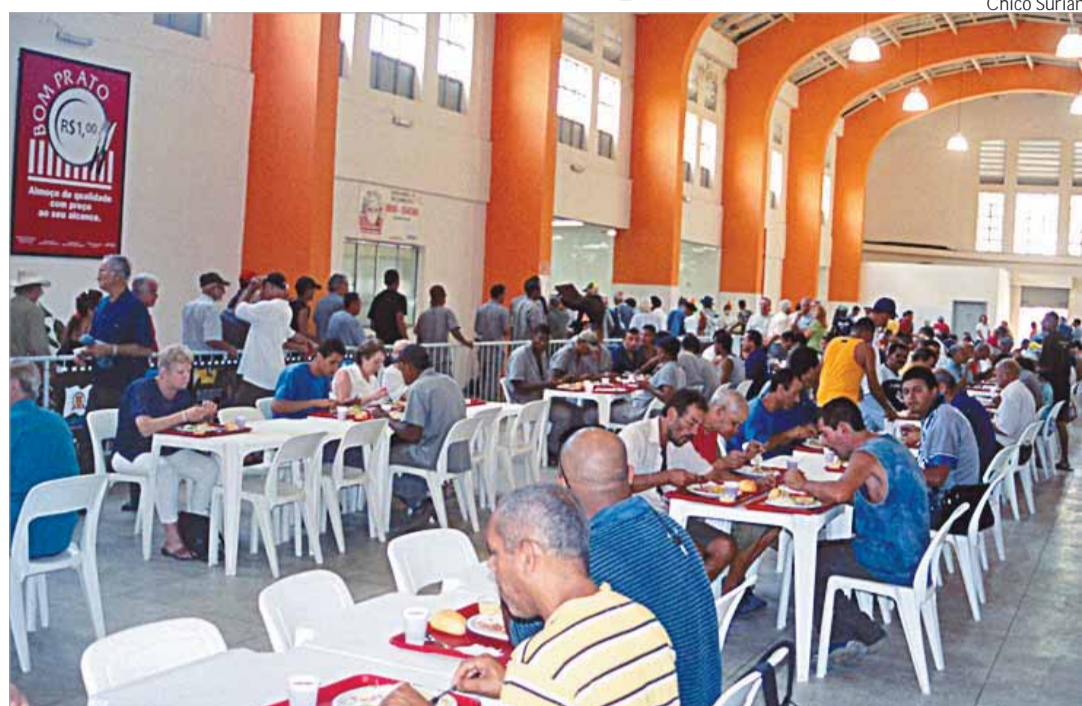
Maioria dos usuários é de homens entre 31 e 40 anos, que podem garantir refeição balanceada