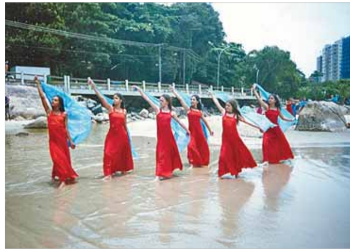
Acima: atual formação do grupo e uma das apresentações