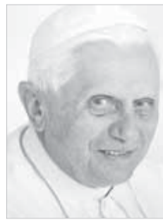
Papa Bento XVI

Este encontro é em si mesmo um sinal da oportunidade desta Carta, e se oferece como uma ocasião muito propícia para o diálogo interpessoal, o conhecimento direto entre participantes do mundo inteiro que, unidos em uma mesma comunhão eclesial, se esforçam por responder aos desafios que a sociedade contemporânea propõe aos discípulos de Cristo. Esta ex-