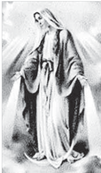
Nossa Senhora das Graças