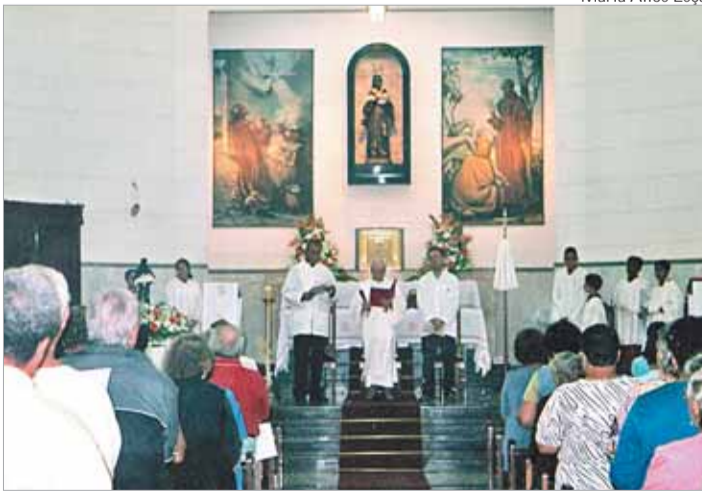
Paróquia celebrou vida e ensinamentos do padroeiro