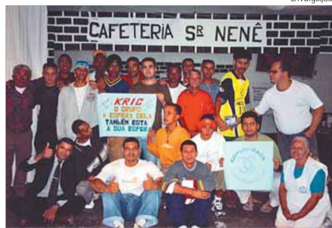
Reeducandos buscam na arte recuperação da auto-estima