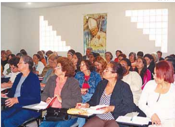
Catequistas buscam nos evangelhos fundamentos do discipulado