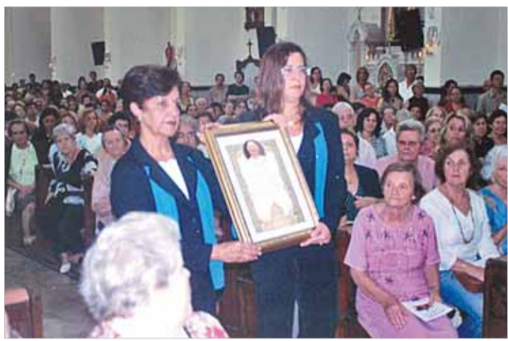
a reforma geral da igreja (ainda não concluída), eventos culturais, como a apresentação da orquestra sinfônica da Universidade Católica de Santos e palestras sobre a espiritualidade mariana.

A missa do dia 28 encerrou os festejos dos 80 anos e a festa da Padroeira, iniciados em outubro do ano passado, com grande empenho de toda a comunidade. Fizeram parte da programação