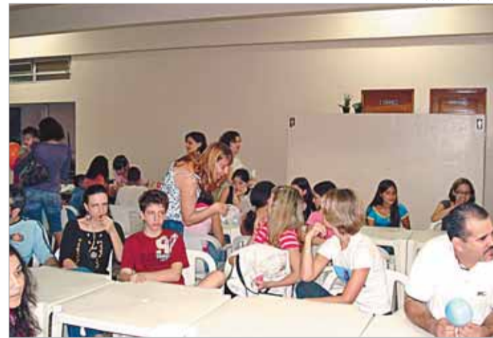
Crianças e pais participaram de várias atividades