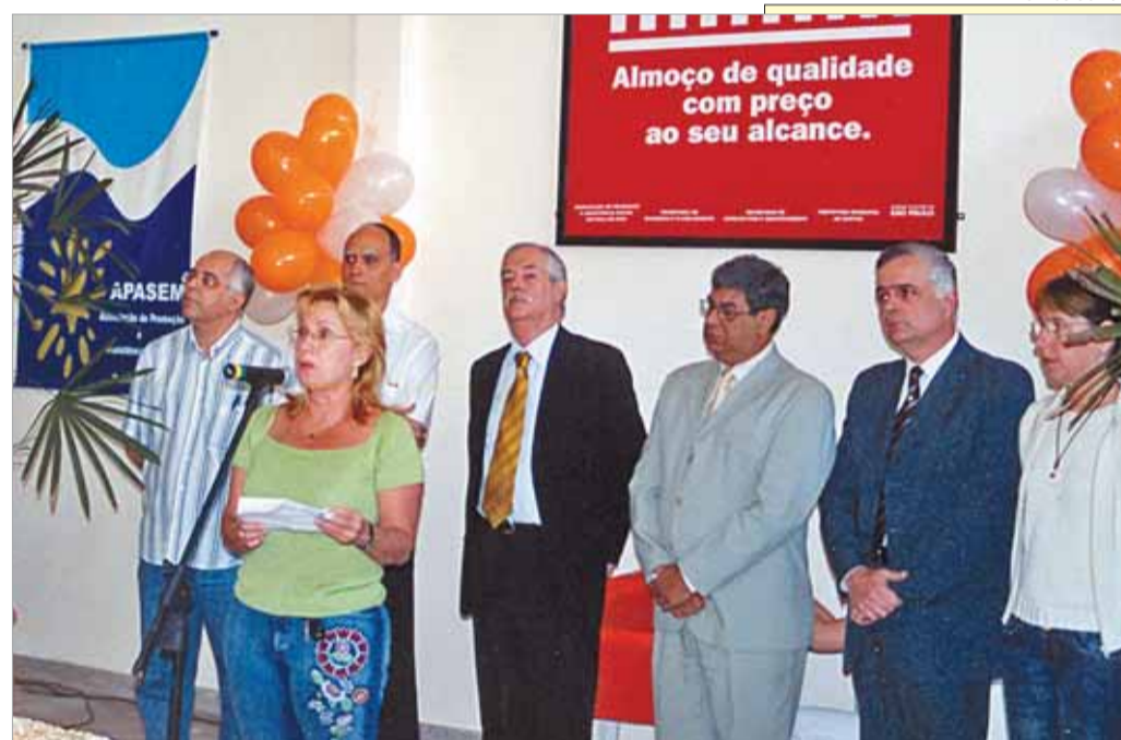
Autoridades municipais, do governo do Estado, e membros da Estrela do Mar, durante ato que marcou 1º aniversário do restaurante popular Bom Prato, em Santos.

desta assembléia é "apresentar o resultado das assembléias paroquiais e regionais feitas durante o ano, para a elaboração do Plano Diocesano de Pastoral. Os trabalhos serão presididos por Dom Jacyr Francisco Braido, bispo diocesano.