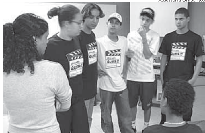
Jovens do Projeto Querô têm acompanhamento psicossocial

A UniSantos (Universidade Católica de Santos) está com inscrições abertas para os pro-