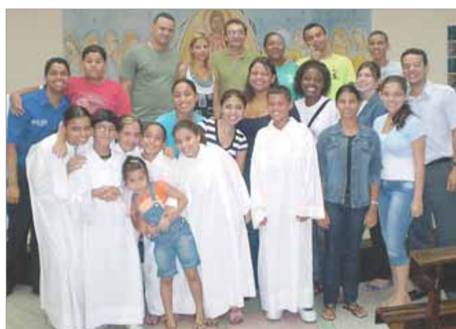
Dedicação de Dom Bosco pela juventude foi lembrada na celebração

Notas: (1)- Carta 55, 14, 24: Nova Biblioteca Agostiniana, (NBA), XXI/11, Roma 1969, pág. 477. (2) - Deus caritas est, 12. (3)- Discurso 8 sobre a paixão do Senhor, 6-8; PL 54, 340-342.