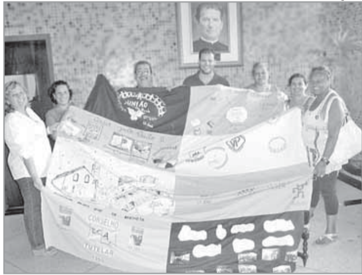
Agentes da Diocese de Santos no encontro em São Paulo