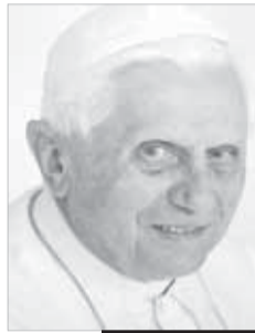
Papa Bento XVI

O tema sobre o qual estais a refletir é de grande atualidade: da segunda metade do século XX até hoje, o movimento de valorização da mulher nos vários setores da vida social suscitou inúmeras reflexões e debates, tendo visto a multiplicação de muitas iniciativas que a Igreja Católica seguiu e muitas vezes acompanhou com interesse atento. A relação homem-mulher na respectiva especificidade, reciprocidade e complementaridade constitui, sem dúvida, um ponto central da “questão antropológica”, tão decisiva na cultura contemporânea. São numerosas as intervenções e os documentos pontifícios que tocaram a realidade emergente da questão feminina. Limito-me a recordar os pronunciamentos do meu amado predecessor João Paulo II que, em Junho de 1995, desejou escrever uma Carta às Mulheres, e até ao dia 15 de Agosto de 1988, exatamente há vinte anos, publicou a Carta Apostólica Mulieris dignitatem . Este texto a respeito da vocação e da dignidade da mulher, de grande riqueza teológica, espiritual e cultural, inspirou por sua vez a Carta aos Bispos da Igreja Católica sobre a colaboração do homem e da mulher na Igreja e