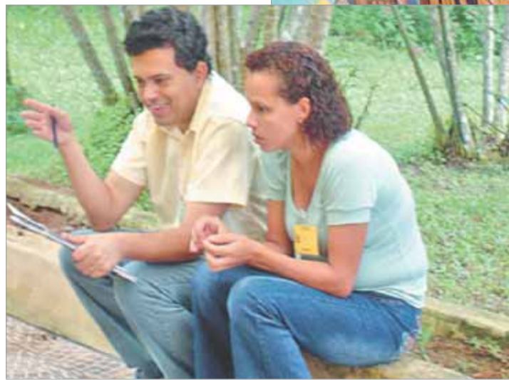
A vivência do Diaconato implica a participação efetiva e o apoio da família

fica muito difícil, ou até impossível, ser um servidor da comunidade", destacou.