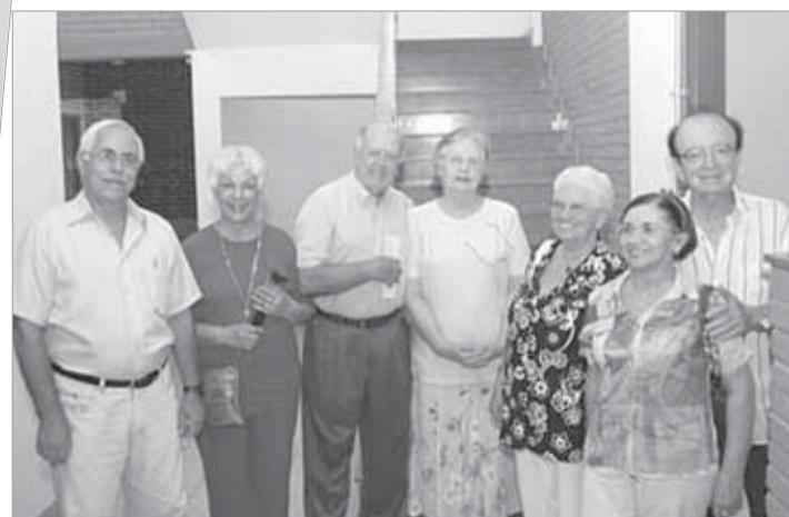
Alguns membros do Serra Clube na missa de abertura