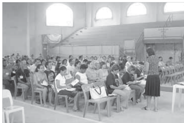
Oficina na S. Margarida capacitou agentes para implantação dos grupos de auto-ajuda

(que é uma droga lícita) está diretamente relacionado com a violência (doméstica ou de rua), aos acidentes fatais no trânsito nos finais de semana, ceifando muitas vidas jovens ou desagregando muitos lares. E onde começa esse ciclo? Normalmente, em casa e com as crianças cada vez mais cedo tendo acesso à bebida. Claro que não podemos ignorar as estruturas organizadas, como o narcotráfico. Mas educar para a prevenção ainda é o remédio mais eficaz”, enfatiza o médico.