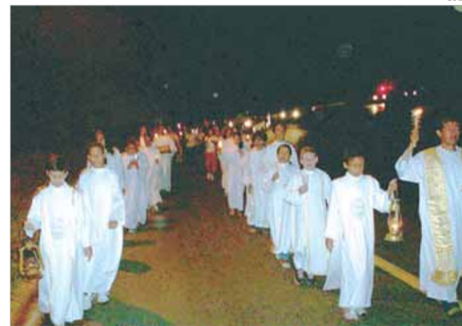
Fiéis percorreram um trajeto de mais de uma hora com a imagem de N. Sra. de Lourdes, padroeira dos enfermos