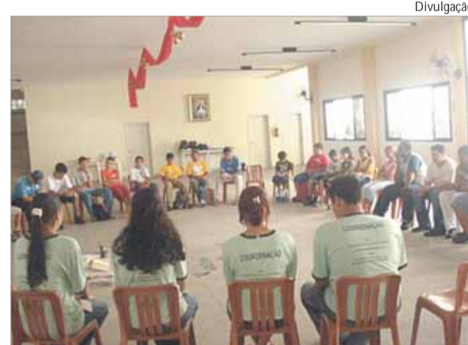
Coroinhas do Centro 1 em preparação para a Gincana

No dia seguinte, Padre Afonso de Souza, presidiu a Santa Missa na Matriz, esclareceu sobre as indulgências concedidas pelo Papa por ocasião dos 150 anos da aparição de Nossa Senhora e logo após a imagem retornou em carreta para a gruta.