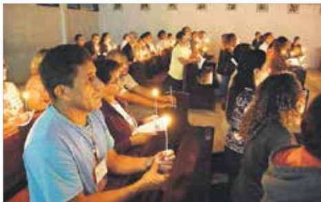
Vigília de Pentecostes: o Espírito Santo abre o coração à compreensão da Palavra de Deus