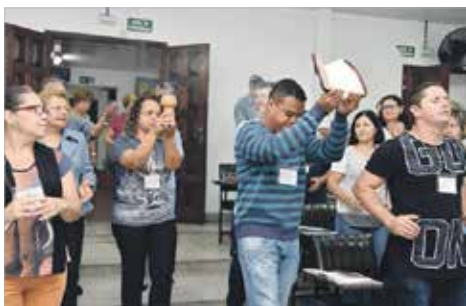
Ouvir a Palavra de Deus antes de qualquer ação

A formação dos agentes da Animação Bíblica também será feita através da EAD (Educação a Distância).