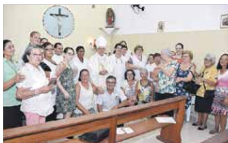
Comunidade S. José e N. S. de Guadalupe