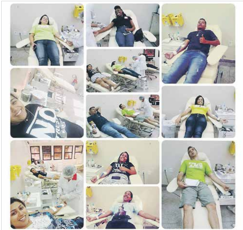
Literalmente, “dando o sangue” pelo bem dos irmãos

e buscam envolver assuntos que levem a juventude a despertar seu protagonismo em sua comunidade e na sociedade, levando consigo os saberes dos ensinamentos da Igreja Católica. Em sua maioria são conduzidos com música de louvor e reflexão voltados ao tema de cada encontro, não deixando de perder a essência da veneração a Virgem de Guadalupe e exercícios espirituais de Santo Inácio de Loyola.