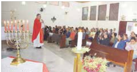
D. Tarcísio presidiu a missa de Pentecostes