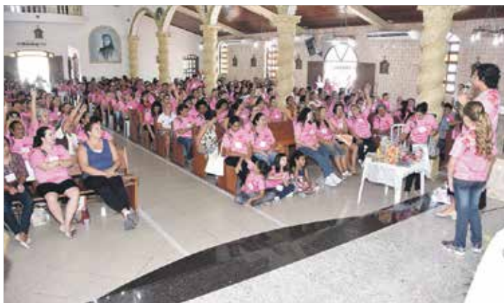
Retiro reuniu mais de 400 "Mulheres de Fé" de várias comunidades