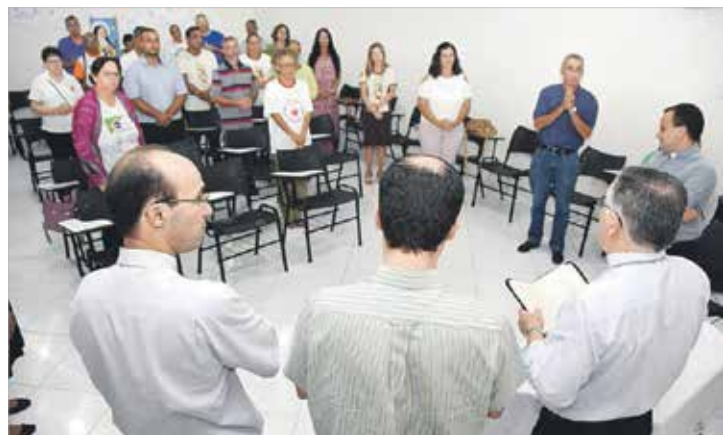
Encontro com as lideranças no Conselho Paroquial de Pastoral