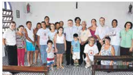
Comunidade S. Pedro/Rio Preto