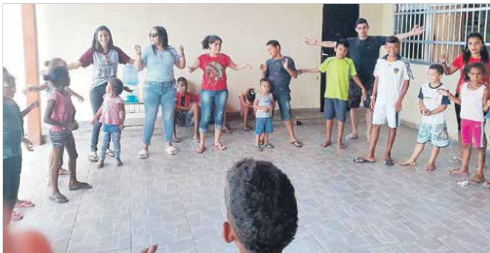
Ação com crianças da Capela Bakhita, em Praia Grande