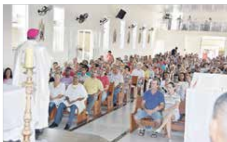
Comunidade São Bento