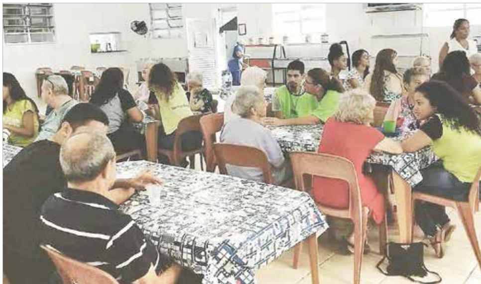
Dia de convivência com os idosos da Sociedade São Vicente de Paulo, em Santoss