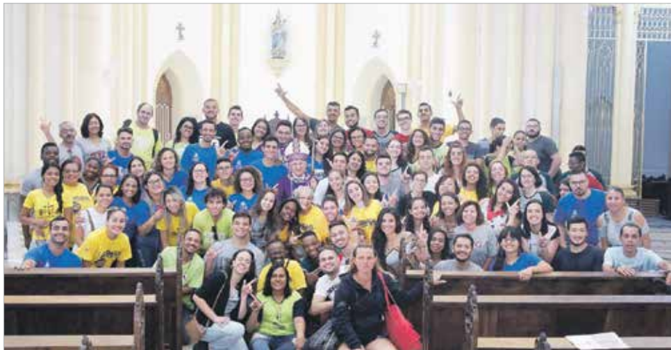
Catedral de Santos - Missa de encerramento da peregrinação do Ícone de Nossa Senhora de Guadalupe e aniversário de 17 anos do TLC na Diocese de Santos