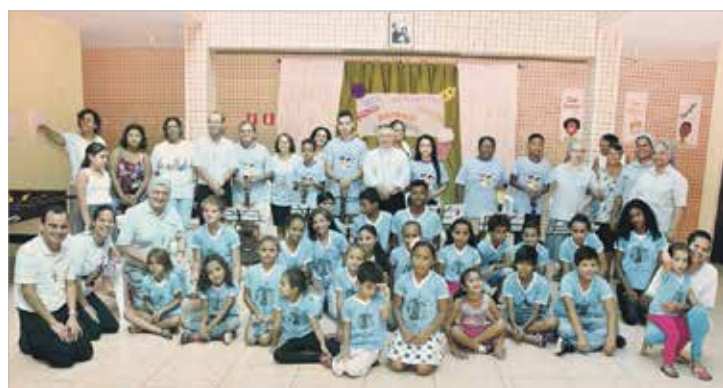
Projeto social da Congregação Filhas de S. Francisco de Sales: educação