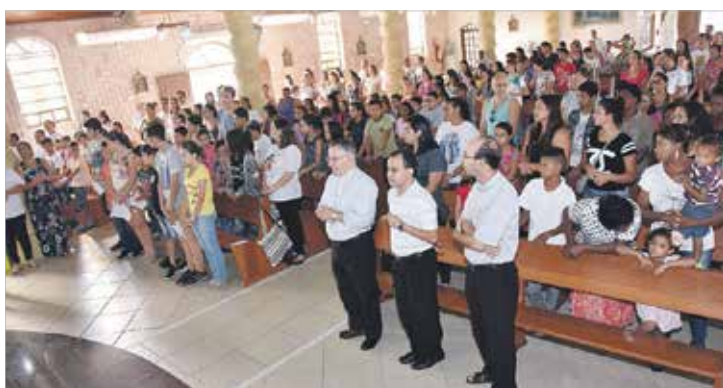
Encontro com as crianças da Catequese e familiares