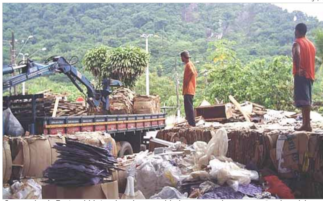
Campanha da Fraternidade tem levado comunidades a se engajarem em ações de reciclagem