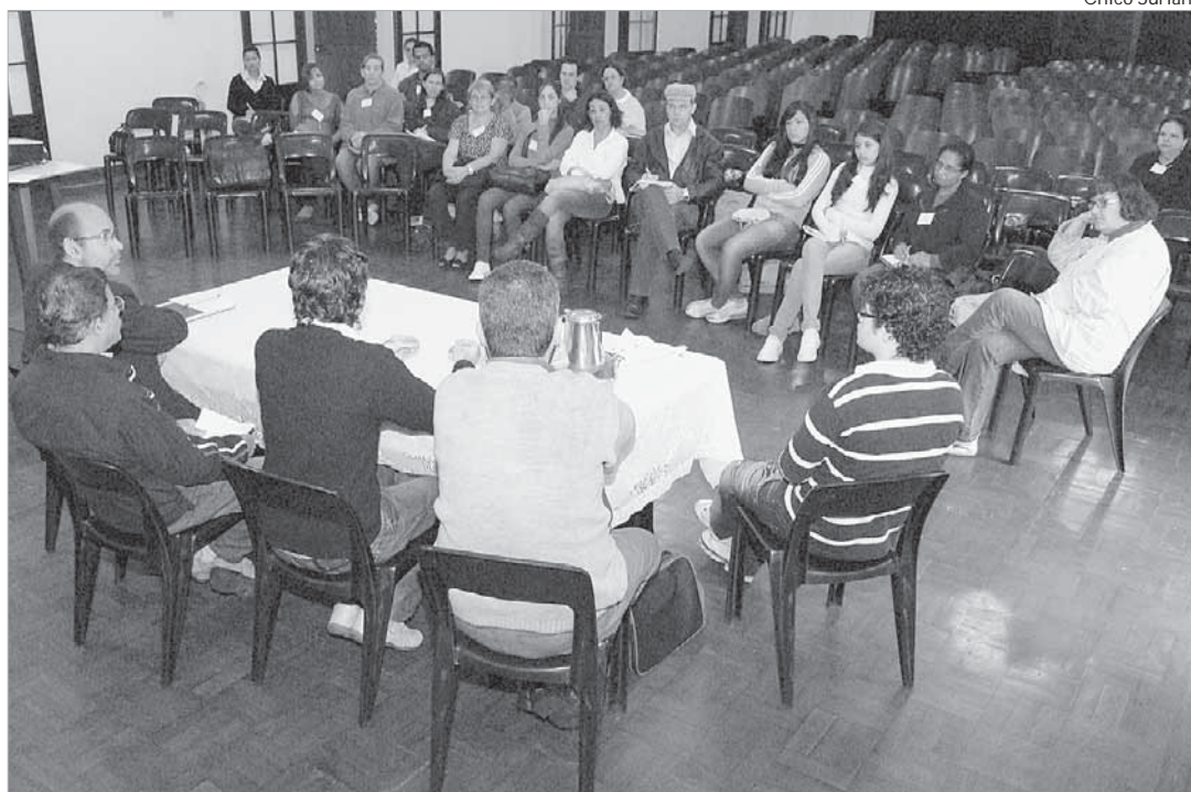
Agentes da Pastoral da Cultura devem articular projetos com prioridades pastorais diocesanas