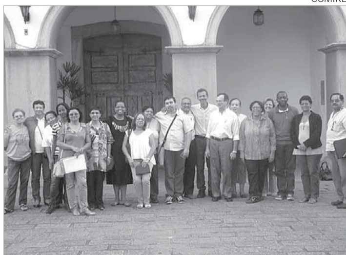
COMIRE em reunião no Santuário do Valongo, em Santos

denador do COMIRE SUL1, ressaltou alguns pontos que devem nortear a realização do encontro estadual: "Não é um encontro somente formativo, mas também um ponto de comunhão entre irmãos. É também um momento de articulação, de animação missionária e de