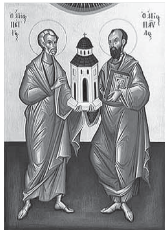
SÃO PEDRO E S. PAULO

Santo Antonio - PG - De 31/5 a 13/6 4/6 - 17h – Missa com amiguinhos da Sagrada Família, Coroinhas e MEJ. 5 - 19h – Missa com a juventude. 6 - 19h30 – Missa com os Ministros Extraordinários da Sagrada Comunhão. 7 - 19h30 – Missa com a Terceira Idade. 8 - 19h30 – Missa com o Terço dos Homens. 9 - 19h30 – Missa de Louvor. 10 - 19h30 – Missa do 4º aniversário de dedicação da Matriz. 11 – 17h – Missa com as Legionárias e Mãe Rainha. 12 – 19h – Missa com as famílias. 13 – Festa do Padroeiro – Missas às 8h, 10h e 17h.