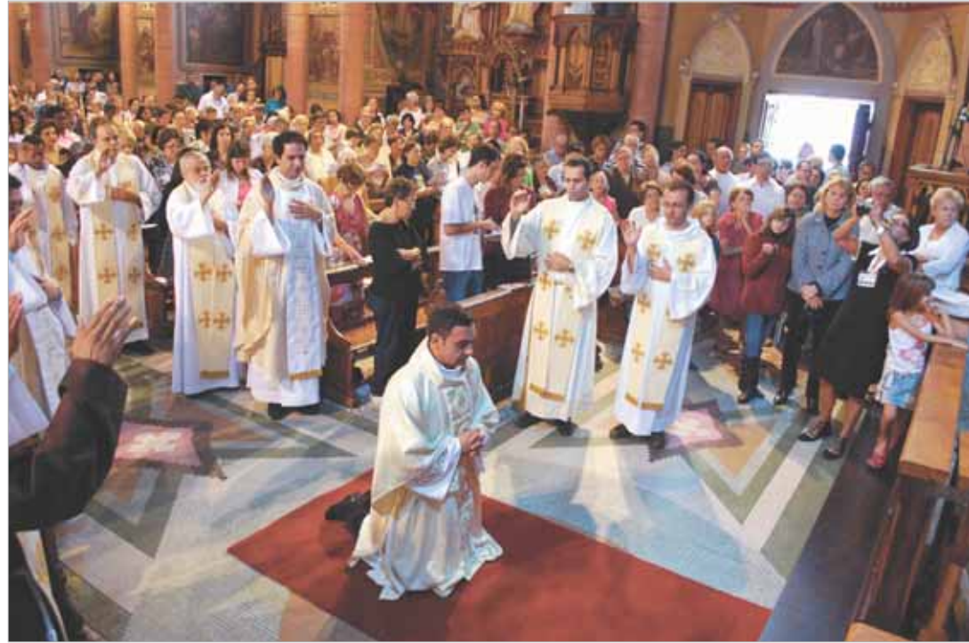
Na Prece de Ordenação, o Bispo refaz o itinerário bíblico de todos aqueles que no Antigo e no Novo Testamento desempenharam a função sacerdotal, para guiar e santificar o povo