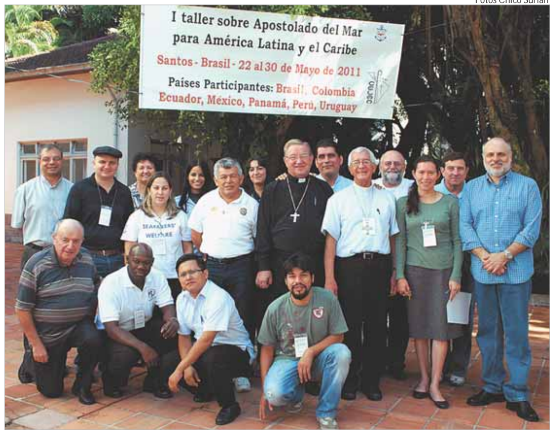
Agentes do Apostolado do Mar: a formação permanente é um dos maiores desafios