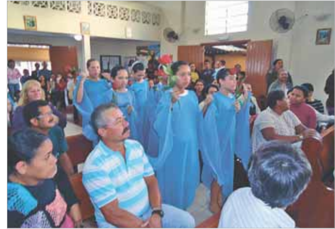
Crianças da Paróquia S. Judas Tadeu, em Cubatão, participam da tradicional cerimônia de coroação de Nossa Senhora, no encerramento do mês de maio.

No dia 27, na Capela S. Pedro e S. Paulo, e no dia 29, na Capela Nossa Senhora Aparecida.