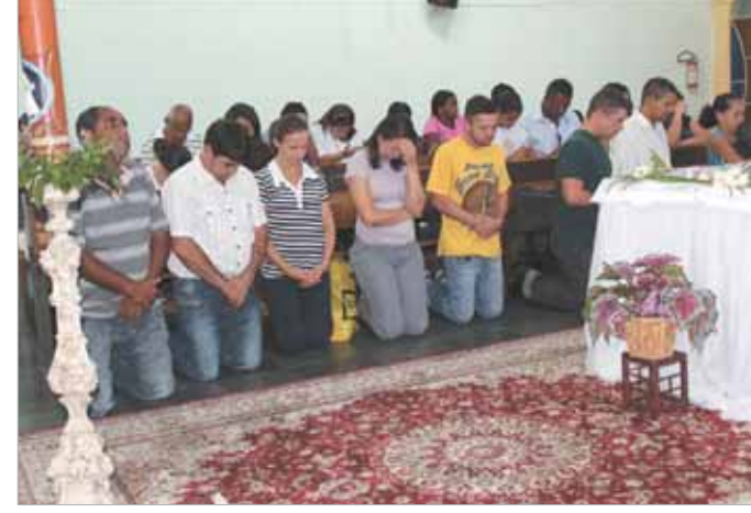
Comunidades do Caminho Neocatecumenal enviadas em missão