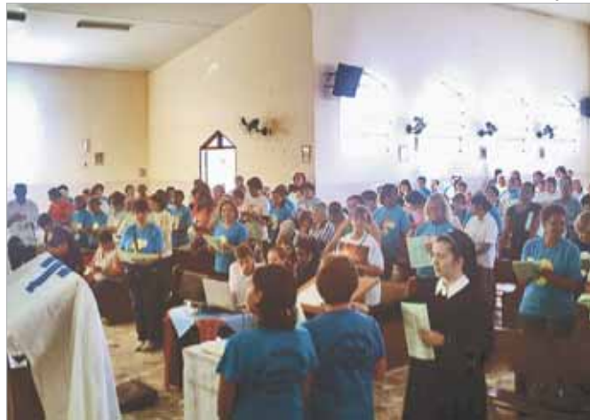
Encontro é impulso para novo agir missionário

O 6º Encontro Diocesano do Movimento da Mãe Rainha e Vencedora Três Vezes Admirável de Schoenstatt para coordenadores e missionários do Movimento. O Encontro foi realizado no dia 22 de maio na Capela N. Sra. de Fátima (Par. Santo Antonio/PG).