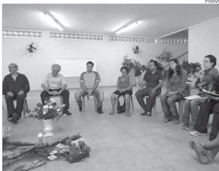
Vencer a barreira do preconceito é um dos desafios da PMM

Uma das mulheres, ao sair, disse que tinha gostado tanto que até "dá vontade de ficar aqui". Outra, por sua vez, expressou o que sentia, dizendo exultante: "Até saio com uma medalha!", enquanto apontava para a correntinha em seu pescoço com a relíquia do Fundador dos Oblatos, que recebera de um deles presente ao