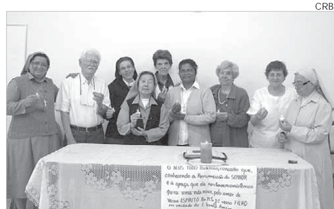
Encontros dos religiosos promovem a unidade

Religiosos de várias Congregações se reuniram no Pensionato Maria Imaculada, no dia 14 de maio.