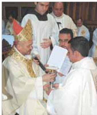
... e o cálice com vinho que será consagrado a serviço do povo