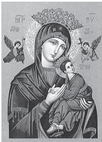
N. SRA. DO PERPÉTUO SOCORRO

Dia 3/7 - Encerramento dos festejos. S. Pedro e S. Paulo - Cubatão De 30/6 a 3/7. 30/6 - 18h - Terço. 19h - Tríduo. 20h – Celebração. 1/7 - Solenidade do Sagrado Coração de Jesus. 18h - Terço. 19h - Tríduo. 20h - Celebração. 2/7 - 18h – Terço. 19h – Tríduo. 20h – Missa. 3/7 – Festa de S. Pedro e S. Paulo - 12h – 14h – Procissão pelas Ruas do Bairro. 15h - Santa Missa. Celebrante: Pe. Enriroque Ballerini Capela S. Pedro e S. Paulo – R. Padre Antônio, 260 - Vila dos Pescadores – Cubatão (Paróquia S. Judas Tadeu). Rainha Santa Isabel (Par. S. João Batista) - Peruíbe Dia 30/6 - 19h – 1º dia do Tríduo - Matriz S. João. 1/7 - 19h - Missa e recepção de fitas do Apostolado da Oração - Matriz S. João. 2/7 - 18h30 - Missa do 3º dia do Tríduo - Matriz. 3/7 - Festa da Rainha S. Isabel - 10h - Missa na Escola José Veneza Monteiro. N. Sra. do Perpétuo Socorro - São Vicente Novena - de 17 a 26 de