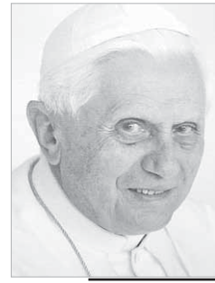
Papa Bento XVI

Também na era digital, cada um vê-se confrontado com a necessidade de ser pessoa autêntica e reflexiva. Aliás, as dinâmicas próprias das redes sociais mostram que uma pessoa acaba sempre envolvida naquilo que comunica. Quando as pessoas trocam informações, estão já a partilhar-se a si mesmas, a sua visão do mundo, as suas esperanças, os seus ideais. Segue-se daqui que existe um estilo cristão de presença também no mundo digital: traduz-se numa forma de comunicação honesta e aberta, responsável e respei-