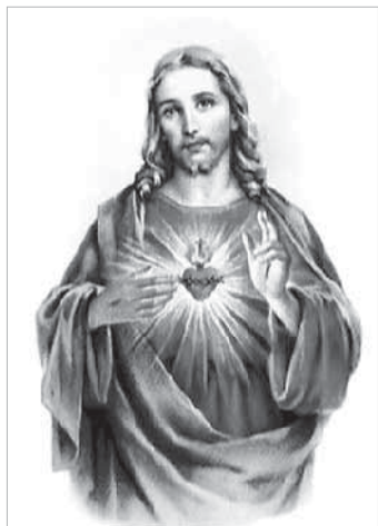
SAGRADO COIRAÇÃO DE JESUS