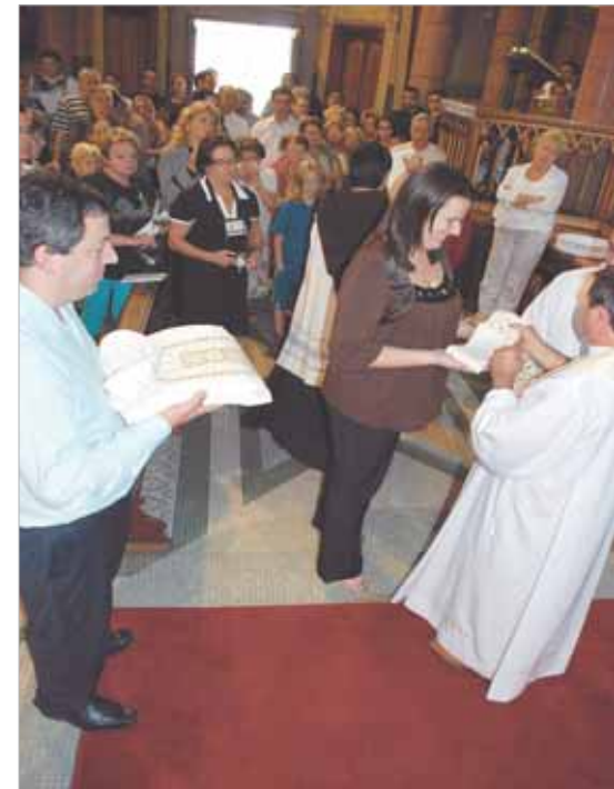
O neo presbítero recebe suas vestes sacerdotais...