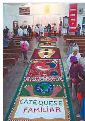
S. João Evangelista/SV