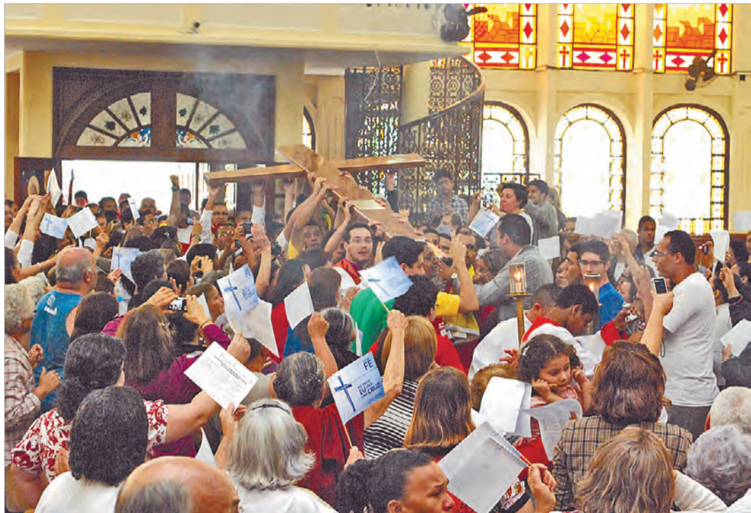
Recepção da Cruz da JMJ e do Ícone de Nossa Senhora na Diocese de Santos, em setembro de 2011, na Igreja S. Francisco de Assis, em Cubatão

Falta um ano para a Jornada Mundial da Juventude (JMJ) que acontecerá no Rio de Janeiro e a Diocese de Santos já está se articulando para participar desta grande festa. A estimativa da Comissão Diocesana da Juventude é que cerca de 500 jovens da Baixada inscritos participem da Jornada. Na primeira semana de inscrição 60 já confirmaram presença. Além disso - para nossa alegria! - cinco jovens da Diocese já foram confirmados pela Organização Oficial como voluntários e vão atuar durante os acontecimentos da JMJ, entre os dias 23 e 28 de julho de 2013.