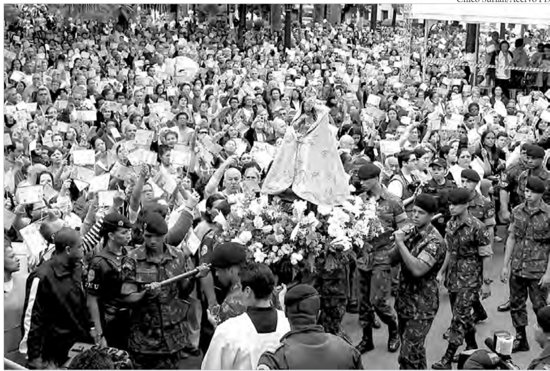
Igreja é chamada a responder aos novos desafios das sociedades pluralistas

De acordo com o sociólogo, os dados apontam para o aumento do número de paróquias e para a criação de novas dioceses, mostrando uma Igreja em constante crescimento: "Os teóricos da secularização dizem que a religião está fadada ao fracasso, mas o que vemos é o contrário, pois, à medida que surge a necessidade da criação de mais paróquias e estas de serem setorizadas, ampliando, assim, o seu alcance, supõe-se que os resultados são de uma maior adesão religiosa, inclusive de pessoas afastadas", especifica o texto.