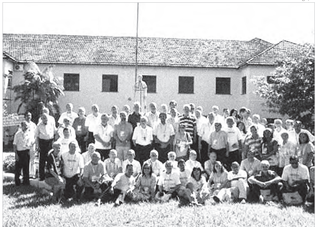
Bispos da Amazônia apelam para que a Igreja no Brasil conheça melhor essa realidade

Igreja na Amazônia precisa de muita gente. Homens e mulheres, que realmente estejam dispostos a dar à vida pelos irmãos. E para isso é preciso muitas vezes de um despojamento. Nós sabemos que é preciso uma liberdade evangélica de vir e servir”.