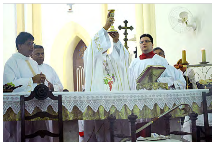
Catedral de Santos

Festa do Corpo de Cristo celebrada no dia 7 de junho em todo o mundo coloca os cristãos diante do mistério maior da fé cristã: o Senhor Jesus que se doa para se fazer presente no seio da humanidade até os fins dos tempos.