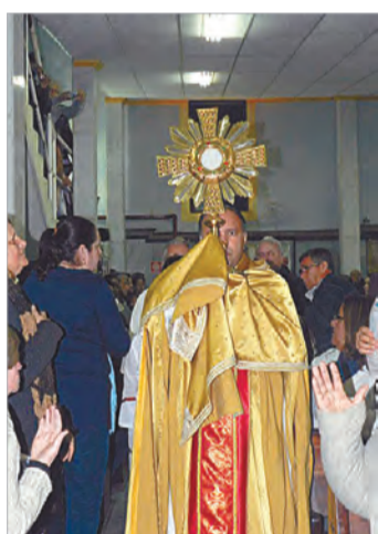
N. Sra. das Graças/PG