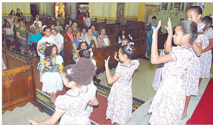
Crianças da Casa João Paulo II (Catedral) prestam homenagem à Diocese, com música que fala sobre a importância da história

"Queremos celebrar este ANO DA FÉ de forma digna e fecunda. Ele deverá intensificar a reflexão sobre a fé, para ajudar todos os crentes em Cristo a tornarem-se mais conscientes e revigorarem sua adesão ao Evangelho,