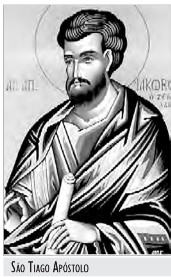
SÃO TIAGO APÓSTOLO

11, 12, e 13/07 - 18h30 - Tríduo preparatório com Missas Festivas. 14/7 - 7h30, 15h, 16, 18h30 - Missas Festivas. 15/7 - 16h - Missa Festiva. 18h30 - Procissão com Imagem de São Camilo e Missa. 19/7 - 17h - Acolhida da Relíquia do Coração de S. Camilo de Lellis e reza do terço. 18h30 - Missa e bênção com o coração de São Camilo e outras cerimônias. 20/7 - 7h30 - Missa festiva com bênção dos pães e com a relíquia do coração. 10h - Missa festiva, bênção