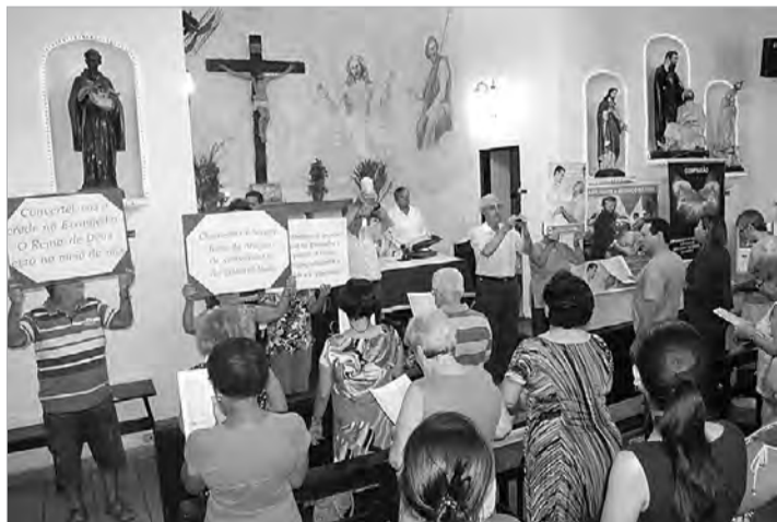
Igreja Santa Cruz é a sede da Pastoral da Saúde

chegaram ao Brasil em 15 de setembro de 1922, no Rio de Janeiro, uns destinados ao Sanatório de São José dos Campos, outro, à Santa Casa de Santos.