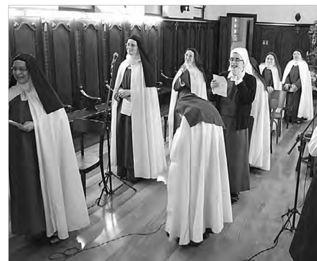
Monjas Carmelitas dedicam sua vida a Deus no silêncio, na oração e na contemplação

Terá início no dia 7 de julho a novena em louvor a Nossa Senhora do Carmo no Carmelo São José e da Virgem Mãe de Deus, em Santos (Confira a programação ao lado). E, juntamente com o início da novena, as Irmãs Carmelitas estão fazendo um convite especial para que a comunidade se aproxime mais do carisma e de sua espiritualidade, participando da realização de um sonho que vem sendo gerado no coração das Irmãs há algum tempo. Isso será feito através da peregrinação da Imagem de Nossa Senhora do Carmo entre as famílias com a proposta de rezar o Terço em família e pelas famílias, pedindo a santificação dos lares e santas vocações.