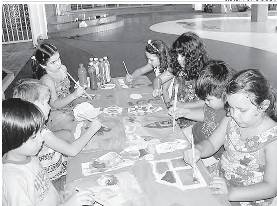
Assessoria de Comunicação

O clubinho de férias mais divertido da cidade acontece de 2 a 31 de julho