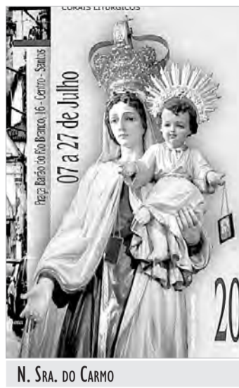
N. SRA. DO CARMO

Festa em Louvor a N. Senhora do Carmo - Paróquia N. Senhora do Carmo - Santos 14/7 - 16h30 - Missa com entrega dos escapulários 15/7 - 9h e 18h30 - Missa com entrega dos escapulários 16/7 - 19h - Missa Solene com entrega dos escapulários R. Egidio Martins, 182, Ponta da Praia. 3261-2793