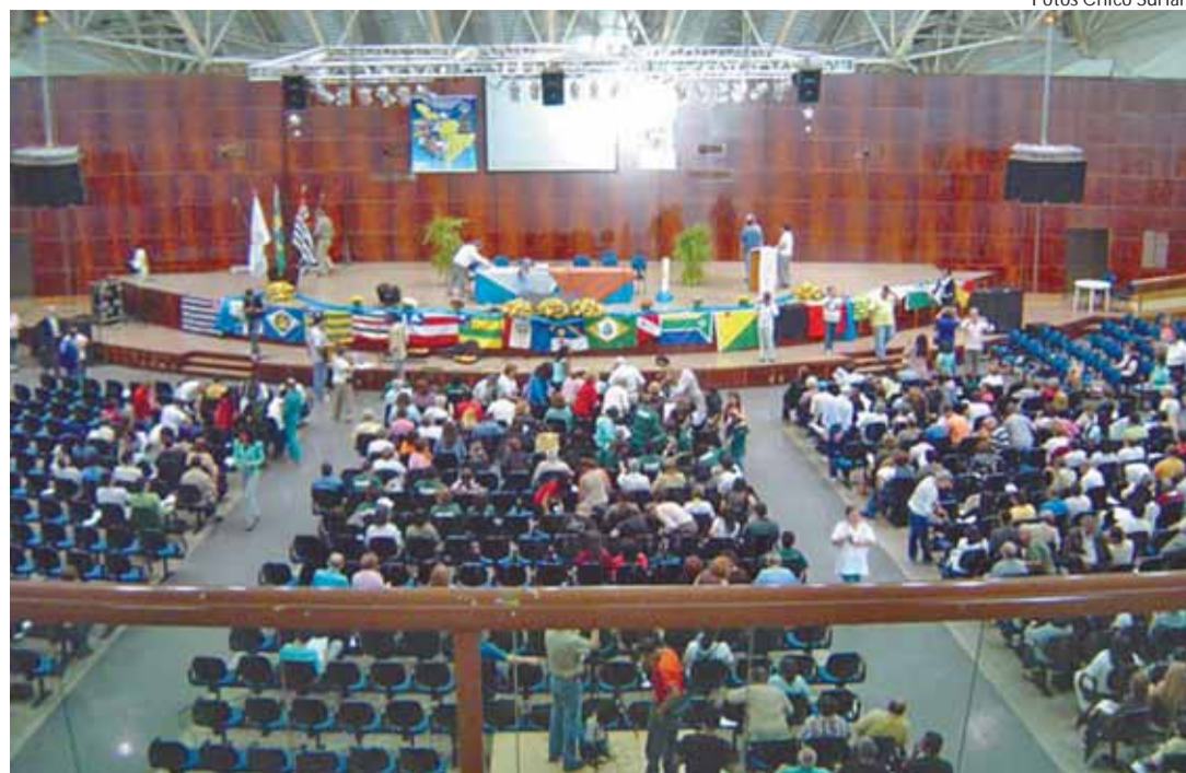
Diversidade das realidades regionais é a grande riqueza do laicato do Brasil

De 7 a 10 de junho foi realizado o V Encontro do Laicato do Brasil, promovido pelo Conselho Nacional do Laicato do Brasil (CNLB). O tema do encontro foi: "Ser Cristão Hoje: Desafio e Esperança". Mais de 600 leigos, vindos de todas as regiões do país reuniram-se na "Estância Árvore da Vida", em Sumaré, SP, próximo de Campinas.