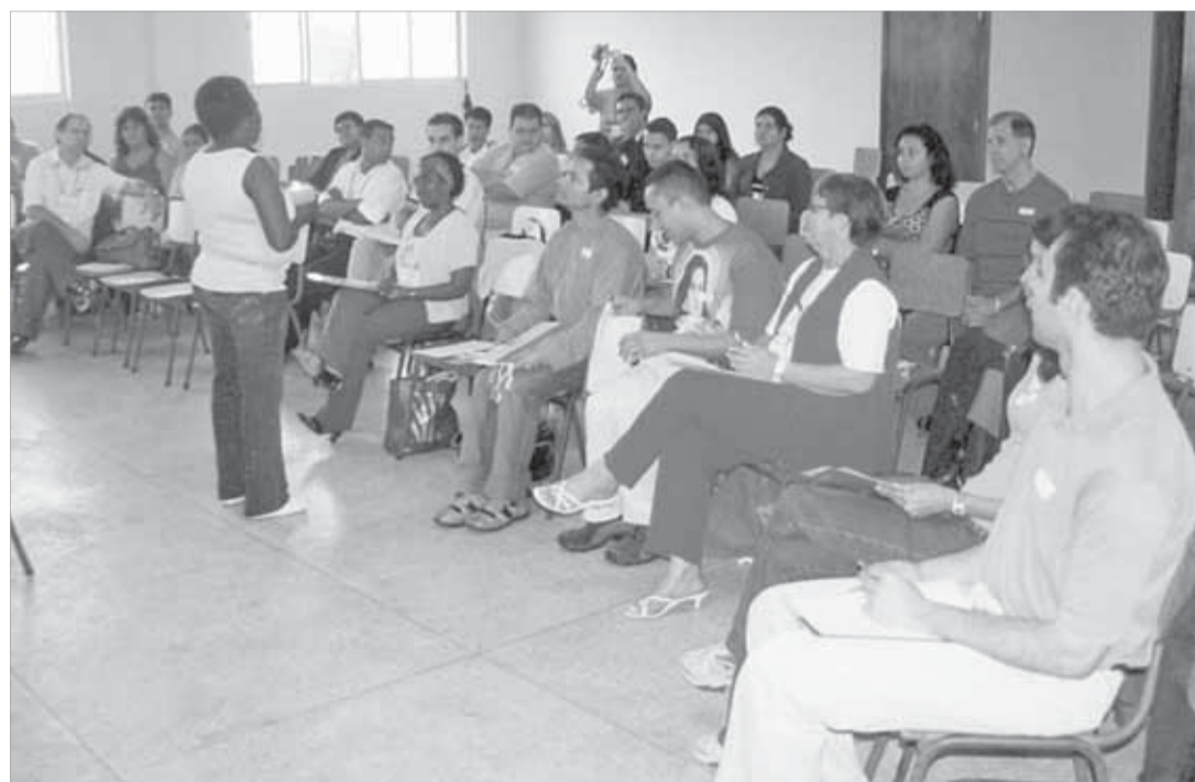
Momento de espiritualidade na Pascom: Jesus é o conteúdo do anúncio que deve motivar o agente