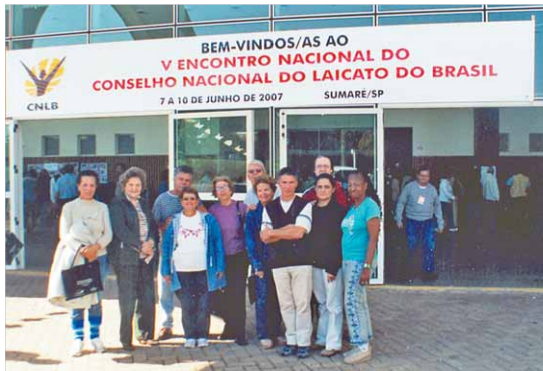
Da Diocese de Santos participaram 10 representantes, membros do Codilei

Ao final do encontro foi aprovada a Mensagem Final (íntegra ao lado) e o documento AGIR para os próximos anos.