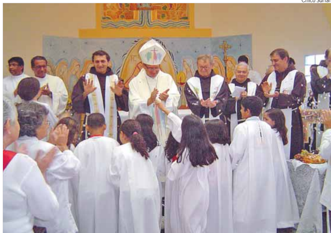
Crianças recebem o novo pároco com chuva de papel picado simbolizando bênçãos