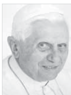
Papa Bento XVI

É um grande evento eclesial que se situa no âmbito do esforço missionário que a América Latina deverá propor-se, precisamente a partir daqui, do solo