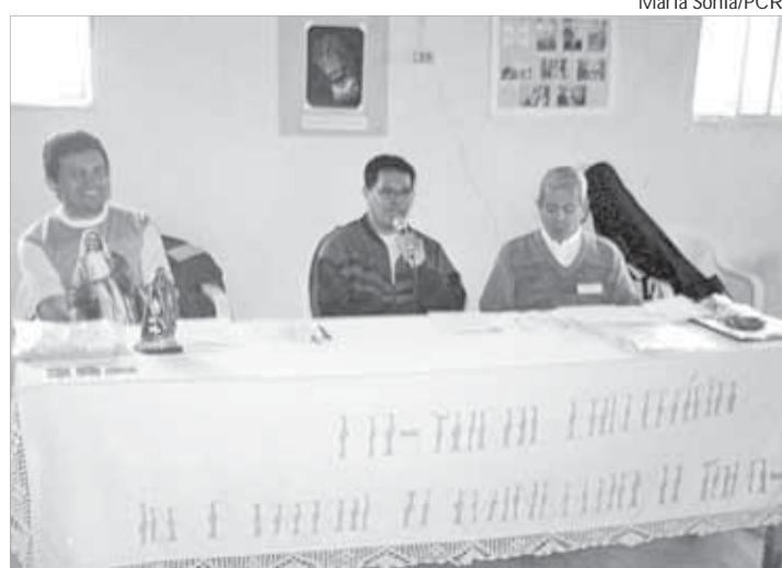
Formação contínua dos agentes é meta da Pastoral

Durante o encontro foram apresentados relatos de experiências, dificuldades e avanços que a Pastoral teve ao longo do semestre. "Duas