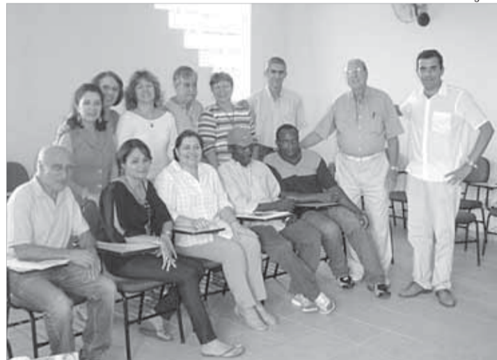
Membros da Cáritas com grupo de refugiados, em Santos