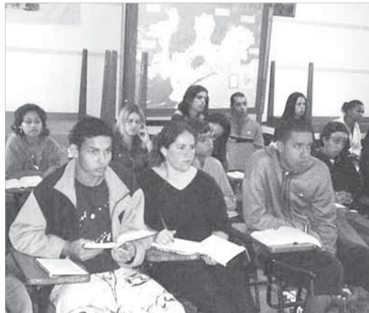
Catequese integral da juventude para nortejar a prática cristã

O Papa Bento XVI - seguindo os passos de João Paulo II - chama a América Latina “Continente da Esperança” e convoca “os jovens” para serem os “construtores de uma nova história” realizando a missão de Jesus Cristo. “Vós sois o presente Jovem da Igreja e da humanidade. Sois seu rosto jovem. A Igreja precisa de vós, como jovens, para ma-