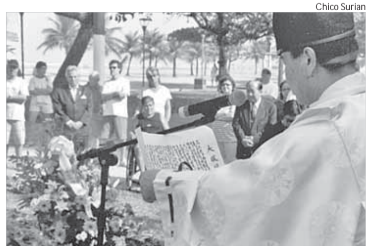
Sacerdote recita oração durante celebração xintoísta, em Santos