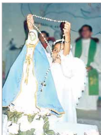
Crianças preservam as tradições marianas com a celebração da Coroação de N. Senhora

No dia 26 de maio, cerca de 16 crianças e adolescentes, de 7 a 14 anos, participaram do encontro de formação para líderes da Infância Missionária, na Capela Santíssima Trindade. O encontro foi coordenado pelo Asses-