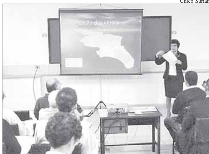
Cidade deve se preparar para atender demanda dos idosos

número de idosos em Santos deve-se sobretudo a fatores ambientais (bom clima, cidade plana, próxima da Capital) e sociais (diversidade de programas sociais, culturais, esportivos voltados para a terceira idade), proporcionados pelo poder público e por diversas instituições particulares.