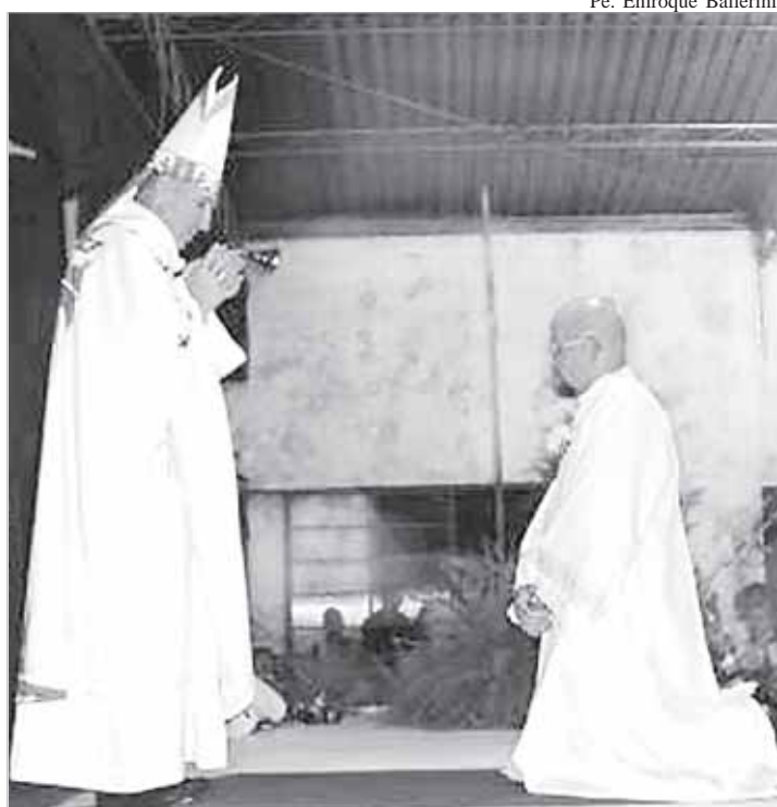
“Senhor, tu sabes tudo, tu sabes que te amo” foi o lema escolhido pelo neo-sacerdote como inspiração para seu ministério sacerdotal

com a catequese e o trabalho Pastoral com as comunidades religiosas no Vale do Ribeira.