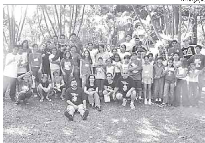
Os visitantes poderão conhecer mais de perto...