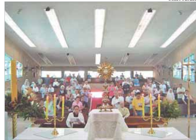
Clero e comunidade refletem e rezam sobre ministério sacerdotal