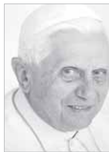
Papa Bento XVI

É-me grato renovar a convocação deste importante Encontro Mundial das Famílias. A este respeito, proponho alentar, como fez João Paulo II, a «estupenda novidade» (FC 51), o «Evangelho da Família», cujo valor é central para a Igreja e a