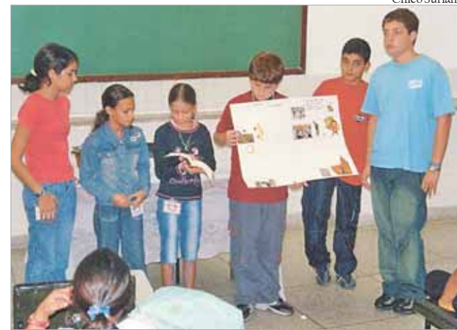
Crianças partilharam as lições da Palavra de Deus