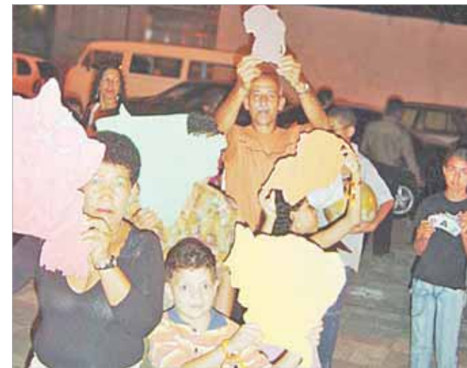
'Pedacos' do Brasil são apresentados na procissão de entrada

Nos primeiros anos, a Paróquia funcionou na capela de Santa Cruz, que hoje é a Paróquia Pessoal da Pastoral da Saúde da Diocese de Santos. O terreno para a nova Igreja na bonita Avenida Ana Costa foi comprado em 1916. Durante muitos anos, zelosos Missionários Claretianos trabalharam arduamente para erguer o belíssimo templo dedicado ao Imaculado Coração de Maria. Depois de tanto sacrifício e trabalho, o templo foi inaugurado no dia 7 de dezembro de 1927, mas a conclusão das obras só aconteceu no ano de 1942.