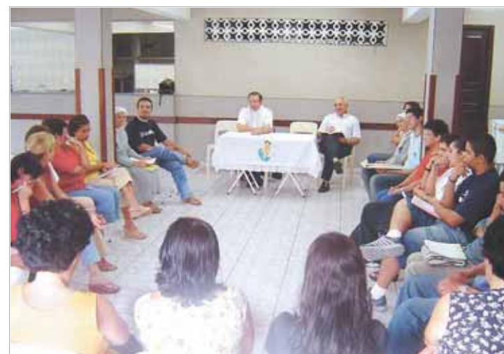
Encontro com lideranças da paróquia N. Sra. da Assunção