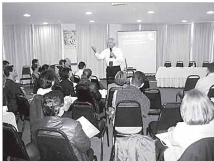
Marketing ainda precisa ser melhor discutido na Igreja