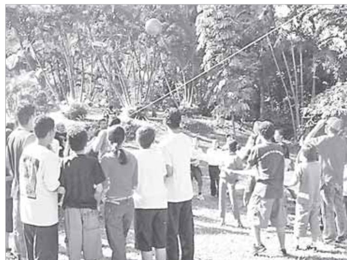
...o dia-a-dia dos futuros padres, além de desfrutarem de um ambiente propício ao lazer e à integração