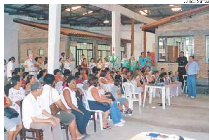
No novo Núcleo, a Pastoral fará também oficinas de alimentação enriquecida e remédios caseiros

No Valongo, a Pastoral da Criança conta com um grupo de 13 líderes e 20 pessoas no grupo de apoio. A passagem acontece todo 4º sábado do mês.