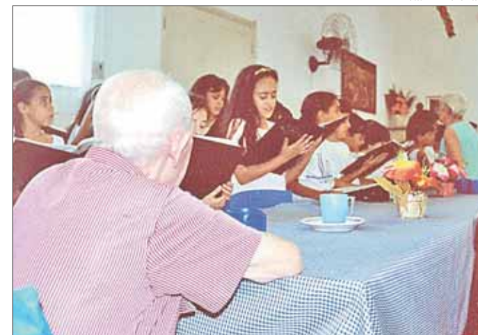
Crianças tiveram uma tarde de convivência com os idosos