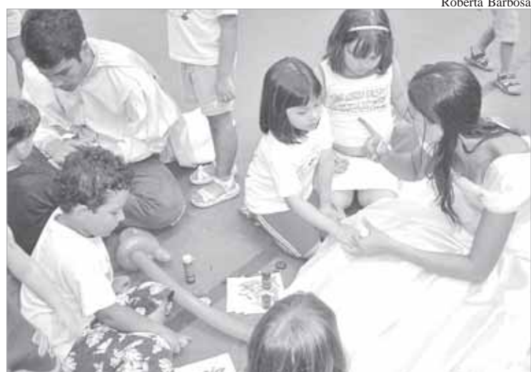
As crianças vão encontrar um ambiente propício para muita diversão e alegria

oferecer para as crianças momentos de descontração e recheados de atividades lúdicas. Toda a programação para o período foi pensada levando em consideração a faixa etária das crianças e o interesse pelas atividades propostas.