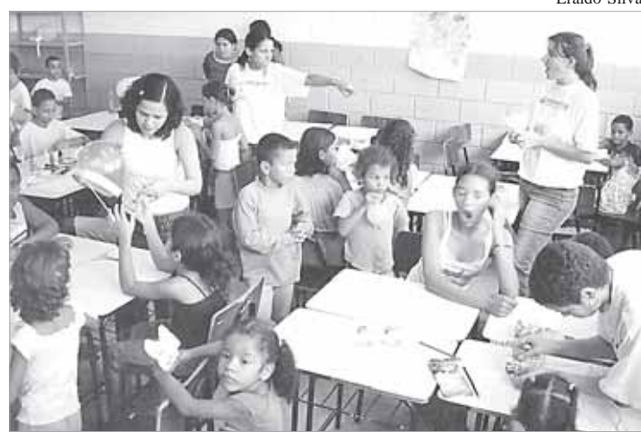
194 voluntários, foram realizados 1986 atendimentos no Dia da Cidadania

UniSantos abre inscrições para cursos seqüenciais. A Universidade Católica de Santos (UniSantos) abre inscrições, entre os dias 1 e 15 de julho, para o Vestibular 2005 - cursos seqüenciais (2 anos). Estão sendo oferecidas vagas para as seguintes áreas: Gastronomia (Tarde - 30 vagas), Design de Interiores (Tarde - 50 vagas e Noite - 50 vagas), Gestão de Terminais Portuários (Noite - 50 vagas), Tecnologia e Gestão em Computadores (Noite - 40 vagas), Gestão Ambiental em Ci-