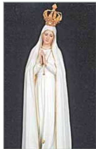
Imagem Peregrina de N. Sra. de Fátima vem a Santos

O evento faz parte das comemorações dos 90 anos de criação da Paróquia Imaculado Coração de Maria.