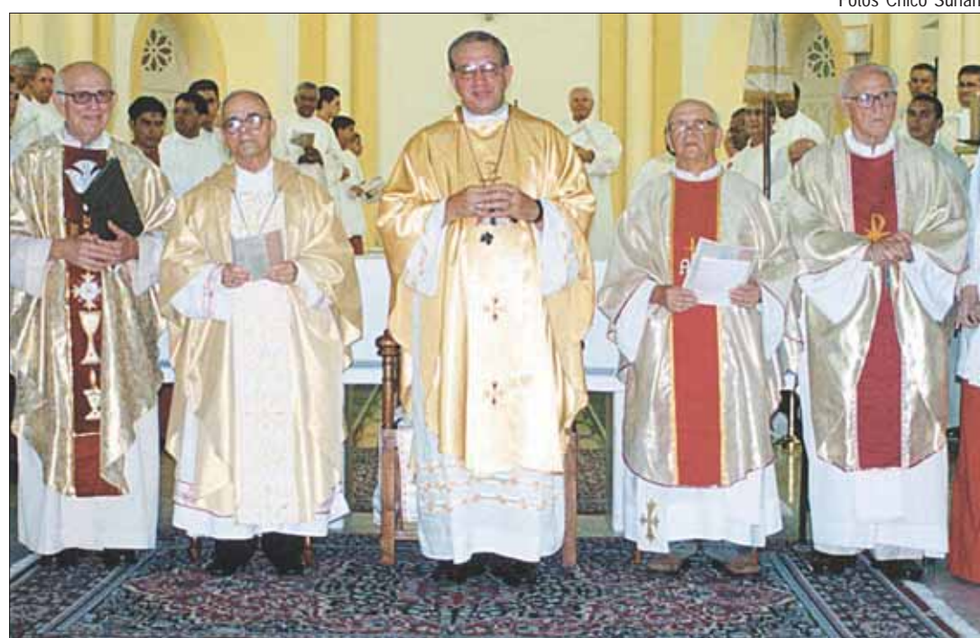
Celebração do jubileu de ouro encerrou as atividades do Ano Vocacional na Diocese

Falando aos sacerdotes mais novos, D. Jacyr lembrou os novos desafios dos tempos atuais, "talvez diferentes daqueles que nossos irmãos jubilando enfrentaram e superaram, porque encontraram na palavra, na oração, na Eucaristia, no encontro com o povo o sentido da missão. E hoje, mais do que nunca, a Igreja no Brasil nos apela para ampliarmos nosso ser missionário, para anunciarmos - sem temor - a Palavra de Deus, através do anúncio, da liturgia, do serviço, da educação na fé, na comunhão. Que o exemplo desses nossos irmãos que hoje celebram 50 anos de vida dedicada ao sacerdócio, nos impulse a todos nesse novo ardor missionário, sem esquecermos da promoção vocacional".