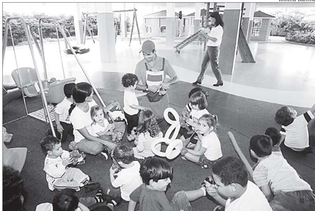
Uma programação variada e divertida vai animar as férias da garotada no Liceu Santista

Com o intuito de proporcionar às crianças da Educação Infantil momentos de alegria, descontração e lazer, o Liceu Santista elaborou uma programação especial para o período de férias, em janeiro. A cada dia, os alunos participam de diferentes atividades recreativas e culturais. No roteiro estão idas ao cinema e ao teatro e visita aos pontos turísticos da cidade, como Orquidário, Aquário, Museu de Pesca, Pinacoteca entre outros.