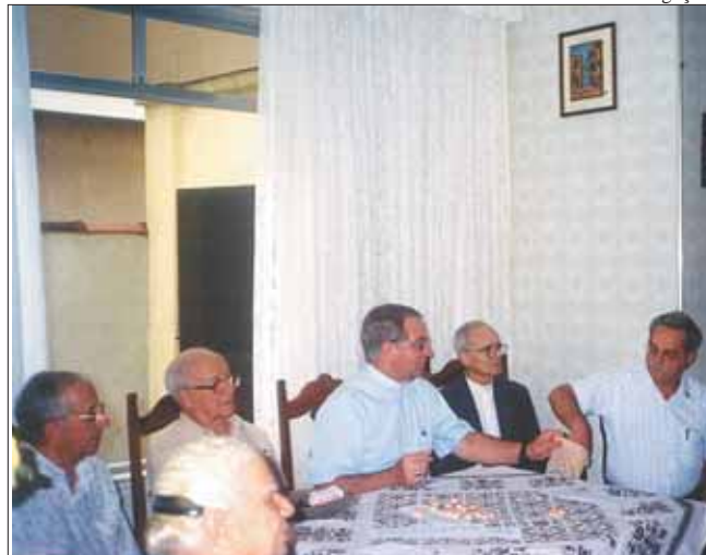
Doações são revertidas para manutenção do Seminário