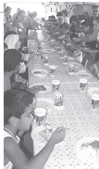
A tradicional festa das crianças da paróquia S. Judas Tadeu, em Santos, há mais de 24 anos, mobilizando centenas de voluntários numa grande maratona de diversão, lazer e solidariedade com as crianças do bairro.

ral (CDPa), reuniu-se para dar início à elaboração do Plano Diocesano de Pastoral. O Plano de Trabalho deve envolver todos os segmentos pastorais, movimentos, associações, entidades de serviços e paróquias da Diocese. O Plano de Trabalho terá como base as determinações do Sinodo Diocesano de Pastoral (encerrado em 2000) e as Novas Diretrizes da Ação Evangelizadora da Igreja no Brasil, da CNBB, para os