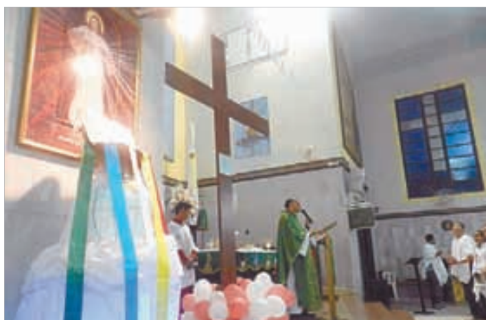
N. Sra. das Graças/PG - 6 a 13/10/2012