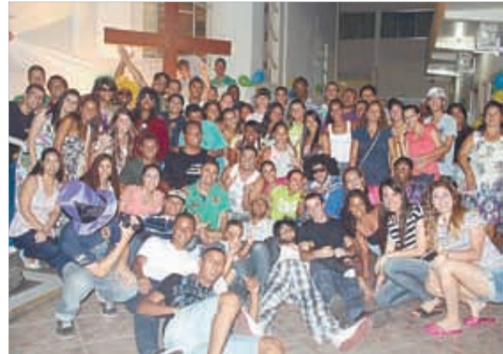
N. Senhora da Lapa/CB - 5 a 9/1/2013