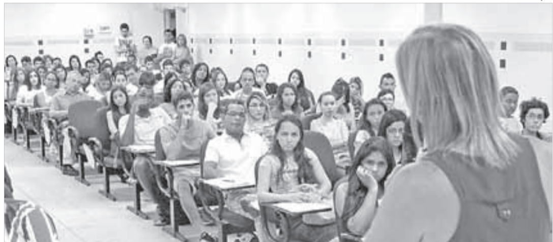
Alunos participam de aulas e recebem orientações