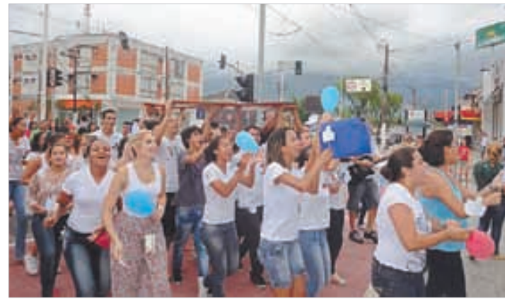
N. Senhora da Lapa/CB - 5 a 9/1/2013