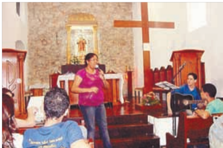
S. Vicente Mártir - 3 a 10/11/2012