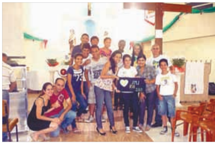
N. Sra. Auxiliadora - 8 a 15/12/2012