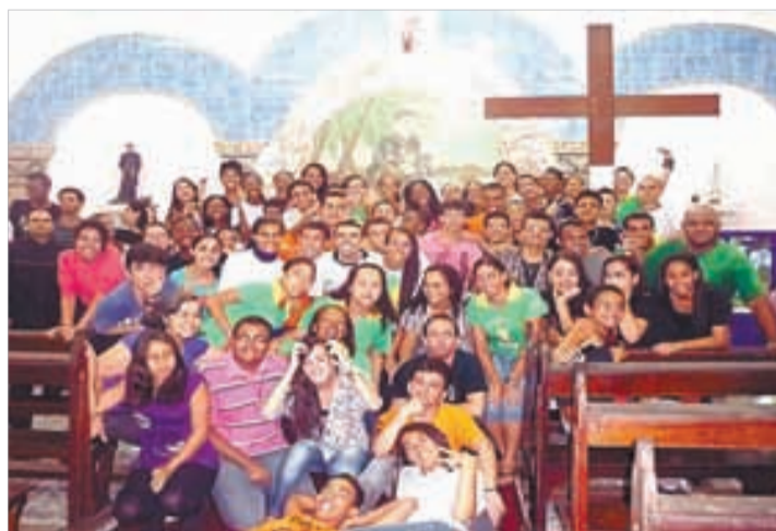
Beato Anchieta - 15 a 22/12/2012