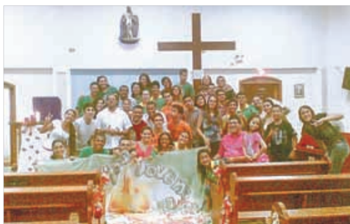
S. Judas Tadeu/Cb - 22 a 29/12/2012