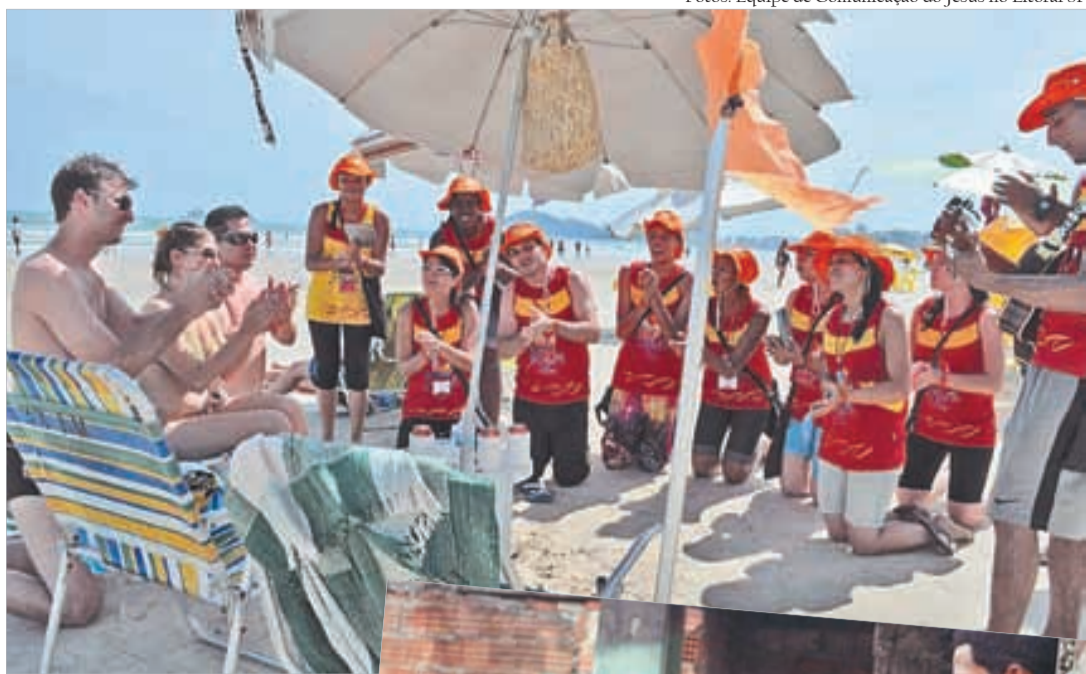
Os jovens estiveram nas praias e em visita às casas, levando a mensagem do Evangelho de Jesus

Também foram feitas atividades de evangelização em um centro de reabilitação