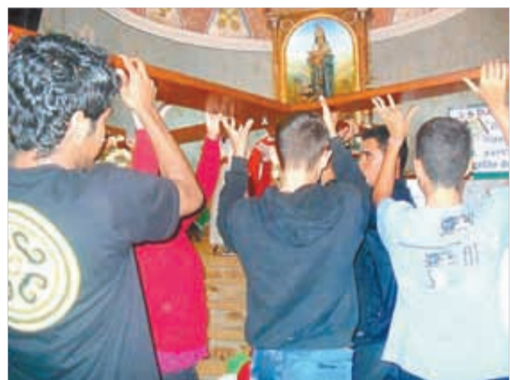
N. Sra. de Sion/Itanhaém - 15 a 22/9/2012