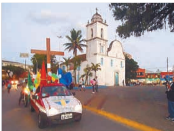
Matriz de Itanhaém - 8 a 15/9/2012