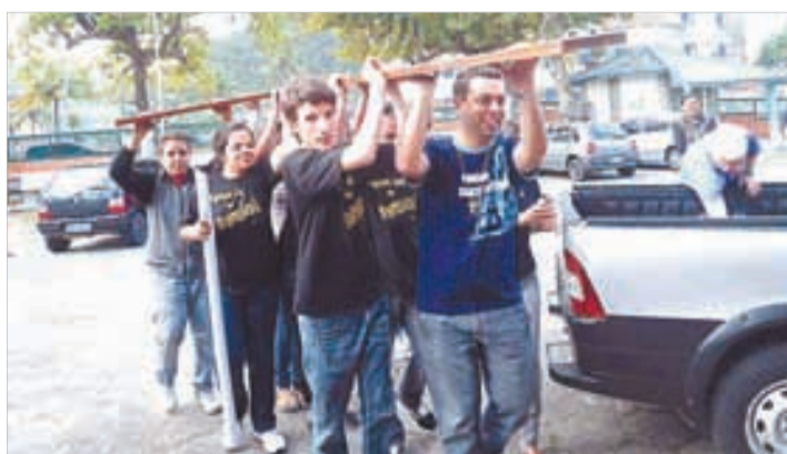
MSanta Terezinha - 22 a 29/9/2012