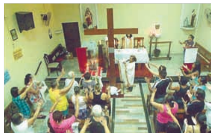
N. Senhora das Graças/Guarujá - 12 a 19/1/2013