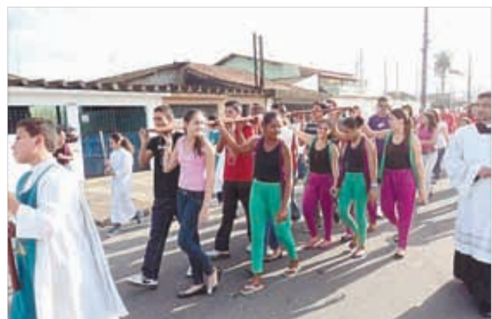
Par. Santo Antonio/PG - 13 a 20/10/2012