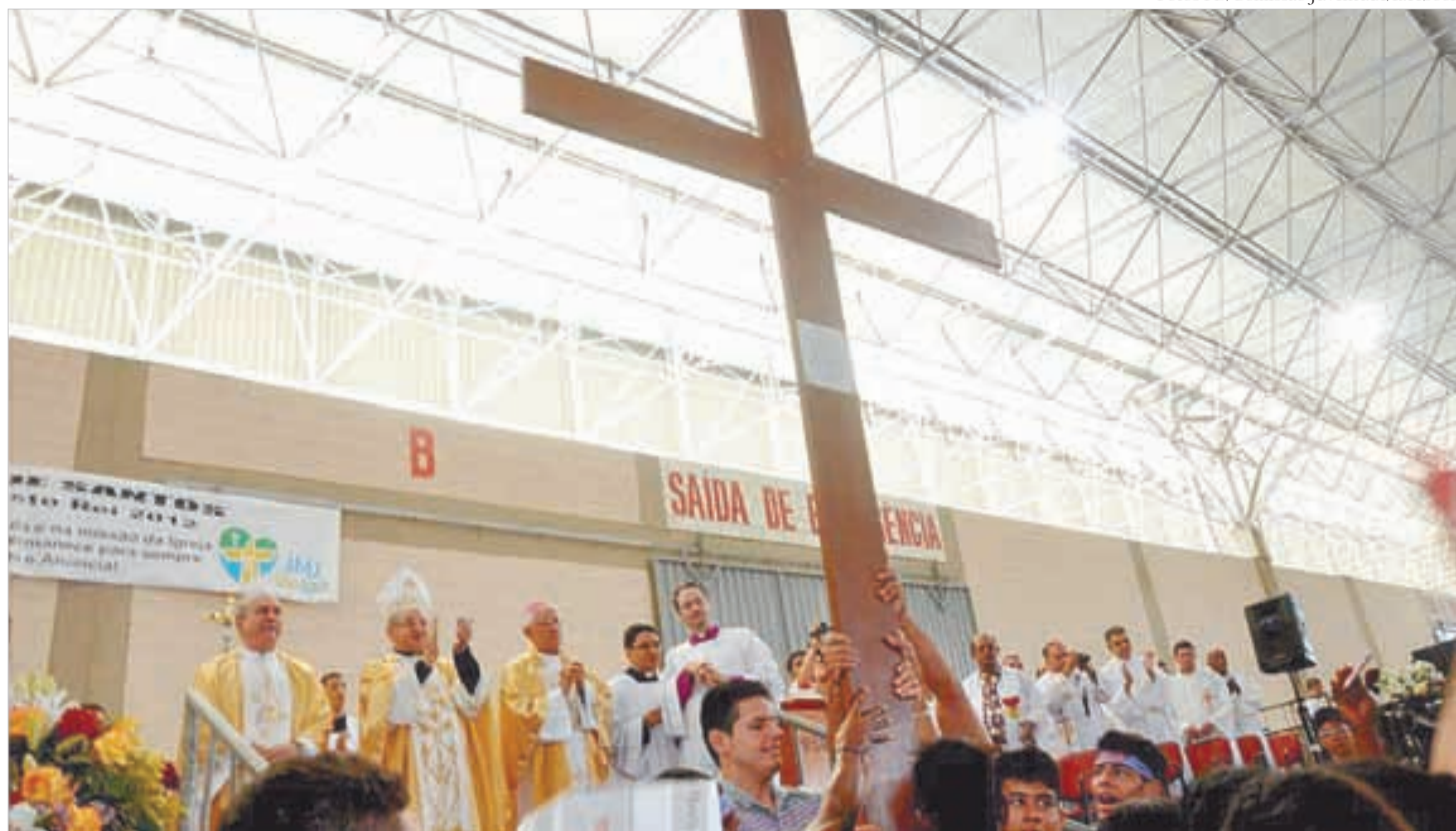
Jovens da Paróquia N. Sra. Aparecida/SV levam a réplica da Cruz da Juventude na celebração diocesana de Cristo Rei