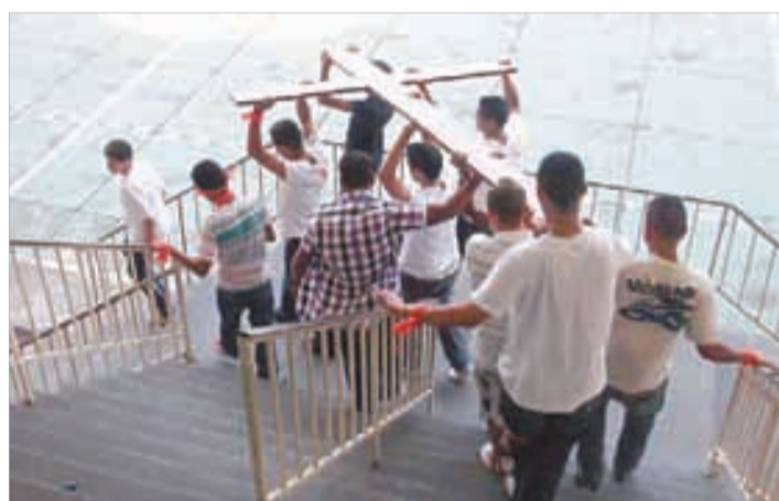
Jovens da paróquia S. João Batista, de Peruíbe, deixam o Colégio Santista com a réplica da Cruz que percorrerá as paróquias da Diocese

Em relação aos voluntário da Diocese que vão atuar durante o evento, já foram confirmados cerca de 38 jovens, mas esse número pode aumentar (Continua na próxima página).