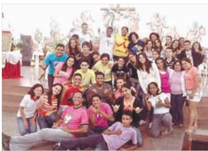
"Desperta Jovem" Litoral Sul - Dezembro 2012