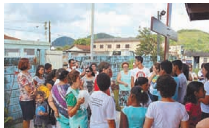
Santa Rosa/Guarujá - 19 a 26/1/2013 - visita nas casas