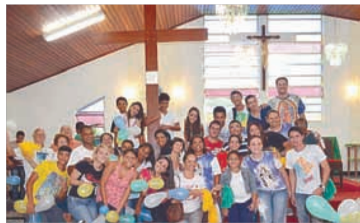
Senhor Bom Jesus/Guarujá - 26/1 a 2/2/2013