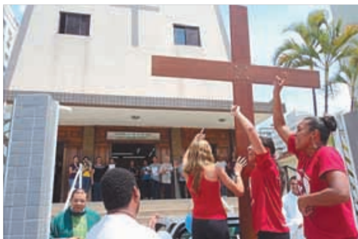
S. Pedro Pescador/Sv - 20 a 27/12/2012