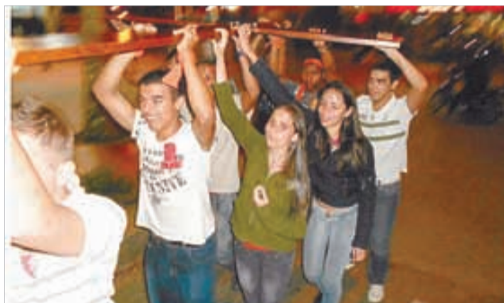
Chegada da Cruz em Peruíbe - Par. S. João Batista 26/8 a 1/9/2012