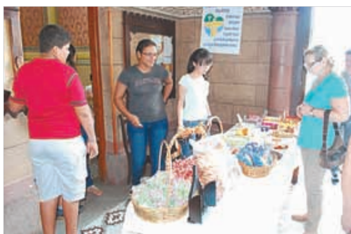
Jovens da Basílica do Embaré e a barraquinha de doces