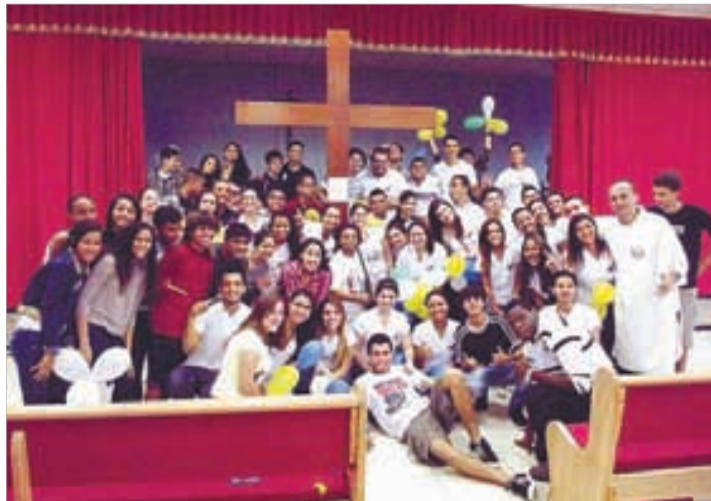
S. Francisco de Assis/CB - 29/12/2012 a 5/1/2013