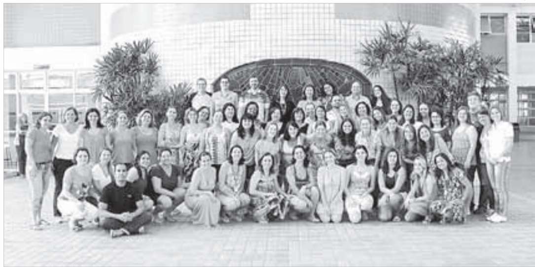
Professores que participaram da "Formação Linceu Santista 2013"