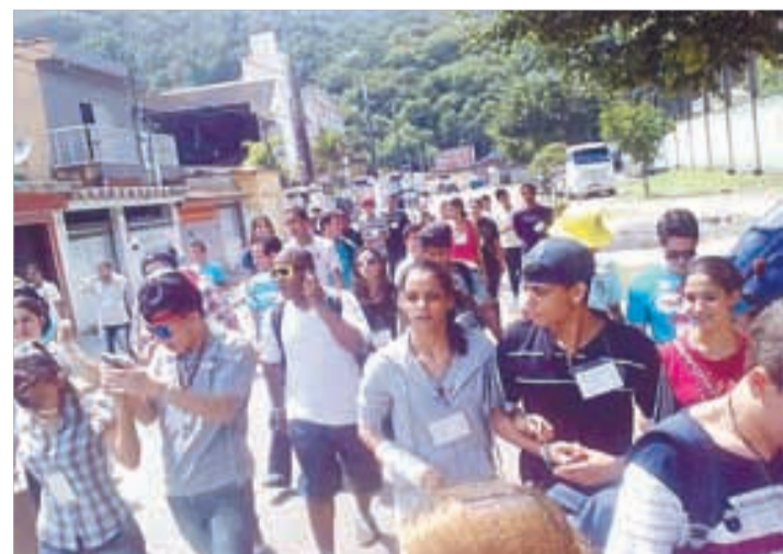
Missão Popular na paróquia Sr. Bom Jesus - out 2012