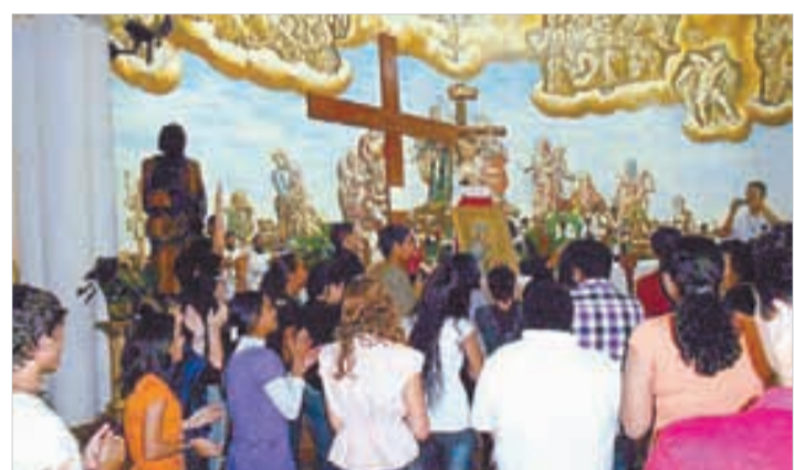
S. José Operário/Peruíbe - 1 a 8/9/2012