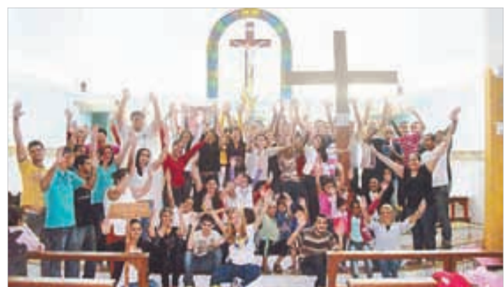
N. Sra. Aparecida/Mongaguá - 29/9 a 6/10/2012