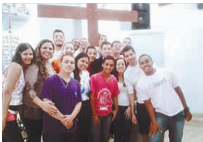
N. Sra. das Graças/SV - 25/11 a 1/12/2012