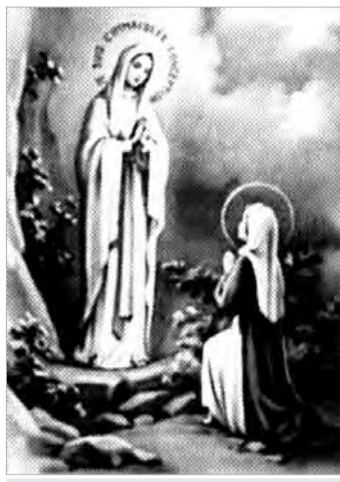
N. SRA. DE LOURDES

Obs: Após a missa, das 19 horas haverá Procissão pelas ruas do bairro.