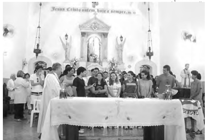
Juventude da Diocese reiniciam as atividades pastorais