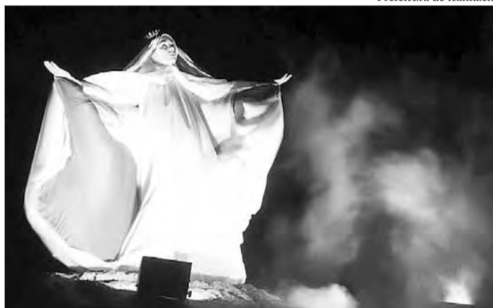
Encenação é um dos destaques culturais de Itanhaém