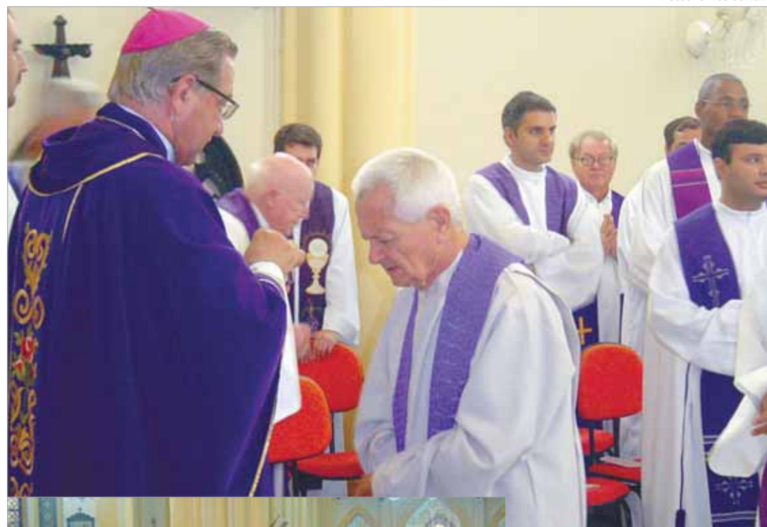
Sacerdotes recebem as Cinzas, como sinal do início da caminhada de penitência quaresmal que irão viver com suas comunidades.