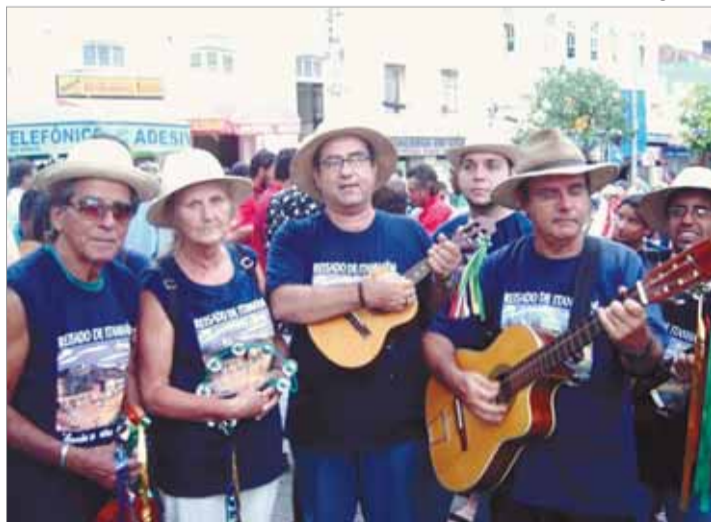
Encontro ajuda a manter a tradição e troca de experiências