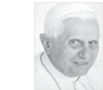
Papa Bento XVI

É evidente, no Evangelho, a admoestação que Jesus faz a quem possui e usa só para si as