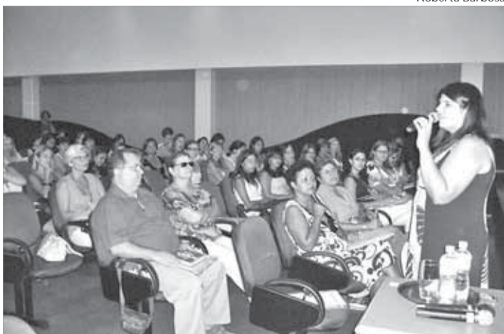
Palestras reafirmaram a identidade católica do Liceu Santista: fortalecer as relações interpessoais