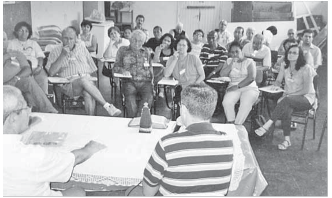
Pastoral precisa, especialmente, de voluntários para a cidade de Mongaguá

No dia 9 de dezembro passado, na Igreja Nossa Senhora da Lapa, em Cubatão, foi realizado o Encontro Diocesano de Pastoral Carcerária. No início do encontro, os agentes assistiram o vídeo "Uma Luz de Esperança", produzido pela Arquidiocese de Campinas, com depoimentos de vários bispos sobre a importância do trabalho/missão da Pastoral Carcerária (PCr).