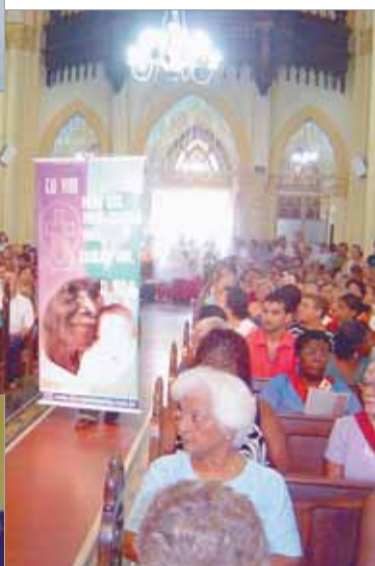
Encontro de formação sobre a Campanha da Fraternidade na paróquia Santo Antonio, em Praia Grande, no dia 26 de janeiro. Sensibilização continua em outras comunidades

da pobreza, violência, injustiça, em que se encontram milhares de irmãos".