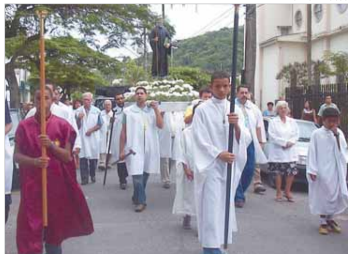
Povo foi às ruas homenagear o padroeiro da Cidade