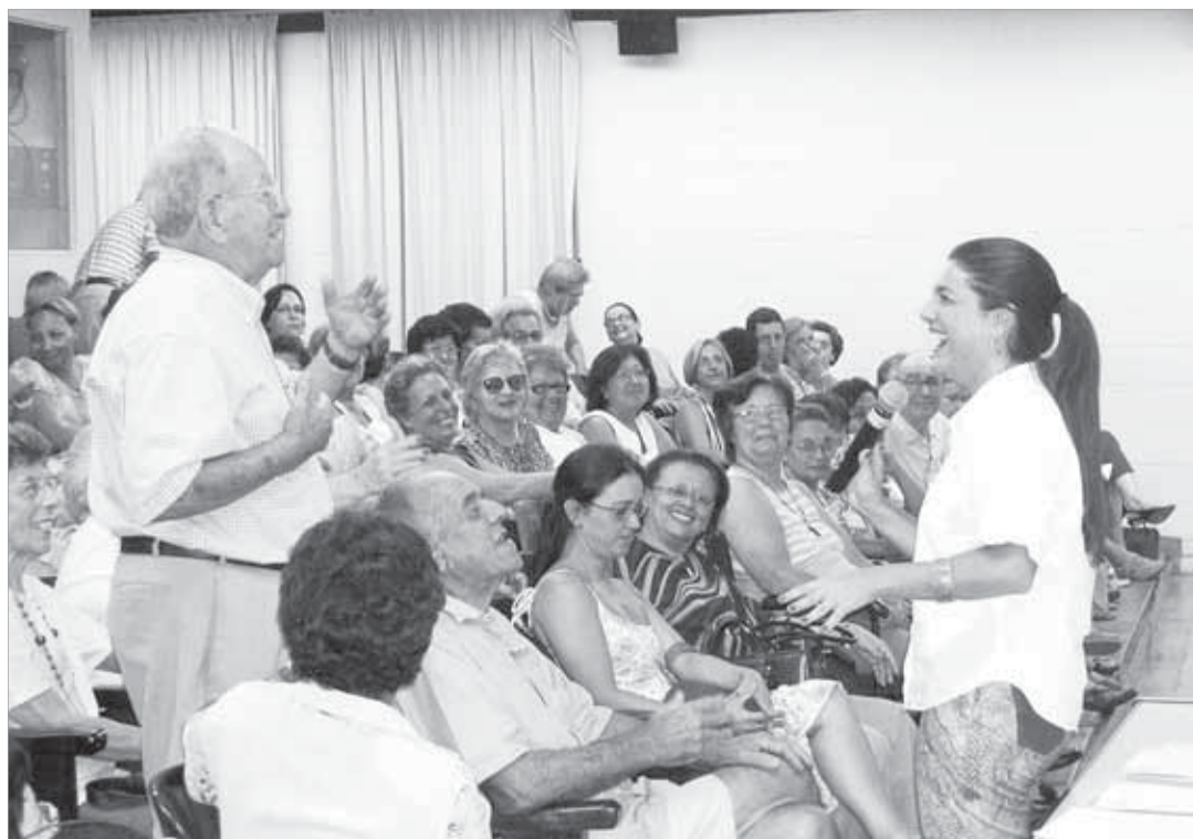
Reconhecer o valor da vida, resgatar a auto-estima e valorizar o ser humano, por meio de atividades culturais e sócio-recreativas, é o propósito do curso

O empenho da direção, da equipe pedagógica e de representantes da Sociedade Visconde de São Leopoldo tornou possível acontecer a Formação 2008, que muito contribuiu para o aperfeiçoamento do professor nas dimensões cognitiva, psicológica, religiosa e social.