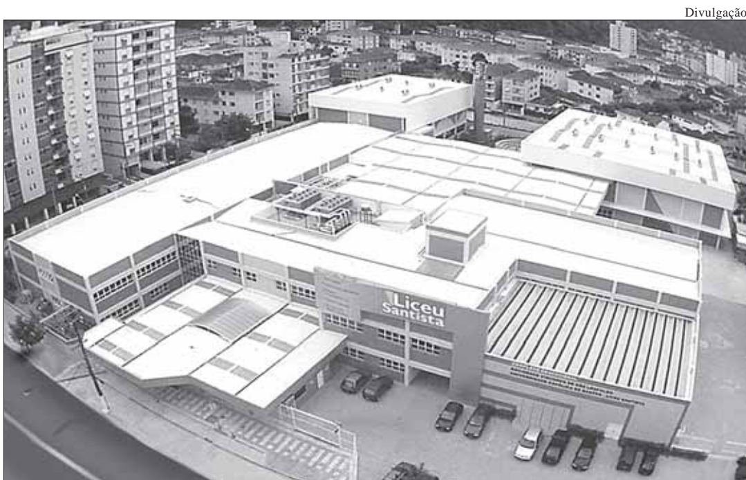
Os três andares da construção serão climatizados e vão oferecer a estrutura necessária para um melhor trabalho pedagógico