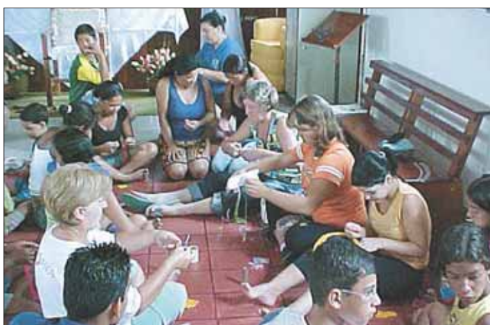
Nas comunidades ou visitando as famílias, os missionários viveram momentos de fé e de entrega ao próximo

Todos os dias os missionários tinham uma intensa programação a cumprir. Começavam suas atividades às 7 horas com o despertar, café da manhã, momento de oração às 8 horas, e