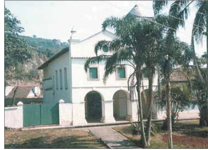
Localizado no Morro do São Bento, o prédio do Museu foi construído em 1725