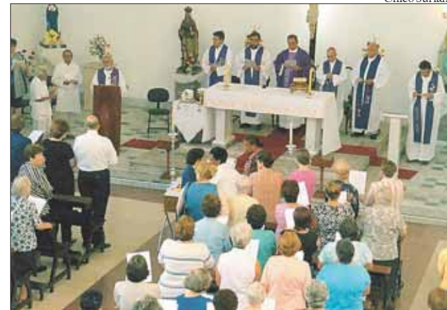
Missa de corpo presente reuniu religiosos e membros da Universidade