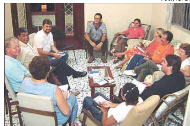
Representantes das Igrejas preparam lançamento ecumênico no dia 11/2