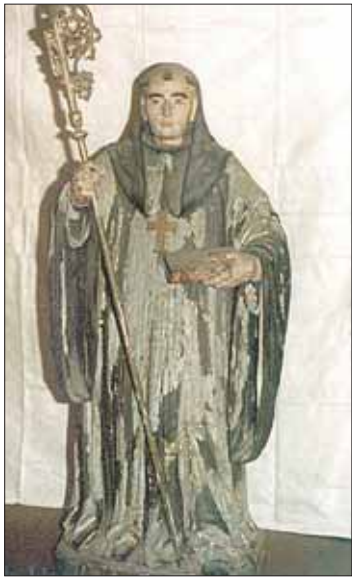
Imagem de S. Bento, com o Livro de Regra, que contém as normas da Ordem Beneditina

Na Sala de Arte Popular, devotos comemoram graças al-