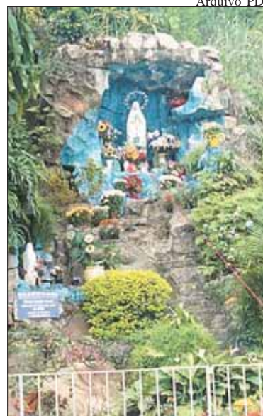
Gruta de Lourdes no bairro José Menino, em Santos

A partir de março, as missas em honra a Nossa Senhora de Lourdes, e pelos enfermos, serão celebradas todo segundo sábado de cada mês, às 8h30.