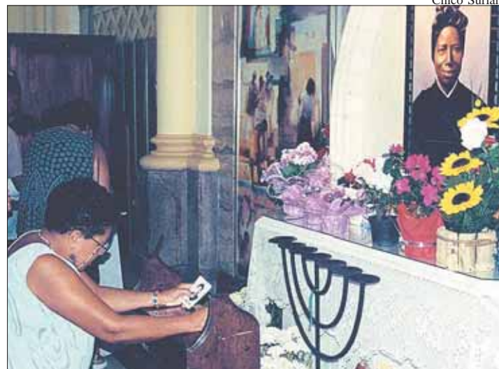
Fiéis recorrem à Santa Bakhita para pedir bênçãos e agradecer graças alcançadas