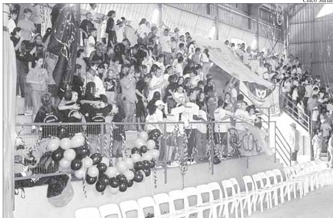
Seminaristas diocesanos ajudaram a organizar a Gincana Vocacional que refletiu sobre a missão dos coroinhas