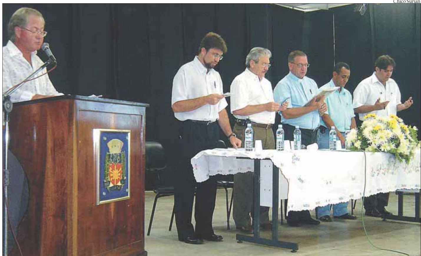
Lançamento do Texto-Base da CF 2005, em Cubatão, no dia 2 de fevereiro, reuniu lideranças das Igrejas Católica, Luterana e Anglicana