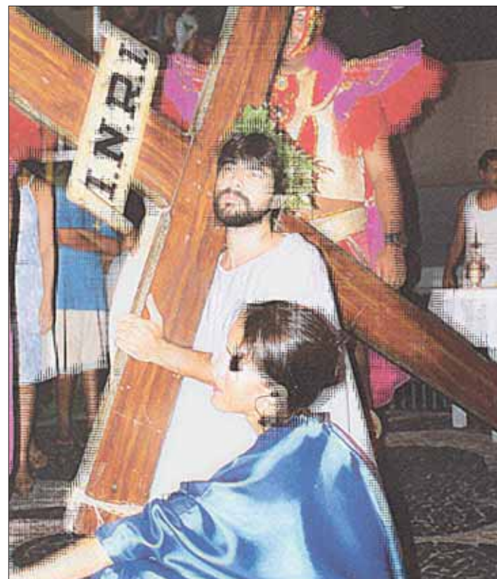
Se a morte de Jesus é apenas uma passagem para a Vida, é com certeza, na vida que devemos nos concentrar durante a Quaresma

A Quaresma marca o tempo litúrgico entre a Quarta-feira de Cinzas e a Quinta-feira Santa (este ano, de 9 de fevereiro a 24 de março). Para melhor entender a Quaresma, é preciso compreender a simbologia do número 40 na Bíblia. Por diversas vezes "40 dias" é o prazo que antecede um grande acontecimento. É um