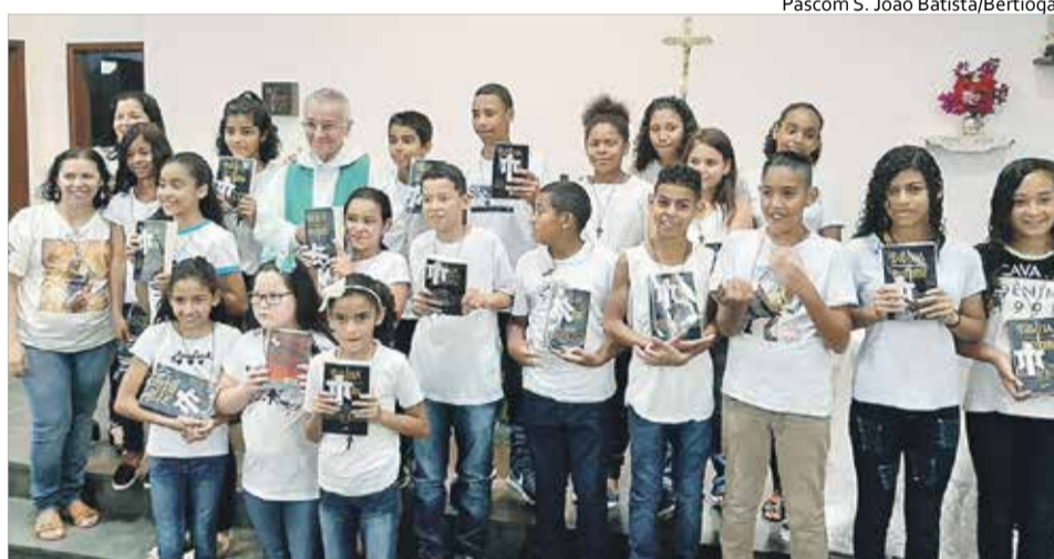
Pascom S. João Batista/Bertioqa