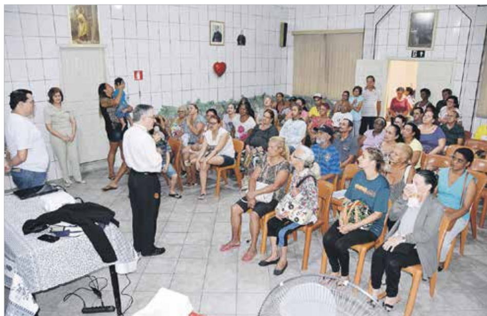
Encontro com as famílias assistidas no projeto "Bela Vida"