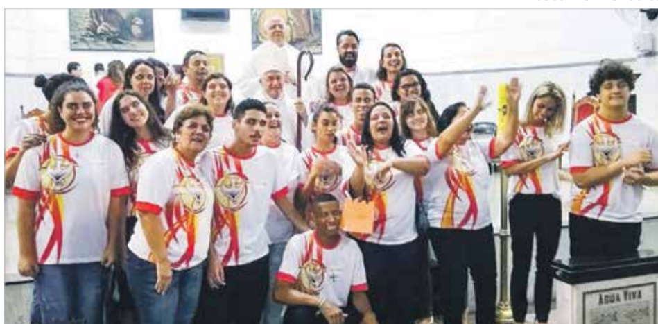
Pascom S. Benedito

No dia 9 de novembro, a comunidade da Paróquia São Paulo Apóstolo, em Santos, realizou, com as crianças da Catequese, a festa de “Todos os Santos”. Jogos e brincadeiras ajudavam as crianças a conhecer mais a vida dos santos e a doutrina da Igreja.