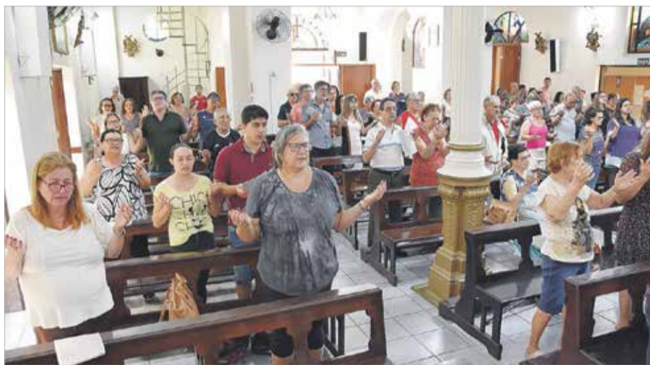
Comunidade da Igreja Santa Cruz compartilha o carisma camiliano da atenção pastoral aos enfermos

Visita aos enfermos e paroquianos que já não podem mais frequentar a comunidade