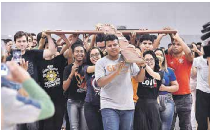
A juventude marca presença na solenidade de Cristo Rei entronizando a Cruz da Jornada Mundial da Juventude como lembrança do compromisso missionário