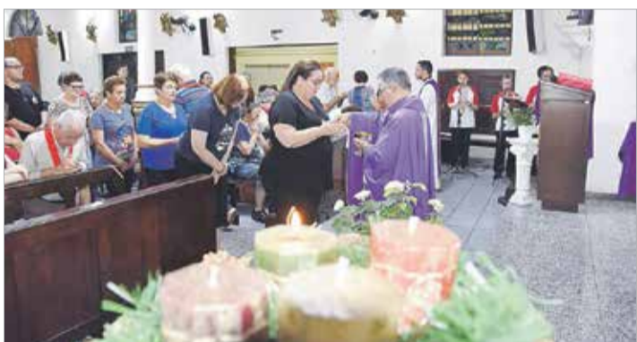
Celebração no Advento: tempo propício para renovar a esperança