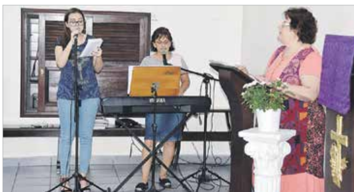
Comunidade enfrenta a dificuldade da pouca presença dos jovens