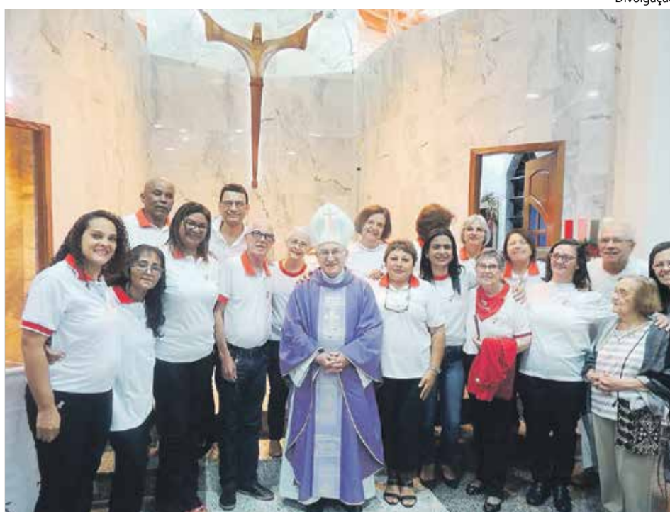
D. Tarcísio e Guias: oficinas de Oração e Vida leva a um encontro profundo com o Mestre Jesus

2ª - Existe, através da reconciliação universal, uma profunda purificação de todas as mágoas, feridas, tristezas e agonias mentais. Elimina-se lentamente tudo isto mediante uma oração especial: a oração de abandono.