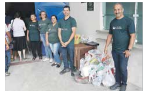
Agentes da Pastoral Carcerária