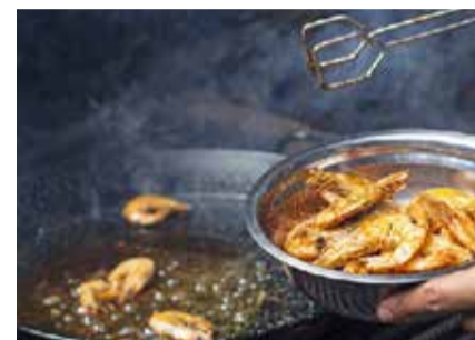
Orientação visa também evitar frituras

Com o objetivo de atender aos requisitos básicos para a promoção e a proteção da saúde, a UniSantos e a Prefeitura Municipal de Guarujá irão desenvolver o projeto “Alimentação Saudável”, no início do próximo ano, na Praia das Pitangueiras. Ambulantes e frequentadores da praia fazem parte da ação que envolve docentes, pesquisadores e acadêmicos dos cursos de Gastronomia e Nutrição.