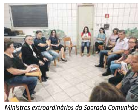
Ministros extraordinários da Sagrada Comunhão