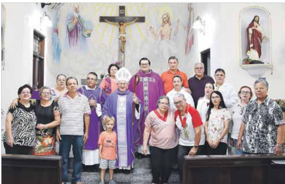
Equipes de serviço na missa de encerramento