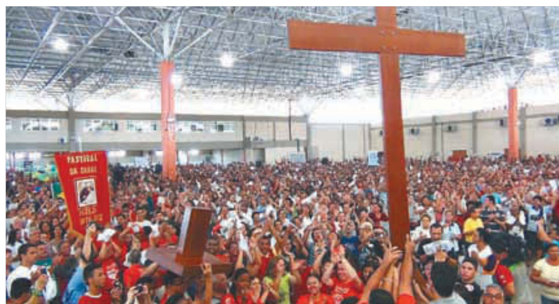
A réplica da Cruz da JMJ vai percorrer todas as paróquias da Diocese, motivando os jovens para o encontro com o Papa, em julho de 2013, no Rio de Janeiro