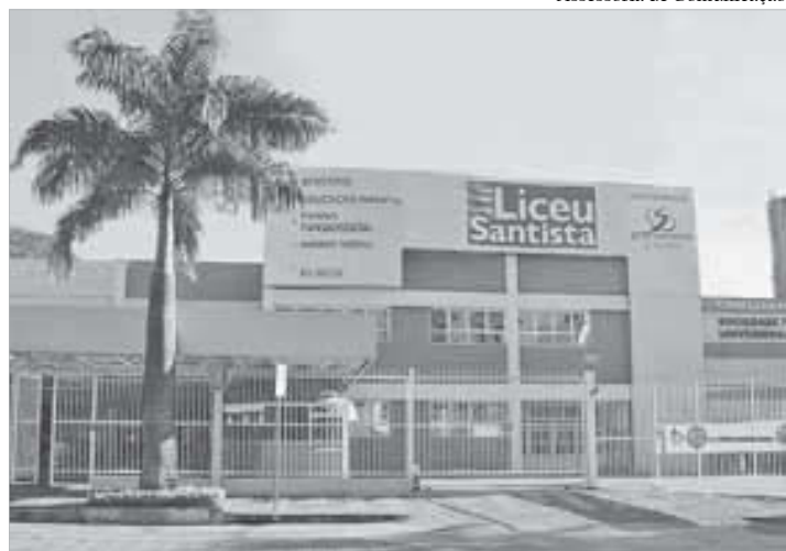
"O Natal é a presença, em nossos corações, do Menino de Belém, que nos ama e nos toca com sua simplicidade"

Diante da negação da vida, como vamos receber o Menino Jesus no Natal de 2012? Será festejado como o Aniversário ou Papai Noel