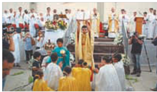
Participação de jovens na procissão de entrada do Cristo Rei, na procissão da Palavra (IAM)...