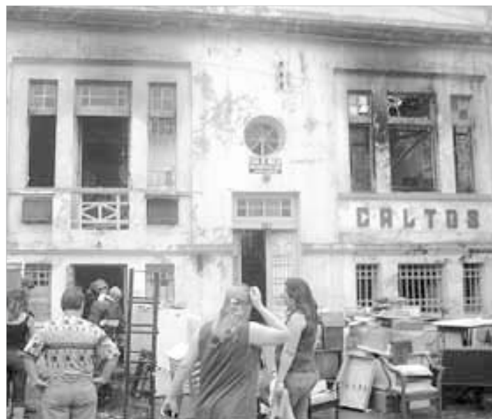
Com o incêndio, os serviços foram comprometidos

que nasce no meio seco, na areia. Para retirar o que ele tem de bom, precisa primeiro ter cuidado e delicadeza para retirar os espinhos, para depois chegar no centro". A instituição é reconhecida como de Utilidade Pública Municipal e Federal e filiada à Comunidades Terapêuticas Nacionais e internacionais.