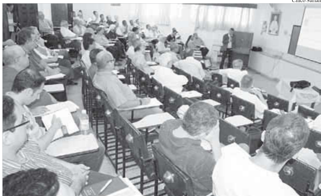
Padres Conciliares souberam dialogar com as ciências, teologias e filosofias, habilitando-os para propor a mensagem evangélica de acordo com os desafios do novo mundo

"A Teologia do Concílio Vaticano II é o que eu costumo dizer uma teologia mundi, isto é, uma Teologia que se faz enquanto Ciência da Fé em articulação com o mundo. Isso significa que a Teologia possui um caráter contemporâneo de cada época histórica. Nesse sentido, o Concílio produziu uma Teologia em diálogo, em diálogo com a história da humanidade, com seus dramas, angústias, tristezas, alegrias, esperanças, dádivas; em diálogo