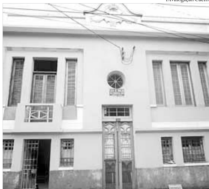
A casa de triagem agora já pode receber novos candidatos