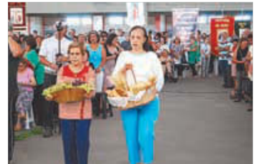
... e no Hino de Ação de Graças. Na procissão das ofertas, membros do CODILEI