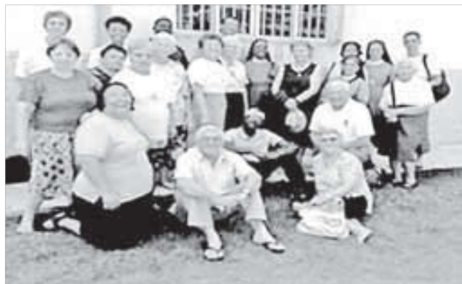
Religiosos da Diocese de Santos durante encontro de confraternização no Guarujá, no dia 20 de novembro