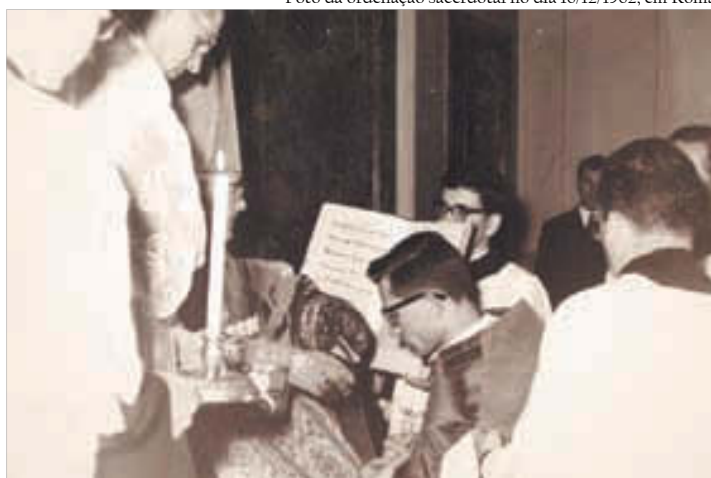
Foto da ordenação sacerdotal no dia 16/12/1962, em Roma