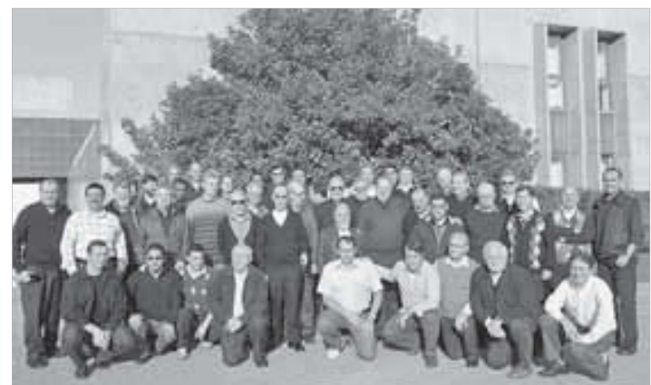
Acima: novo Conselho Geral. Abaixo, Padres Capitulares