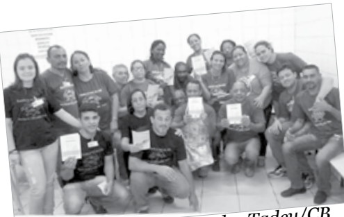
Grupo de Casais da S. Judas Tadeu/CB

O livreto com os Círculos Bíblicos está organizado contendo as cinco “urgências”, a saber: Igreja em Estado Permanente de Missão, Igreja, Casa de Ini-