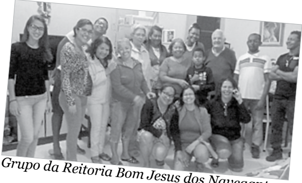
Grupo da Reitoria Bom Jesus dos Navegantes