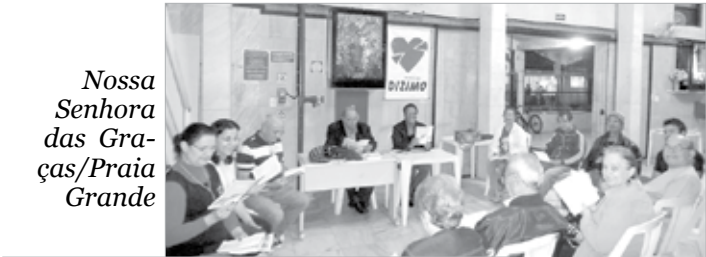
Nossa Senhora das Graças/Praia Grande