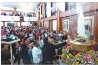
Imagem Peregrina na S. João Batista/Peruíbe

nossa Igreja, nestes 100 anos, e para nossa Diocese”. De 17 a 19 de julho, a paróquia Coração de Maria recebeu mais de 200 jovens de diversas cidades do Estado de S. Paulo para celebrar o “Jubileu do Coração”.