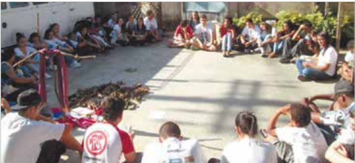
Oração da Manhã de sexta-feira, 10/7