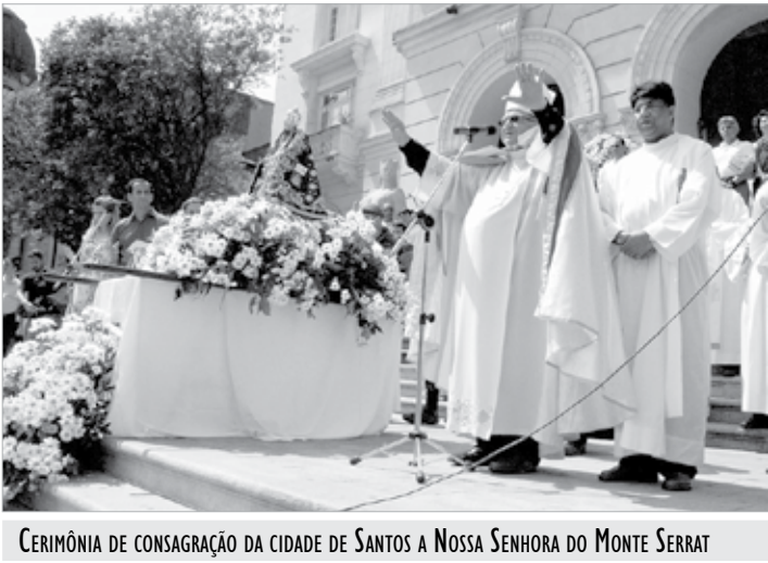
CERIMÔNIA DE CONSAGRAÇÃO DA CIDADE DE SANTOS A NOSSA SENHORA DO MONTE SERRAT

Martírio de S. João Batista São João Batista/ Peruíbe 26, 27 e 28/8- 19h- Tríduo de São João.