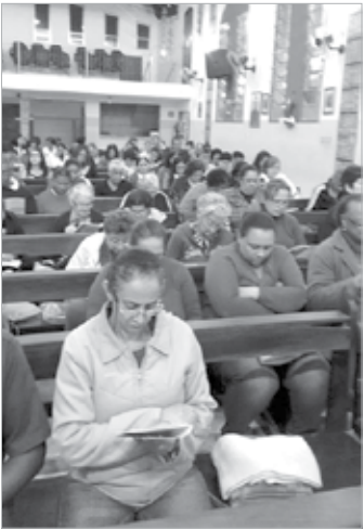
S. José de Anchieta/SV