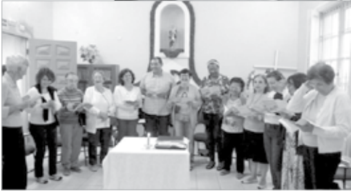
Paróquia São Pedro O Pescador/SV