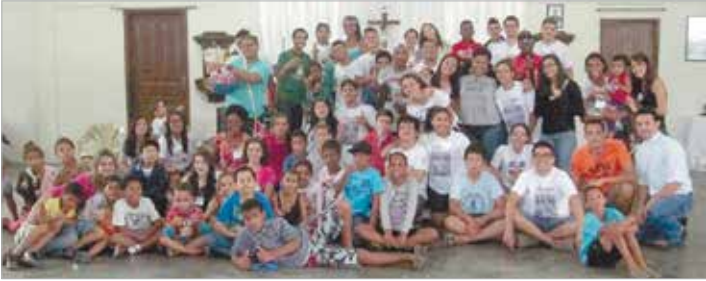
Missionários e crianças da Comunidade