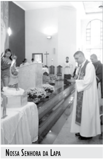
Nossa Senhora da Lapa

Festa de N. Sra. da Lapa, Padroeira de Cubatão 3/8- 20h- Terço dos homens com toda a Região Pastoral de Cubatão. 8/8 - Caminhada Eco- -espíritual , saindo às 9h da Capela Santo Antonio na Água Fria em direção ao Núcleo Itutinga-Pilões. 6 a 15/8- Novena da Pa- droeira 6 a 14/8- 18h30- Novena e em seguida, Missa. 15/8-Arrastão do San- to Terço: às 12h haverá oração do Terço em 50 pontos diferentes em to- dos os bairros da cidade para marcar o 50º ani- versário de consagração da Cidade a N. Sra. da Lapa. 15h- Carreata e bênção de veículos e motoristas, saindo da paróquia S. Judas Tadeu, em direção à paróquia S. Francisco de Assis. 17h30- Procissão lumi- nosa com as imagens de N. S. da Lapa, S. Francisco e S. Judas Tadeu, para o Centro Esportivo Romerão. 8h e 10h- Missas na Igreja N. Sra. da Lapa. 19h - Missa Campal no Centro Esportivo Romerão e em seguida show com o cantor Gil Monteiro. 16/8- 14h- Ação Soli- dária da Padroeira com prestação de serviços gratuitos e área de lazer para as crianças. 14h30 - Encenação da origem da devoção a Nossa Senhora da Lapa. 17h- Zumba Aleluia - Lou- vor ao ritmo de zumba. 19h - Show com a Banda Estação 12. End.: Av. 9 de Abril, 1947, Centro. Tel.: 3361-1272. N. Sra. da Assunção (Pa- róquia Nossa Senhora da