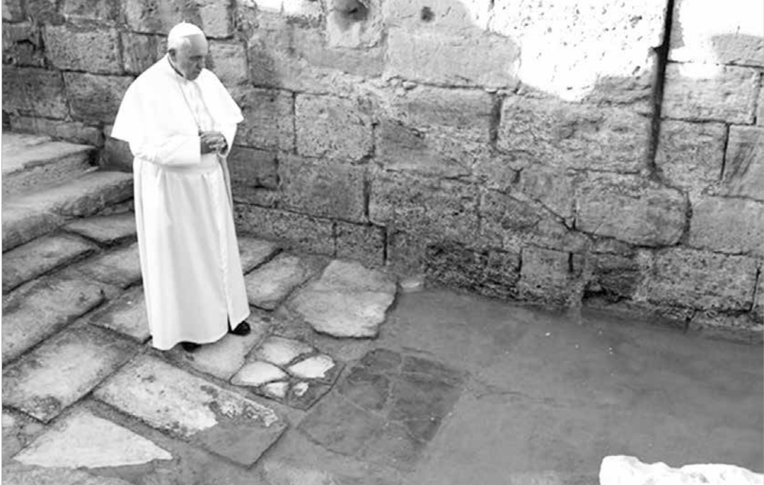
Papa Francisco reza as margens do Jordão, em Betania, local do batismo de Jesus

mo figura em um esplêndido mosaico do século VI descoberto em 1897 em Madaba (atual Jordânia), com a explicação em grego de que se tratava do “lugar do batismo de João”, diante de “Ainon onde agora é Sapsafas”, na margem oriental do rio.