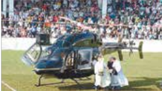
Recepção calorosa no Estádio da Portuguesa