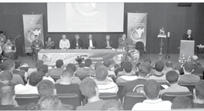
Missionários devem tornar-se centrados em Jesus

tas e também por discussões em grupos realizadas entre nós, seminaristas. Entre elas, destaco a reflexão de Dom Esmeraldo: “É necessário fazer algumas passagens e mudanças de comportamento para que nos tornemos autênticos missionários, tais como: de um missionário sujeito da missão, para um missionário discípulo; de um missionário centrado em si mesmo, para um missionário centrado em Jesus Cristo; de um missionário que centraliza tudo em si para um missionário que valoriza o protagonismo das pessoas”. Para mim, o congresso foi uma oportunidade riquíssima de aprofundar o tema da missão e perceber o quanto ainda temos que crescer para ser uma ‘Igreja em saída’. As reflexões foram muito boas e foi possível alargar os horizontes, sobretudo pelo contato com outros seminaristas e suas realidades. Penso que agora é momento de arregaçar as man-