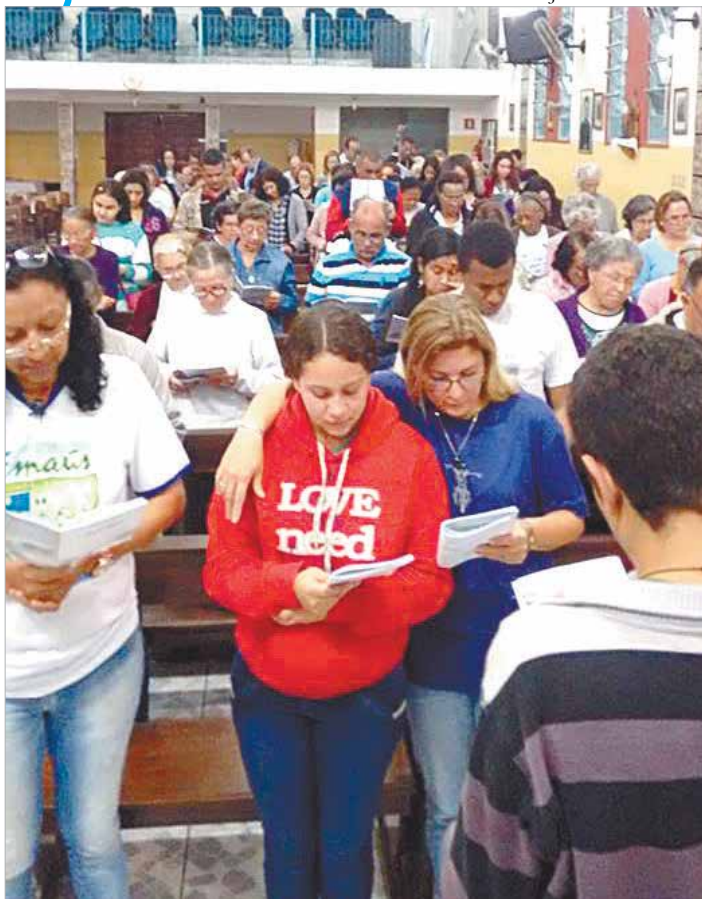
S. José de Anchieta/SV