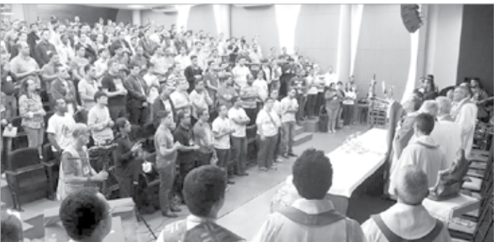
Missionário presbítero para uma igreja em saída

Do dia 9 a 12 de Julho, participei do 2º Congresso Missionário Nacional de Seminaristas, em Belo Horizonte- MG, realizado no auditório do Museu de Ciências Naturais da PUC Minas. O Congresso teve como tema: “O missionário presbítero para uma Igreja em saída”, e como lema: “Ide sem medo para servir”. No primeiro dia, fomos carinhosamente acolhidos por Dom Walmor Oliveira de Azevedo, Arcebispo Metropolitano de Belo Horizonte. Ao longo do congresso, tivemos a presença dos seguintes conferencistas: Cardeal Dom Cláudio Hummes, Prefeito Emérito da Congregação para o Clero e Presidente da Comissão Episcopal para a Amazônia da CNBB. Dom Esmeraldo Barreto de Farias, Bispo Auxiliar de São Luís (MA) e Presidente da Comissão Episcopal para a Ação Missionária e a Cooperação Intereclesial da CNBB. Marilza Lopes Schuina, Presidente do Conselho Nacional do Laicato do Brasil (CNLB) Pe. Estêvão Raschiatti, Secretário Executivo do Centro Cultural Missionário (CCM). Os temas das conferências giraram sempre em torno de uma pergunta: como tornar a formação presbiteral mais marcada pelo ardor missionário? Várias foram as reflexões suscitadas pelos conferencis-