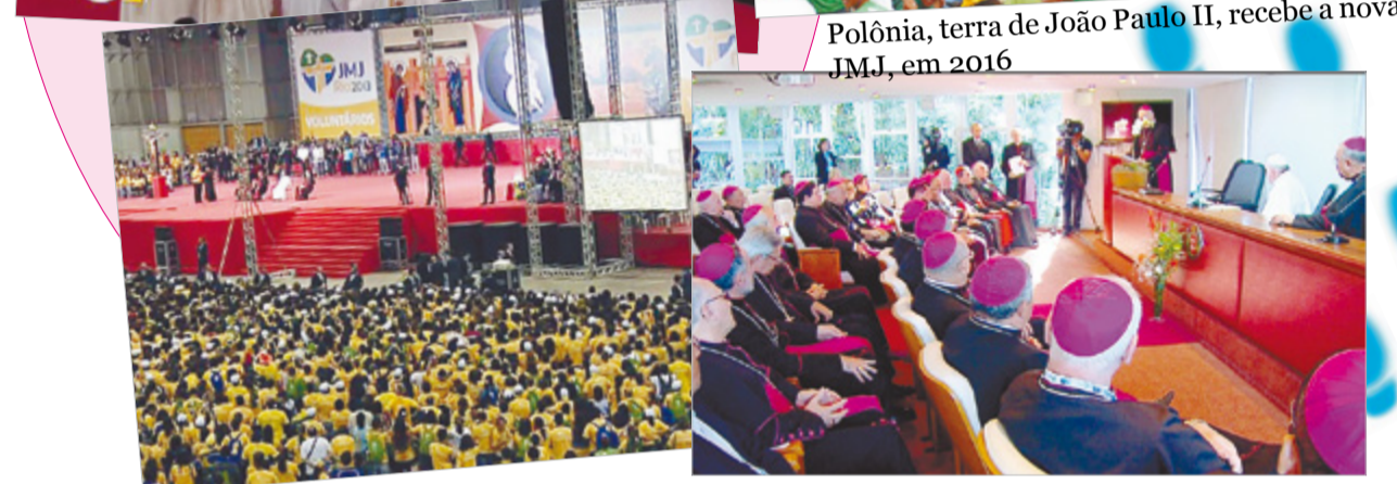
Polônia, terra de João Paulo II, recebe a nova JMJ, em 2016