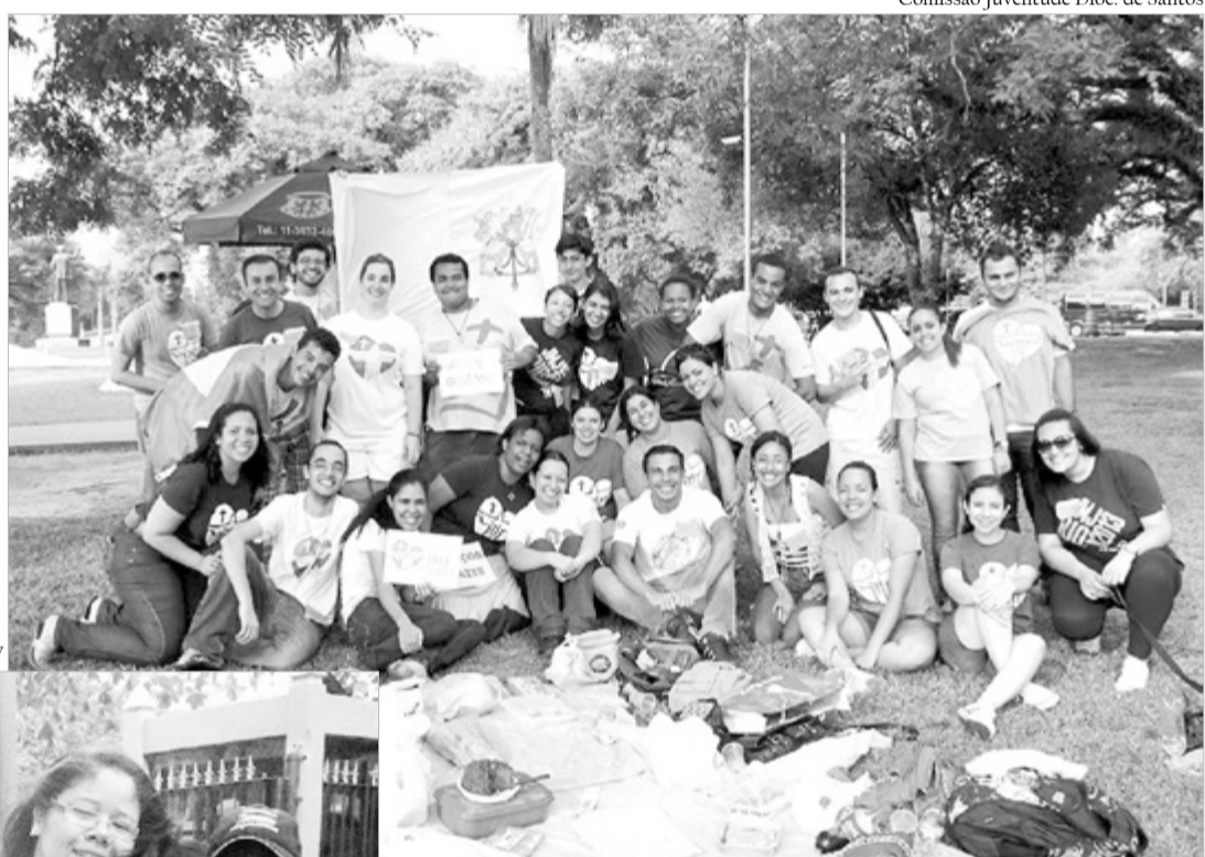
Voluntários da Diocese de Santos em preparação para a JMJ

mosteiros, dedicando-se à oração pelo bem do mundo, nos vários setores do apostolado, gastando-se por todos, especialmente os mais necessitados. Nunca me esquecerei daquele 21 de setembro – eu tinha 17 anos – quando, depois de passar pela igreja de San José de Flores para me confessar, senti pela primeira