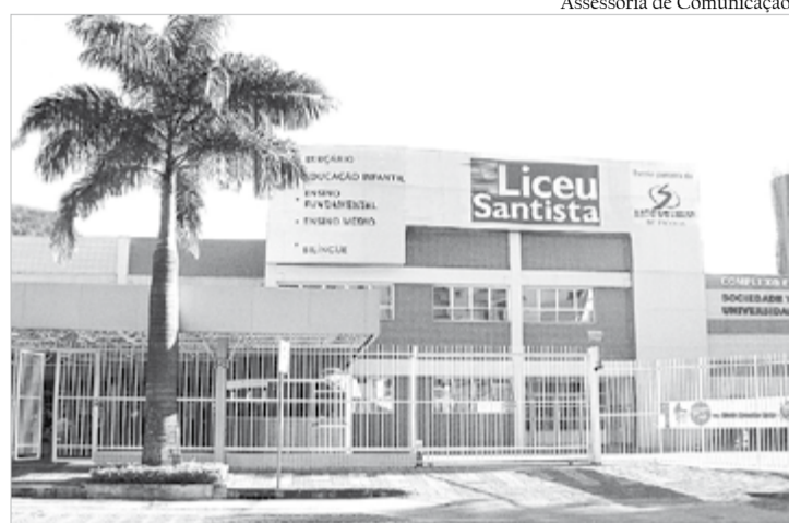
Assessoria de Comunicação Interessados em participar devem se inscrever diretamente pelo portal www.liceusantista.com.br

Data: 07, 14, 21 e 28 de novembro (quinta-feira)