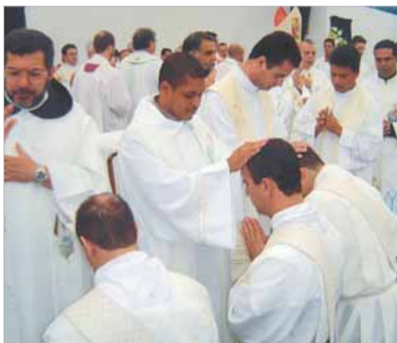
... os membros do Clero, como sinal da aceitação e da unidade presbiteral