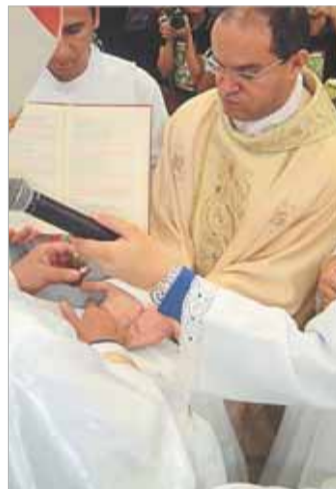
Unção das mãos: como Jesus, ungidos com o Espírito Santo para a santificação do povo