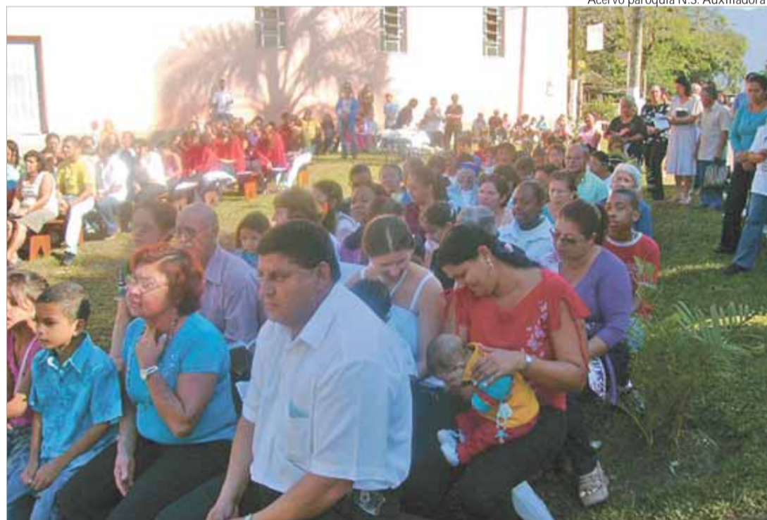
Durante as celebrações, foram lembradas as lutas, os sonhos e as conquistas garantidas pela população da Área Continental

À tarde, houve Missa Festa e em seguida as apresentações de várias quadrilhas danças, músicas e o teatro dos nossos jovens "60 anos de vida do nosso povo", contando a história de progresso, sofrimento, lutas com vitórias e derrotas para ter uma vida melhor por estes 60 anos da sua