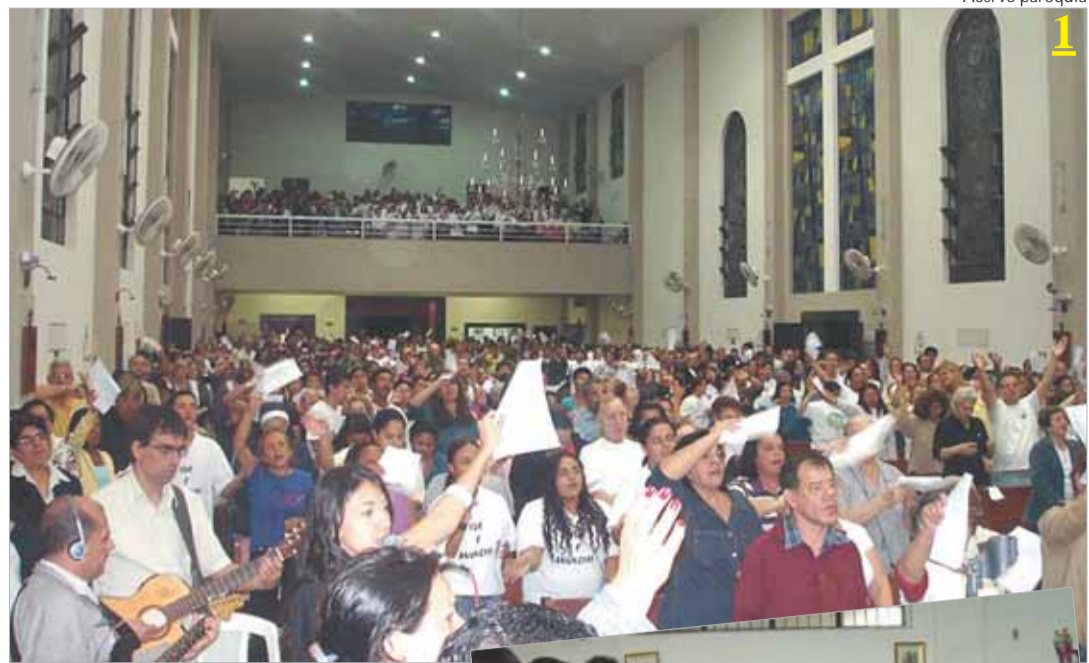
1 - Missa de Envio 2 - grupo de missionários 3 - visita ao asilo

Após a missa de envio, na Matriz de Santo Antonio, os jovens visitaram as casas de outros jovens afastados da Igreja, que haviam sido previamente cadastradas.