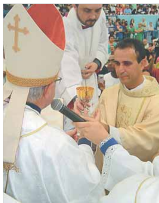
neo-sacerdotes recebem o pão e o vinho como símbolo do serviço que irão prestar ao povo