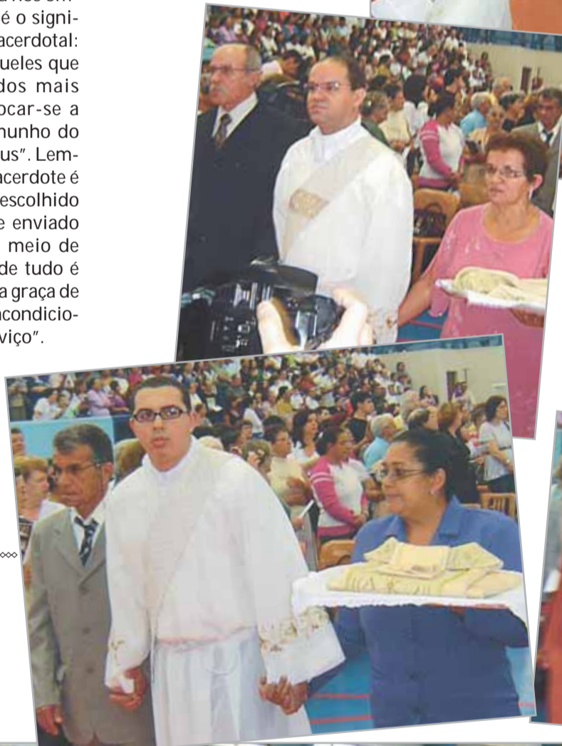
Ao lado e abaixo: Diáconos com seus pais e familiares na procissão de entrada: é a família, berço das vocações, que doa seus filhos para o serviço do Reino