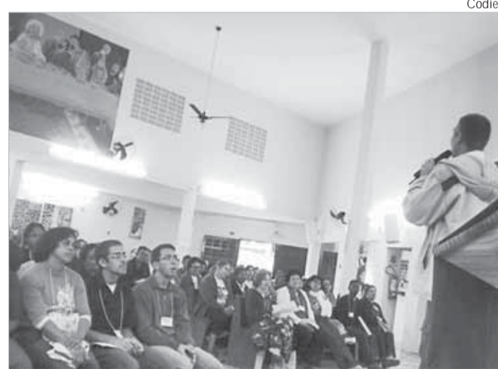
Retiro dos Catequistas da Região São Vicente (22/6)

(Codief - Comissão Diocesana de Educação da Fé)