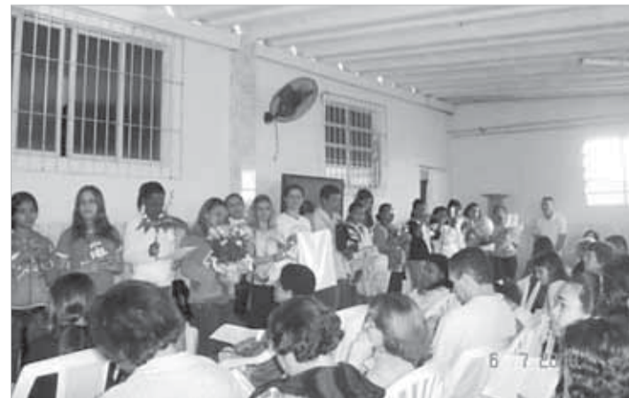
Retiro da Região Pastoral Litoral Centro (6/7)

A Comissão Diocesana de Educação da Fé (Codief) convida a todos para a missa festiva de encerramento do mês vocacional e Dia do Catequista.