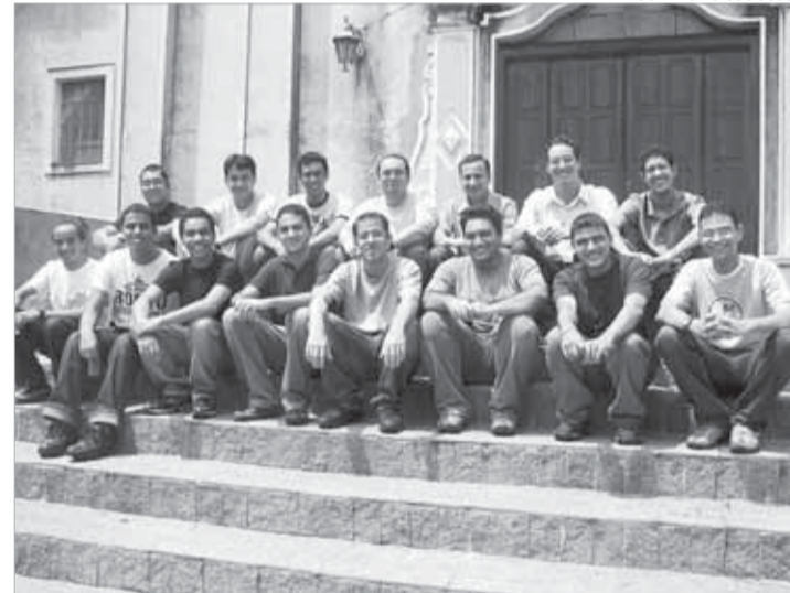
Os atuais 15 seminaristas durante retiro em Itaipic

O Seminário Diocesano, casa de formação de nossos futuros sacerdotes, procura oferecer, com responsabilidade, meios necessários para que jovens, já numa etapa posterior ao despertar vocacional, desenvolvam-se humana, espiritual e intelectualmente, com competên-