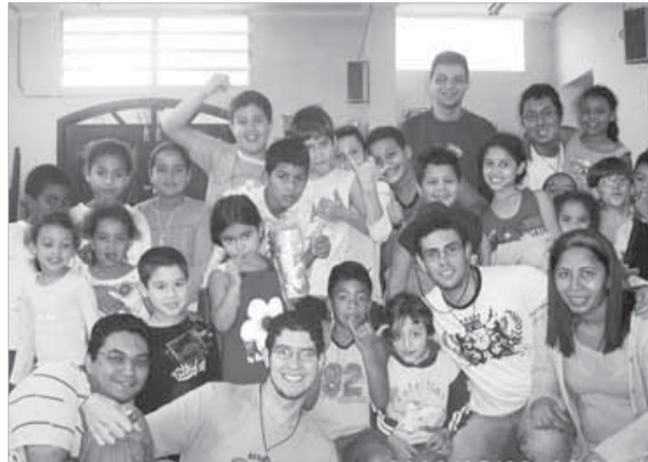
Equipe de seminaristas com a criançada: sementes de futuros missionários

Caminhávamos o dia todo, manhã e tarde, e íamos, em grupos de dois ou três, batendo de casa em casa; muitas famílias abriram para nós as portas de suas casas, e também as portas de suas vidas. Digo isso porque, alguns dos que visitamos, em poucos, ou muitos minutos, partilhavam conosco sentimentos íntimos, de tristeza pela dor da solidão