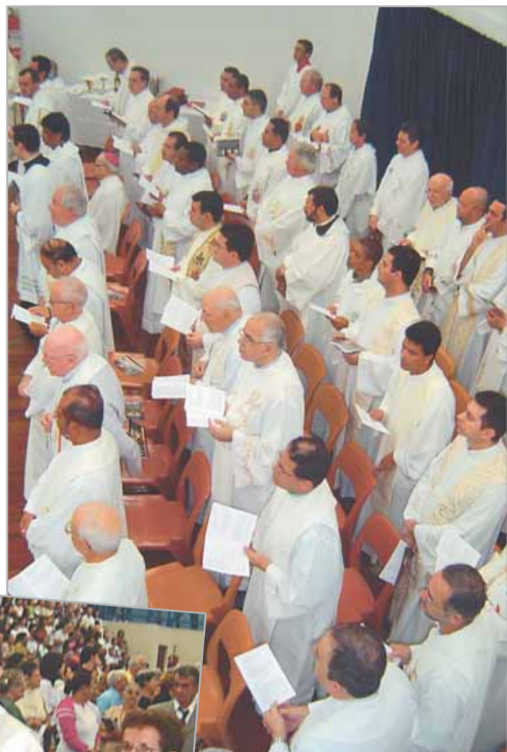
Acima. Sacerdotes da Diocese de Santos e de outras dioceses que vieram celebrar com os novos presbíteros