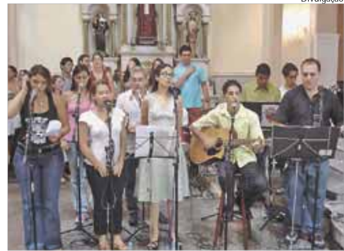
Grupo aposta na música para falar aos jovens