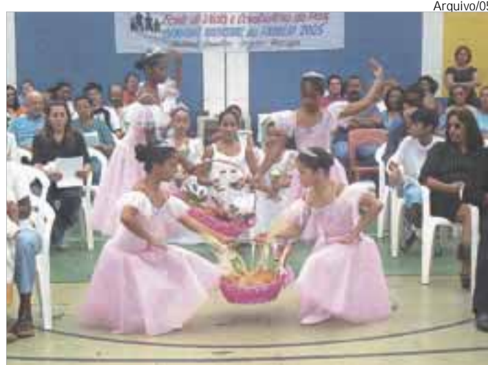
Celebração da Semana da Família, no Guarujá, em 2005

15/8 - 3ª-feira - 19h - Sessão Solene na Câmara