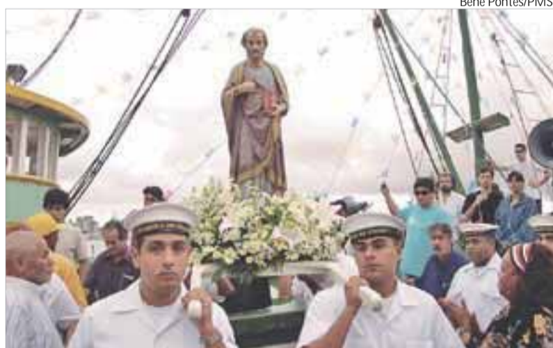
Festa de São Pedro Pescador, em Santos, à esquerda, e em São Vicente, no dia 2 de julho

Praia Grande: Fátima e Tadeu: 3471-4665 Guarujá - Solange e Nery: 3358-4176 / 9761-9597 Cubatão: Lúcia e Walmir: 3377-9450.