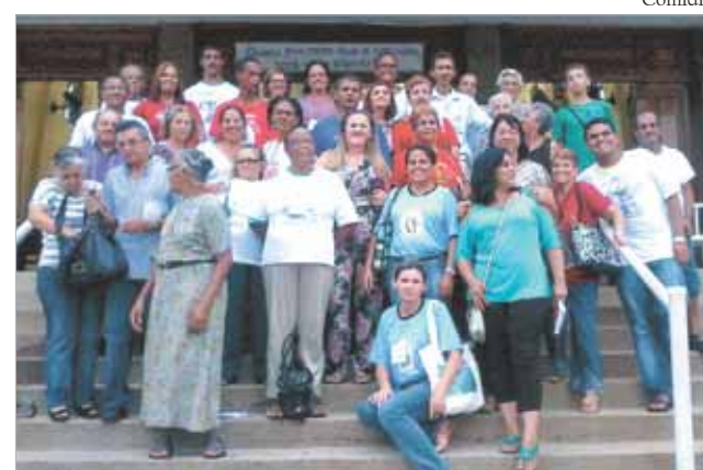
Agentes da Diocese durante encontro na S. Pedro

Foi realizado na Paróquia São Pedro Pescador, em São Vicente, no dia 25 de março, encontro do Conselho Missionário Diocesano (COMIDI). Iniciando com a Santa Missa, o encontro teve como principal objetivo enfatizar a Missão Evangelizadora, reforçando a verdadeira identidade da Igreja.