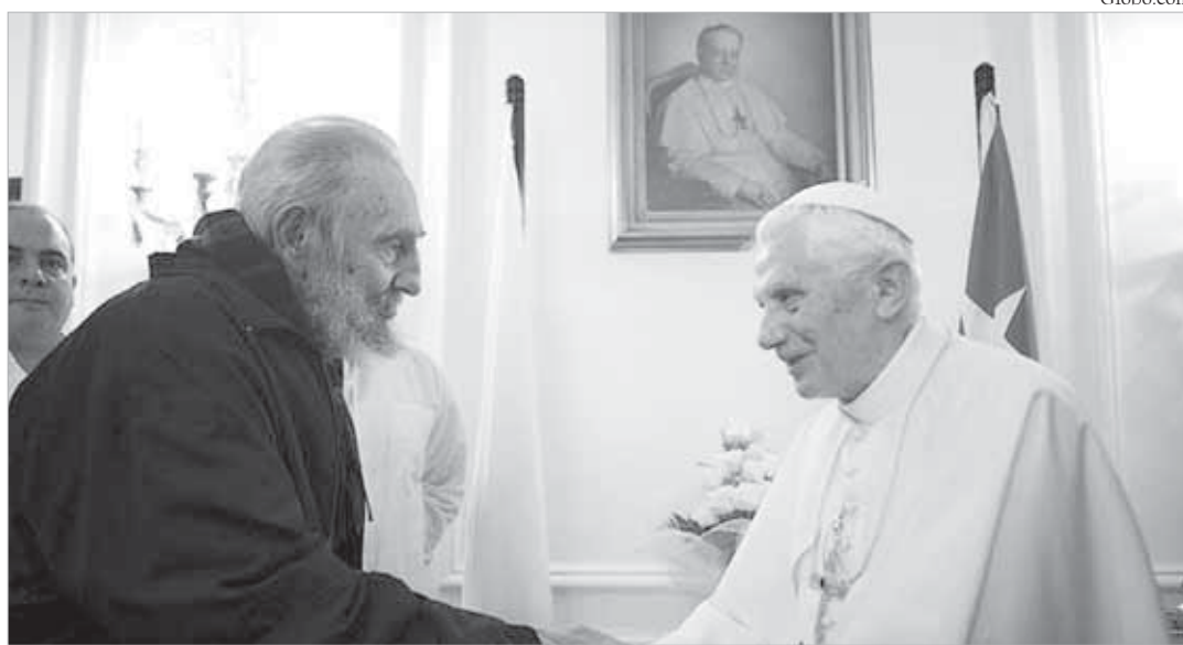
Papa Bento XVI durante encontro com Fidel Castro, em Cuba

No dia seguinte, o Papa se encontrou com crianças e fiéis na Praça da Paz, em Guanajuato, e se dirigiu de modo particular e especial aos "niños" que lá se encontravam. "Jesus quer escrever em cada uma das vossas vidas uma história de amizade. Por isso considerai-O como o melhor dos vossos amigos. Ele não se cansará