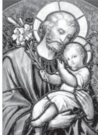
SÃO JOSÉ OPERÁRIO

Comunidade Santo Expedito - R. Seringueira, 331 - Estância dos Eucaliptos.