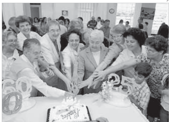
Irmãs jubilandas celebram a alegria da vocação

Bem conhecidas na Diocese de Santos, sete Irmãs de São José celebraram em Itu-SP, o jubileu de Vida Consagrada, a partir dos primeiros votos. São elas: