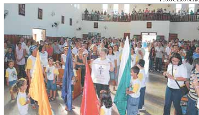
Na procissão de entrada, as bandeiras coloridas representam os cinco continentes, espaço de missão