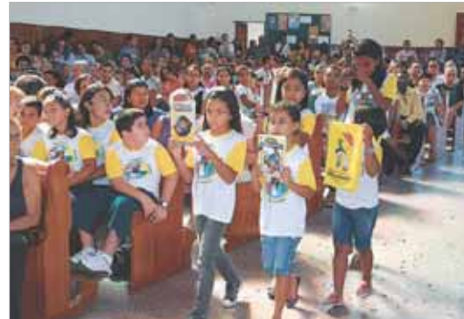
Crianças apresentam materiais usados nos encontros da IAM. Encenação na procissão de entrada da Bíblia