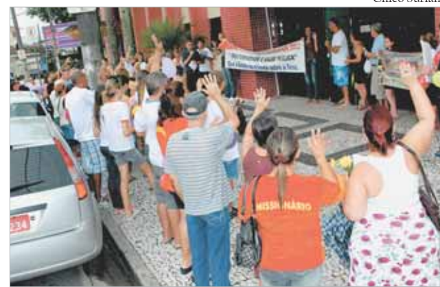
Ato em frente ao PS da Aparecida: mais atenção à questão da Saúde Pública

Para que a Campanha da Fraternidade não ficasse apenas na teoria, a Paróquia Nossa Senhora Aparecida (Santos) desenvolveu durante o mês de março diversas atividades.