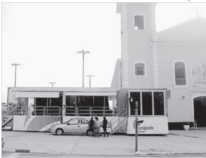
60 alunos estão tendo aulas na 'carreta-sala' estacionada na Praça em frente à Igreja S. João Batista