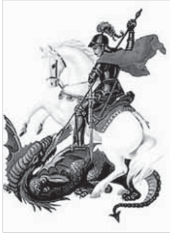
SÃO JORGE MÁRTIR

End.: Pça. Rubens Ferreira Martins, 41 - 3236-3528.