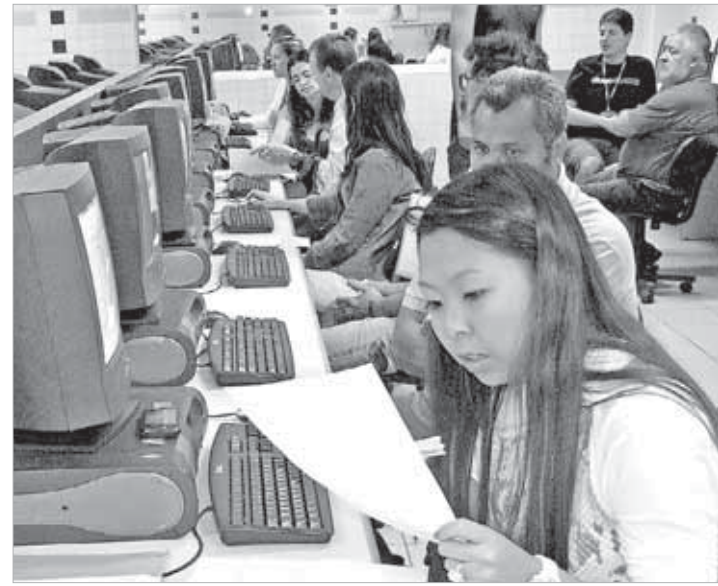
Atendimento ao público sobre Imposto de Renda

terça-feira a sábado, a partir do mês de abril.