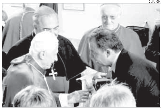
D. Orani (ao fundo à esq.), Papa Bento XVI e Governador do Rio de Janeiro Sérgio Cabral (dir)

O Comitê Organizador da próxima Jornada Mundial da Juventude (JMJ), que se realizará no Rio de Janeiro em julho de 2013 participou na Itália de um encontro promovido pelo Pontifício Conselho para os Leigos com os agentes da Pastoral da Juventude de todo o mundo. A reunião, que terminou no domingo, 1/4, reuniu delegados de 98 países, e os comitês organizadores da JMJ Madri 2011 e Rio 2013. O presidente do Pontifício Conselho para os Leigos, cardeal Stanislaw Rylko, acompanhou todo o evento.