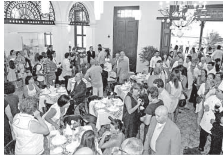
Inauguração do Restaurante-escola

Durante seis meses, 22 jovens serão capacitados. As aulas teóricas tiveram início no dia 8 de fevereiro e a previsão é que o restaurante esteja aberto ao público, de