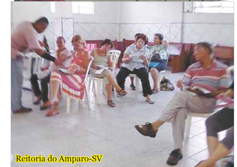
Reitoria do Amparo-SV