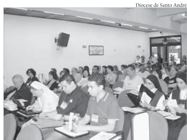
CF foi um dos temas abordados no encontro

Aconteceu dia 3 de Março, na Diocese de Santo Amaro reunião, a reunião ampliada com todos os Bispos da Sub-Região SP2, composta pelas dioceses de Osasco, Campo Limpo, Santo André, Mogi das Cruzes, São Miguel Paulista, Guarulhos, Santos e Santo Amaro.