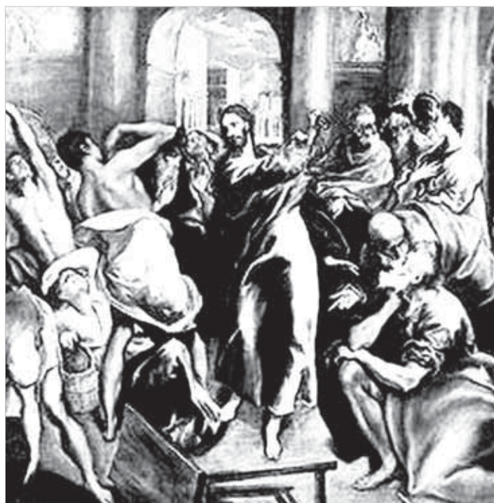
Jesus expulsos dos vendedores do templo (Jo 2,13-22)

O que há de mais decisivo em Jesus Cristo é a “saída de si mesmo, rumo à humanidade marcada pelo pecado” (DGAE). O fulcro de seus ensinamentos era o Reino de Deus. “Jesus foi andando de povoado em povoado e de al-