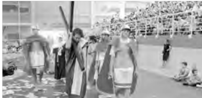
A Celebração Pascal reflete o tema da Campanha da Fraternidade

ser feito", informa texto da página oficial do movimento ( www.horadoplaneta.org.br ).