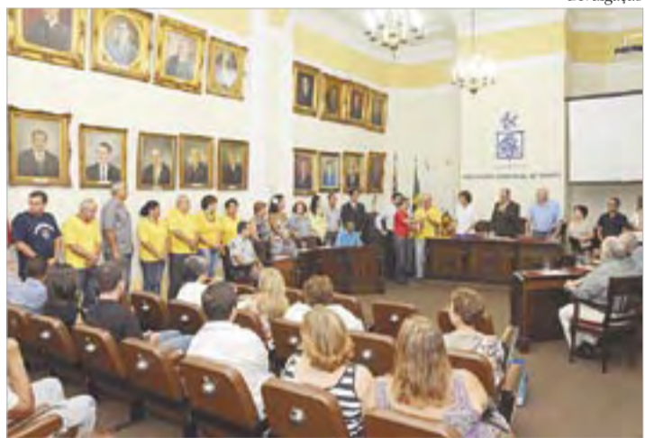
Trabalho da Casa Guadalupe recebeu homenagem do COMAD