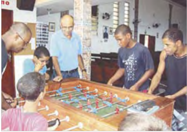
Lazer favorece a criação de vínculos de amizade

No dia 19 de março, a Pastoral do Menor da paróquia Beato José de Anchieta, no Humaitá, em São Vicente, teve sua primeira atividade com as crianças, adolescente e jovens da comunidade.