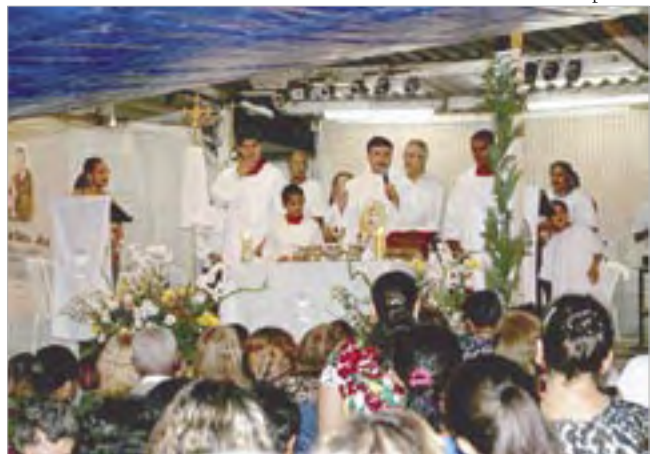
Festa do Padroeiro mobilizou comunidade e devotos