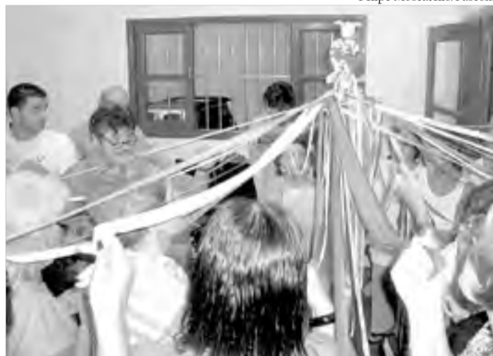
A Folia do Divino prossegue até 3 de junho, em Itanhaém

Na "Folia", as famílias ficam com a Bandeira do Divino durante um dia em suas casas, sendo que no seu re-