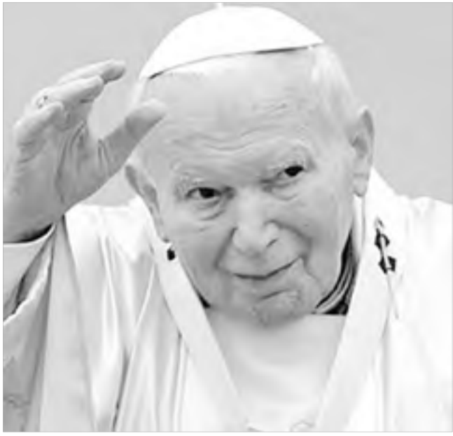
Papa João Paulo II será beatificado no dia 1/5

A Conferência Nacional dos Bispos do Brasil (CNBB) divulgou no dia 25 de março mensagem pela beatificação do papa João Paulo II, que ocorrerá no dia 1º de maio, em Roma. A mensagem foi aprovada pelo Conselho Permanente da Entidade, reunido em Brasília de 23 a 25.