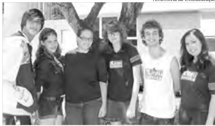
Alunos realizaram um trabalho de conscientização na escola

"O WWF-Brasil incentiva todos os participantes da Hora do Planeta a se comprometerem com a conservação da natureza e a desenvolverem projetos que visem sua sustentabilidade ambiental no longo prazo. São ações, por exemplo, que promovam o uso de meios de transporte menos poluentes e a coleta de lixo seletiva, a criação de unidades de conservação, a proteção das nascentes de água e o cumprimento da legislação ambiental são exemplos do que pode