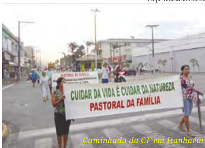
Caminhada da CF em Itanhaém