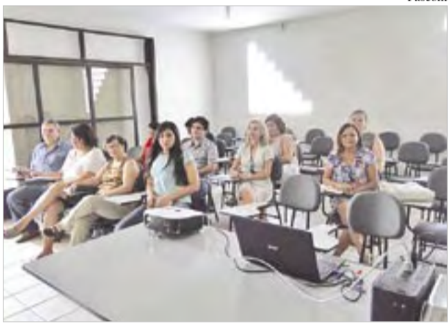
PASCOM estuda mensagem do Papa Bento XVI