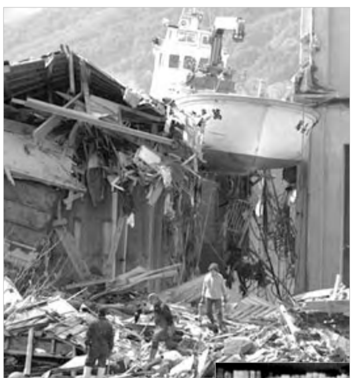
Depois do terremoto, veio a tsunami, o frio e ainda resta o perigo da radiação nuclear

Sucedo que, a certo ponto, os tremores se intensificaram. Como o corredor é longo e tem três portas, uma escada para sair do prédio, achei que poderia me salvar saindo por uma porta do