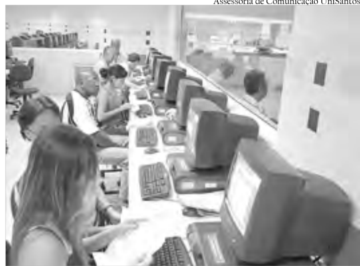
Atendimento realizado em 2010: 255 declarações

Os interessados deverão trazer comprovantes de recebimentos do ano 2010, comprovantes de pagamentos de despesas médicas, dentistas, hospitalares, laboratoriais e plano de saúde com o CNPJ do beneficiário.