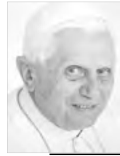
Papa Bento XVI

O Senhor não deixa de chamar, em todas as estações da vida, para partilhar a sua missão e servir a Igreja no ministério ordenado e à vida consagrada; e a Igreja “é chamada a proteger este dom, a estimá-lo e amá-lo: ela é responsável pelo nascimento e pela maturação das vocações sacerdotais” (João Paulo II, Exort. ap. pós-sinodal Pastores dabo vobis, 41). Especialmente neste tempo, em que a voz do Senhor parece sufocada por “outras vozes” e a proposta de O seguir oferecendo a própria vida pode parecer demasiado difícil, cada comunidade cristã, cada fiel, deveria assumir, conscientemente, o compromisso de promover as vocações. É importante encorajar e apoiar aqueles que mostram claros sinais de vocação à vida sacerdotal e à consagração religiosa, de modo que sintam o entusiasmo da comunidade inteira quando dizem o seu “sim” a Deus e à